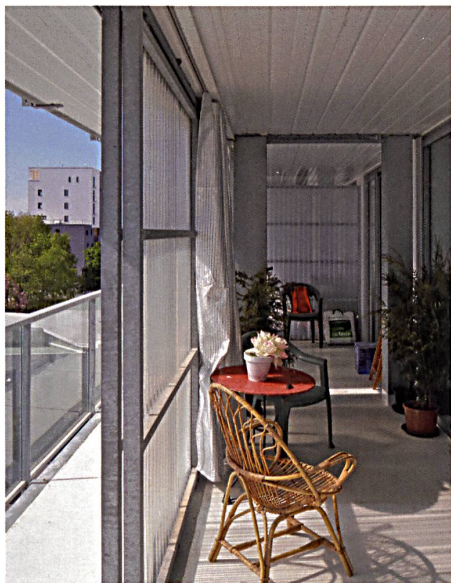
Räumlicher Mehrwert: Im bretonischen St-Nazaire verwendeten Lacaton & Vassal Stahl nicht nur für die Erweiterung des bestehenden Wohnturms, sondern auch für den Erweiterungsbau. → S. 32