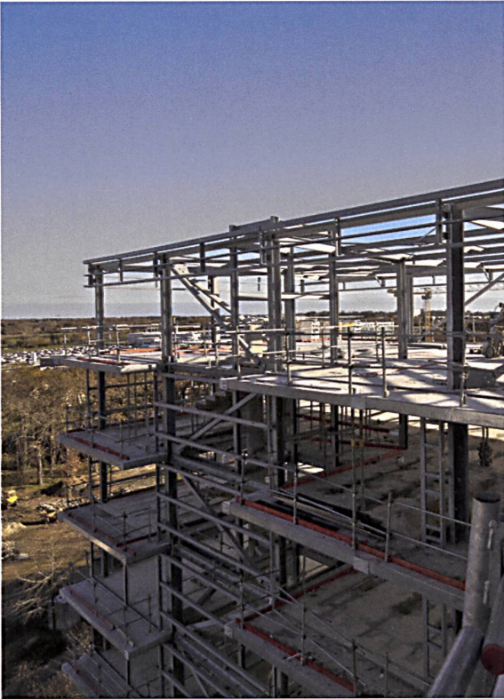
Erprobtes Grundprinzip: Einfachste Stahlstruktur als Industrieprodukt, Addition eines Wintergartens als Pufferzone, umlaufende Balkonschicht.