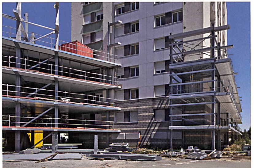
Renovation und Erweiterung statt Abbruch, Ergänzungen aus Stahl: neue Wohnflügel (links) sowie Wintergartenzonen und Balkone für den Bestand (rechts).

La Chesnaie Adresse 3, rue des Ajoncs, 44600 Saint-Nazaire Bauherrschaft Silène Habitat, Saint-Nazaire Architektur Anne Lacaton & Jean-Philippe Vassal Architectes Paris, mit Frédéric Druot Mitarbeiter: Julien Callot Fachplaner Tragwerk: CESMA (Stahlbau), PLBI (Beton) Bauphysik: Cardonnel Akustik: Guy Jourdan HLKS: AREA Baukosten: Vincent Pourtau Bauleitung Mabire & Reich, Nantes Bausumme total (exkl. MWSt.) 6.6 Mio. CHF Geschossfläche 10 282 m 2 (3 725 m 2 bestehend, 1 645 m 2 Erweiterungen, 4 912 m 2 Neubau) Chronologie Wettbewerb 2006, Bezug bestehende Wohnungen 2014, neue Wohnungen 2016