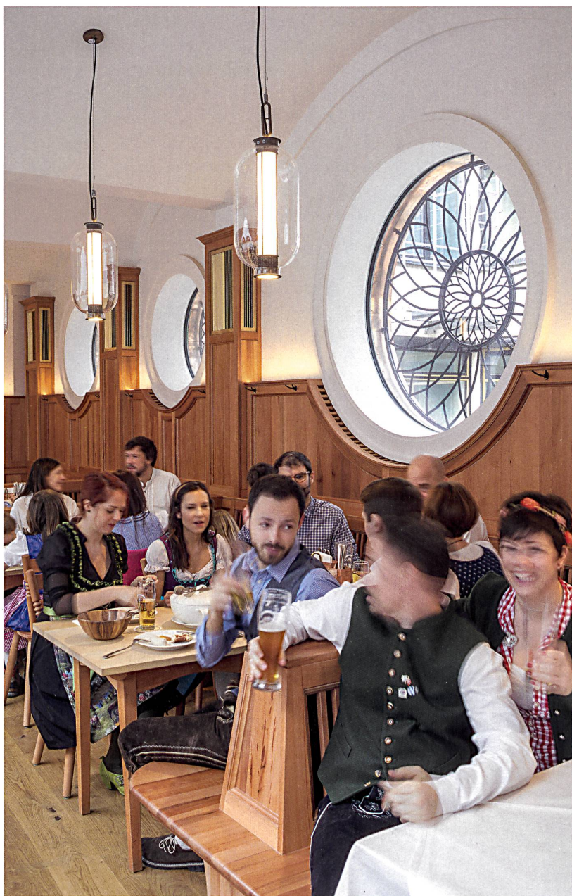
Mehr als ein Klischee: Im Münchner Wirtshaus lässt es sich gemütlich sitzen. Das neu gebaute Donisl von Hild und K Architekten, 2015.