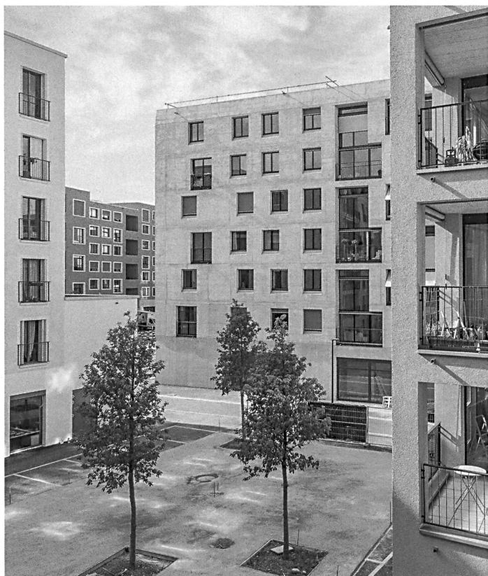
Jüngstes Beispiel eines Städtebaus aus Baublöcken ist das Hunziker-Areal in Zürich-Leutschenbach, das wir in wbw 10 – 2015 vorgestellt haben.

Aus der Barockzeit ist uns der Baublock beispielsweise der Stadt Turin überliefert. Der Stadtgrundriss der Altstadt aus der Römerzeit verschmilzt hier mit der frühbarocken Stadterweiterung. Die Anordnung der Strassen und Plätze im Ensemble mit den Baublöcken führt zu einer besonderen stadträumlichen Qualität und Identität der Stadt. Erst nach der masslosen Spekulation mit dem städtischen Boden – beispielsweise im Berlin des späten 19. Jahrhunderts – verbreitet sich ein negatives Bild des Baublocks. Die Gründe liegen darin, dass die öffentliche Hand nur die grobe Erschliessung neuer Stadtteile mit Strassen und Leitungen vorgibt, während die privaten Immobiliengesellschaften die Baublöcke maximal ausnützen. Sie verzichten auf teure Unterteilungen der grossen Strassengevierte mit zusätzlichen Strassen innerhalb der fünfgeschossigen Regelbauweise. Die berüchtigten Hinterhöfe mit all ihren negativen Erscheinungen werden zu Recht kritisiert.