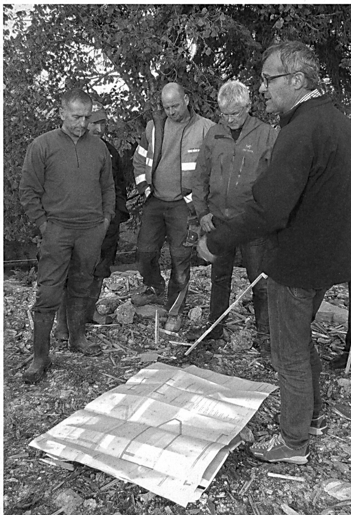
Zusammenarbeit als bürgerschaftliches Engagement. Freiwilliger Einsatz beim Bau der Kapelle Salgenreute in Vorarlberg (vgl. wbw 9–2017).

Veranstaltung zum Thema Architektur und Kooperation: