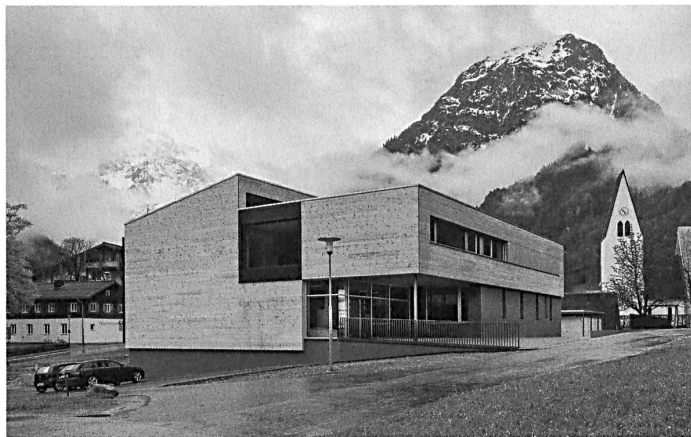
Schule und Kindergarten in Brand A