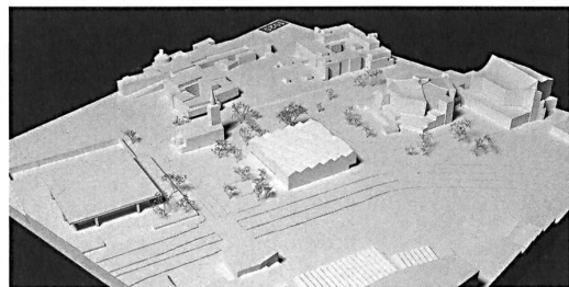
3. Preis Bruno Fioretti Marquez: Kompakte Box mit umlaufender Platzfolge