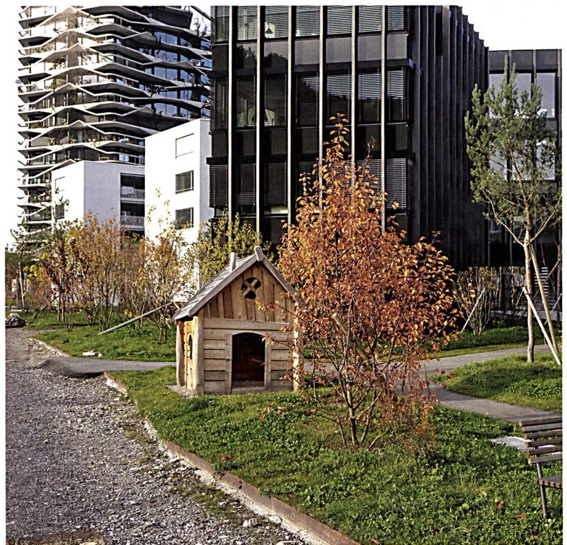
Ein buntes Nebeneinander. Von links: Hochhaus von Buchner Bründler, Hofgebäude von LVP, Wohnhaus von Graber Steiger Architekten.