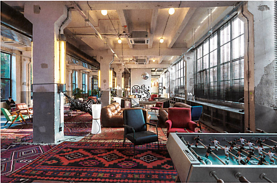
Die Lobby des Fabrika-Hostels im Masstab der alten Industriehalle wird durch Teppich-Inseln gegliedert.

6 www.icomos.org.ge Als Reiseliteratur empfiehlt sich der Architekturführer von Philip Meuser bei DOM Publishers Berlin, der voraussichtlich April 2017 erscheint: ISBN 978-3-86922-325-4. www.dom-publishers.com