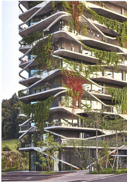
Den organisch geformten Garden Tower in Wabern BE von Buchner Bründler (2016) umspielt kletternde Vegetation, die an Netzen emporrinkt. Sie verbindet die Geschosse und ihre Bewohner und vermittelt zwischen geschützten Räumen und freier Sicht. → S. 6