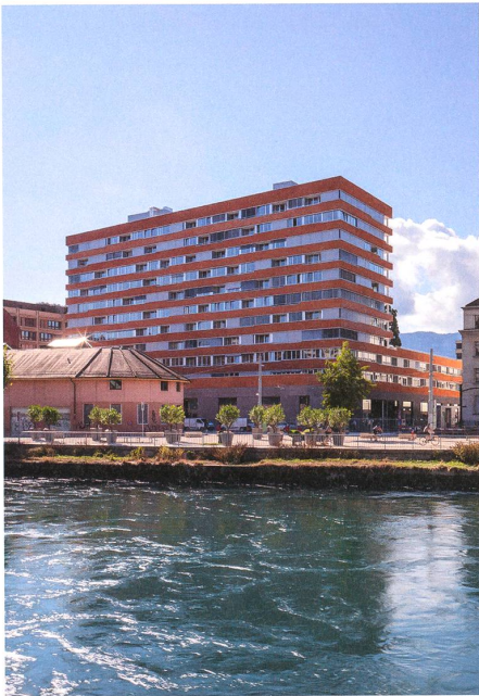
Das gemeinschaftlich bewohnte Hochhaus der Genossenschaft CODHA von Dreier Frenzel erhebt sich als Wahrzeichen des Ecoquartiers Jonction über dem blau-grünen Wasser der Rhone im Zentrum von Genf. → S. 52