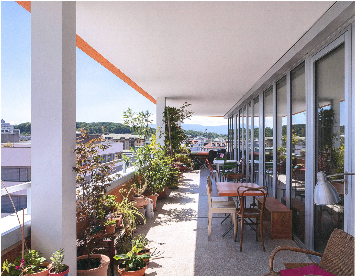
Die geräumigen Laubengänge sind nicht nur Wohnungerschliessung; sie dienen auch als privater Freisitz, als Treffpunkt und Spielfläche für die Kleinen.

wbw Hat die Grösse des Projekts Jonction für die CODHA spezifische Vorteile gebracht?