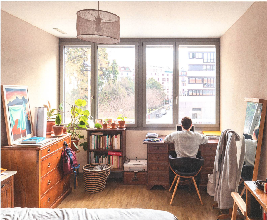
Oben: Die langgezogene Wohnküche an der Hofferrasse ist das Herz der Cluster-Gemeinschaft La Tribu , wo mehrere Generationen zusammenleben. Unten: Wohnraum in einem Cluster-Appartement.

João Fernandes Die Mitsprache der Mitglieder geht bei der CODHA fast so weit wie bei einer Eigentumswohnung: Grundrisse, Ausstattung und Materialisierung werden eingehend diskutiert.