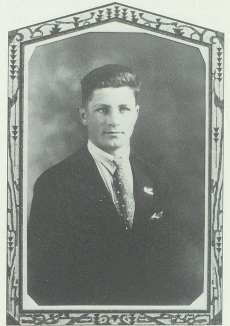
Foto des 20jährigen aus Kanada, im Originalrähmchen zum Aufstellen.

Zeilen und wusste, dass er es nicht leicht hatte.