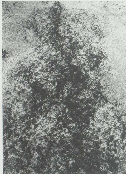
Der intensive Pilz- und Algenbewuchs am Turm bedingte die Gesamterneuerung des Verputzes.

Gemeinsam wurde folgender Massnahmenkatalog erarbeitet: