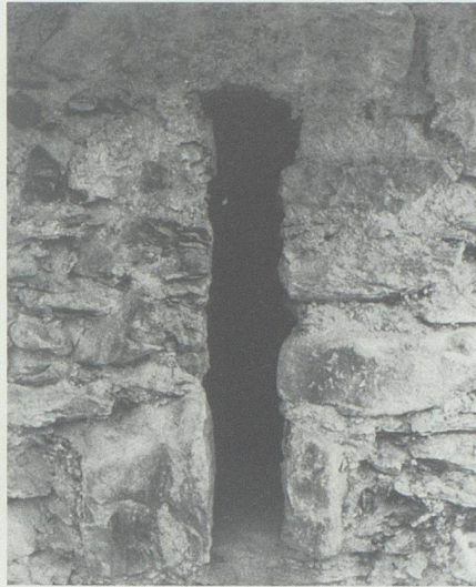
Lichtscharte am Turm.

Nach Entfernung der teilweise sehr harten Verputzschicht trat ein gut gefügtes Mauerwerk aus bruchrohen Natursteinen zutage. Sowohl an den Ecken wie im Mauerverband waren kapitale Blöcke vermauert worden. Dagegen fehlen die für Mauerwerke des 13. und 14. Jahrhunderts charakteristischen buckligen Eckquader, ebenso die Fugenstriche. Interessant sind die Spuren eines steilgiebligen Steindachs auf der Südseite etwa in halber Höhe des Turms. Es scheint, dass der