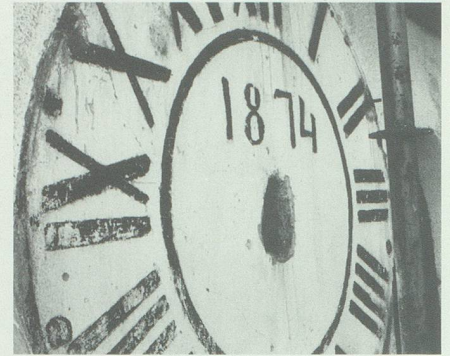
1874 installierte man eine Turmuhr. Auf der Süd- und der Nordseite malte man einen einfachen Ziffernkranz auf den Verputz.

Der gedrungene Turm hebt sich wuchtig vom zierlichen spätgotischen Chor ab.