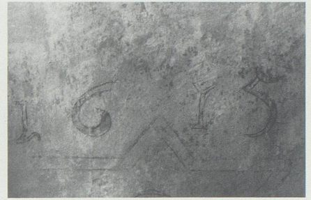
Freigelegte Jahrzahl 1615 im Chorscheitel.

polychromer Fassungen. Diese Tatsache bewog den Kirchenverwaltungsrat, die empfohlenen Freilegungs- und Restaurierungsarbeiten in Auftrag zu geben, obwohl diese ursprünglich nicht geplant waren.