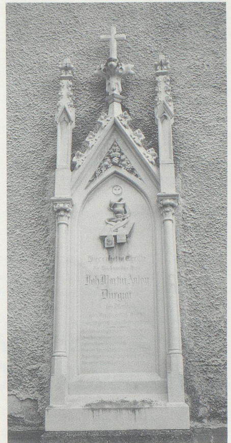
Durgiais Grabmal beim Hauptportal der Pfarrkirche.

Zunehmende Solidarität erfuhr Durgiai eigentlich erst nach der Konsekration. Und erst als der Tod den Gamsern ihren wohl bemerkenswertesten unter allen bekannten Pfarrherren entrissen hatte,