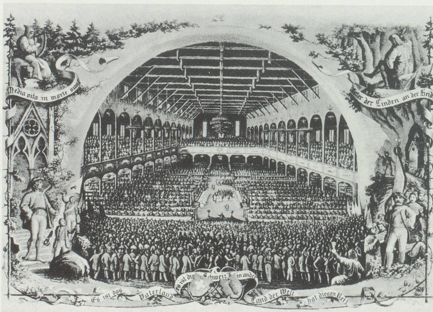
Das Innere der Halle des eidgenössischen Sängertages in St. Gallen bei der Hauptaufführung 1856. Lithographie von Johann Baptist Isenring von Lütisburg (1786–1860). (Aus Rimli, «650 Jahre Eidgenossenschaft», Zürich 1941.)

Hauser 1989: A. HAUSER, Das Neue kommt. Schweizer Alltag im 19. Jahrhundert . Zürich 1989.