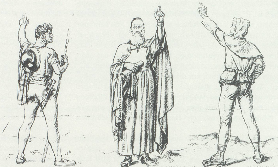
«Die vom Rütli». Studien von L'Éplattenier. (Aus Rimli, «650 Jahre Eidgenossenschaft», Zürich 1941.)

Von ähnlichen Eindrücken können wohl die meisten Schweizer und Schweizerinnen erzählen, von Schulreisen aufs Rütli,