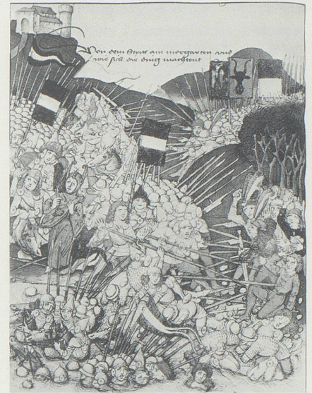
Schlacht am Morgarten, Auftakt der Schlachtenbilder. Berner Chronik Diebold Schilling (1483).

Man kann sich fragen, was dieser Aufsatz mit dem Werdenberg zu tun hat – und das Werdenberg mit der Gründungsfeier der Eidgenossenschaft! Denn in den ersten Jahrhunderten der Eidgenossenschaft lag das Rheintal völlig ausserhalb ihrer Perspektive, und erst nach dem Schwabenkrieg wurde mit dem Kauf der Grafschaft Werdenberg durch die Glarner eine letzte Lücke an der erreichten Rheingrenze geschlossen. In den Untertanengebieten der Eidgenossen war vor 1798 wenig von Demokratie und wirtschaftlicher Entfaltung zu spüren. Dennoch wurde im Kanton St. Gallen und dem sich bildenden liberalen Bundesstaat von 1848 die «gemeinsame» eidgenössische Vergangenheit in Schule und Öffentlichkeit beschworen, wirkten die gleichen nationalen Symbole, nahm man teil an der historistischen Ausstattung des Bewusstseins mit geschichtlichen Bildern. Die Erforschung und Darstellung der eigenen, werdenbergischen Ver-