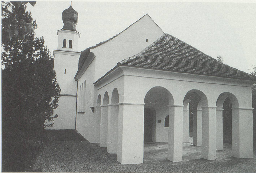
Die Kapelle Maria Hilf bei Balzers erinnert an den blutigen Überfall von 1289. Der Überlieferung nach wurde sie von Heinrich von Frauenberg, dem damaligen Besitzer von Gutenberg und Helfer des Bischofs, gestiftet.