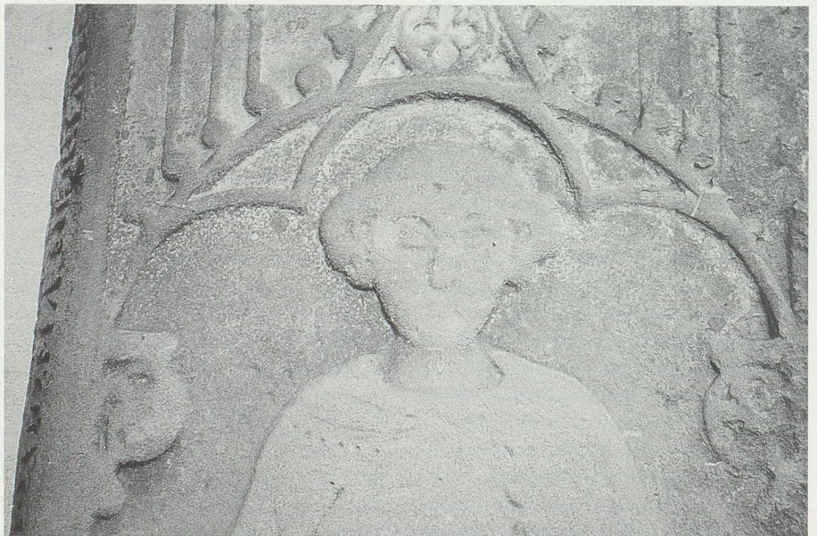
Beim Eingang der Churer Kathedrale aufgestellte Grabplatte des Domdekans Albero von Montfort († 1311). Der Montforter hatte sich für die Freilassung von Bischof Friedrich eingesetzt.

So werden der Todessturz von Bischof Friedrich und die Fluchten und Kriegszü-