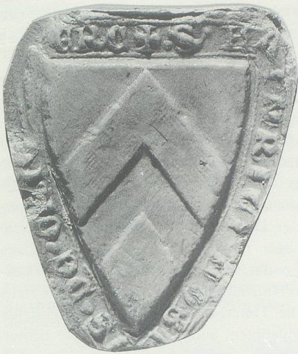
Siegel von Heinrich von Griesenberg, dem treuen Ministerialen von Abt Wilhelm, der mit Bischof Friedrich auf Schloss Werdenberg gefangen war und erst viel später freikam. (Historisches Museum St.Gallen.)

16. Oktober schloss, befristet bis Ende 1294. Darin werden zuerst die bestehenden Herrschaftsrechte über die Untertanen gegenseitig zugesichert, dass diese ihnen «dienon in der gwonheit als vor des chünges ziten und nach rechte». Sodann wird vereinbart, dass man kriegerische oder besser räuberische Unternehmungen, wenn jemand den Bündnispartnern «in ir lant wolti varn», oder im Falle von Zürich, «anriten an ir stat, an ir reben ald [= als] an ir boumen und die wolti wüsten», zu verhindern suche, andernfalls werde man ihn «angrifen mit roube, mit brande und mit allem das wir darzuo getuon mugen». Freilich behält sich jede Partei selber vor, falls sie in eigener Initiative «eine vesti besizzen [= belagern] wil ane der ander rat», so solle das weiterhin möglich sein. 49 Unter dem Konstanzer Bischof Rudolf von Habsburg (aus der Linie Laufenburg) und den Montfortern sammelten sich nicht nur zahlreiche Adlige, sondern auch die Städte Konstanz und Zürich zu einem Aufstand. «In der hertzen tail kam graf hug uon werdenberg vnd graff Ruodolff von Sangans vnd alles Curwalhen.» 50 Im November griff man die Stadt Buchhorn (= Friedrichshafen) an – sie war noch von König Rudolf an Graf Hugo von Werdenberg verpfändet worden – und nahm sie ein «ze scheff vnd ze fuoss», und am gleichen Tag fiel auch «alles Curwalhen land» ins Appenzellische ein, das mit Ausnahme von Hundwil in Flammen aufging. 51