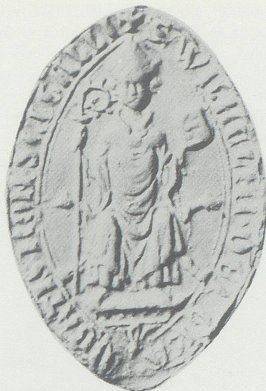
Siegel von Wilhelm von Montfort.

(Kriegs), den er gegen König Rudolf von Habsburg angezettelt hatte und dessen prominentestes Opfer nun sein leiblicher und geistlicher Bruder Friedrich geworden war.