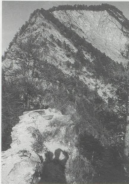
Ruine Alt-Aspermont bei Trimmis, hoch über dem bischöflichen Gut Molinära, Zufluchtsort von Abt Wilhelm von Montfort im Jahr 1290.

Nach dem Tode des unglücklichen Bischofs Friedrich nutzte Hugo III. von Werdenberg die Gunst des Augenblicks: Bischof von Chur wurde 1290 der schon erwähnte Berthold II. von Heiligenberg, der letzte eines einst mächtigen Gaugrafengeschlechts und durch seine Mutter ein Neffe der Freiherren Johann und Donat von Vaz. Er ist bezeugt in Chur seit 1283. 39 Alle seine Rechte hatte er an Hugo von Werdenberg verkauft, und dieser wird wohl auch die Wahl durchgesetzt haben. Ihr erwuchs allerdings von Seiten des Sohns oder Bruders des bei Balzers gefallenen Eberhard von Aspermont Widerstand. Zusammen mit seinem Sohn schädigte er das Domkapitel durch Vieh- und Getreideraub. Dies geht aus einem später ausgehandelten Vertrag zwischen dem Bischof und denen von Aspermont hervor. 40