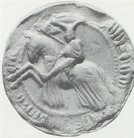
Siegel von Hugo II. von Werdenberg-Sargans. Dem treuen Parteigänger von König Rudolf von Habsburg gelang der Überfall auf Bischof Friedrich von Montfort bei Balzers im Jahr 1289.

Schwieriger zu beurteilen ist das politische Wirken der geistlichen Montforter: Erkannten sie die Bedeutung der damals aufstrebenden gesellschaftlichen Kräfte, der Bürger in den Städten, der Bauern in den Talgemeinschaften als der neuen wirtschaftlichen und auch militärischen Kräfte, die auch neue Rechte verlangten? Die Montforter gerieten mit ihrem Ziel der Errichtung einer Landesherrschaft in einen ausgewogenen Gegensatz zum ersten Habsburger König, der, von den gleichen Voraussetzungen der hochadligen Landespolitik ausgehend, mit allen Mitteln, mit juristischen, verwaltungstechnischen und auch mit kriegerischer Gewalt, die Selbständigkeit und Gegnerschaft eines Teils des Adels zum Reich bekämpfte. In diesem vielfältigen Mächtenspiel bildeten sich ständig neue Koalitionen aus den