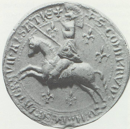
Siegel von König Rudolf von Habsburg.