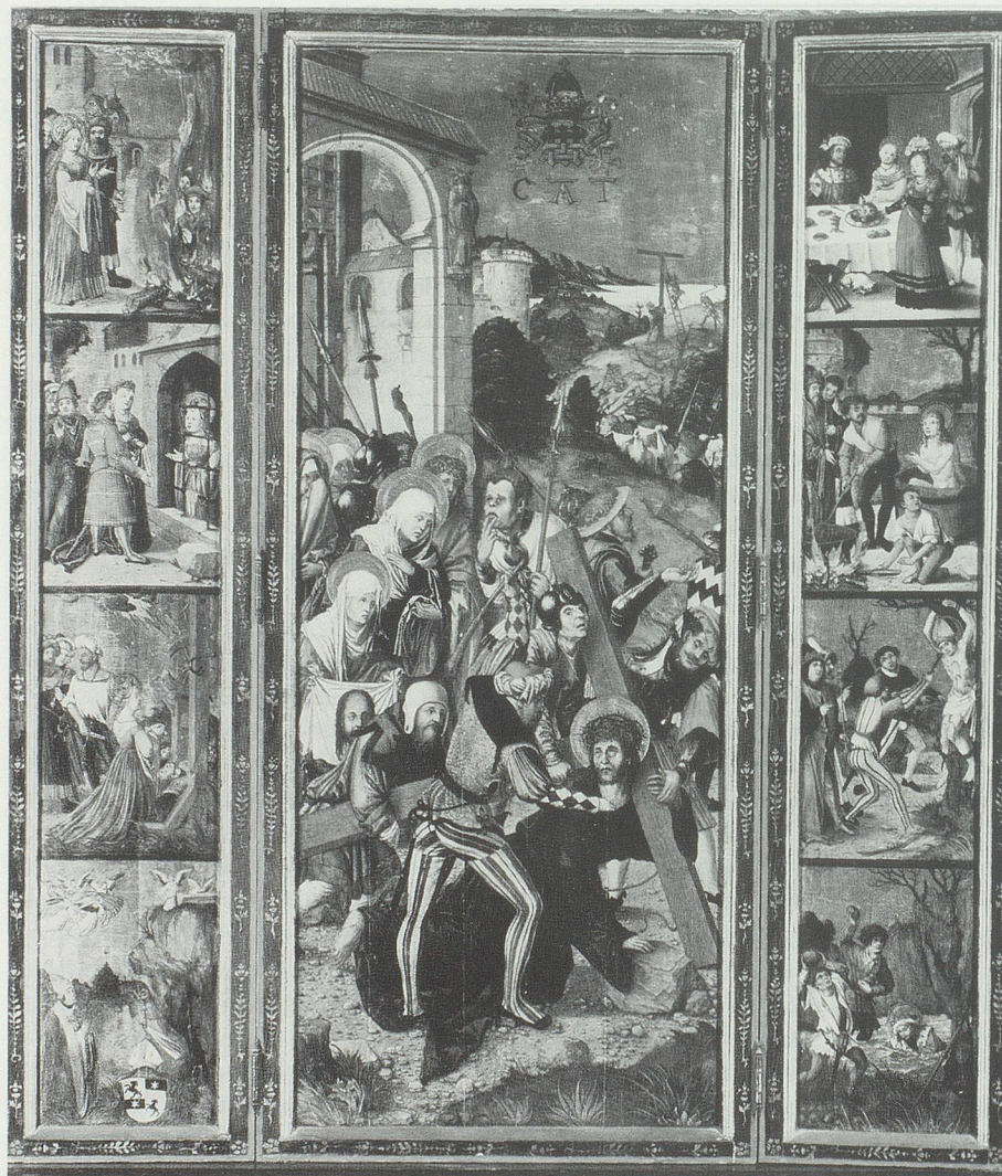
Beim Katharinenaltar in der Kathedrale von Chur wurde Bischof Friedrich begraben. Die drei Tafeln des heutigen Altars mit den Bildern zur Katharina-Legende wurden um 1510 gemalt und gehören zu den bedeutenden Flügelaltären der Schweiz.

der aptye gient [auf die Abtei verzichtete] vnd im si uff gëb mit der herren willen. Vnd kament des überân. Vnd ward apt Ruomen darumb vil gehaissen. Apt Ruoman râtgeben vnd die im haimlich waren kilchen ze lihen vnd silber ze geben vnd andre ding, das laider wider dem rechtem waz.» 27 Man kann sich leicht denken, wieviele gegenseitige Angriffsflächen das Bemühen sowohl des Königs wie auch des Montforters bot, möglichst umfassend Rechte und Besitzungen an sich zu ziehen. 28 Der entscheidende Streitpunkt im Jahre 1287 lag im Ansinnen des Königs, dass der Abt Klosterlehen an Rudolfs Söhne erteilen solle. Nach verschiedenen Kriegshandlungen, «blutigen Gefechten, Belagerungen und bei allgemeiner Ver-