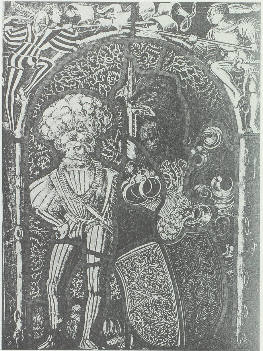
Wappenscheibe des Freiherrn Ulrich VIII. (1462–1538). Seine Kleidung, die Hellebarde in seiner Hand, der Helm und die zwei Kämpfer im oberen Bildteil verweisen auf seine Berühmtheit als Söldnerführer.

Wie andere Adlige im Ostschweizer Raum mussten sich die Saxer an die mächtigsten Herren anlehnen, wenn sie ein standesgemässes Leben führen wollten. Die wirtschaftlichen Vorteile aus Lehen, Beamtentum und Söldnerwesen bedingten die politische Abhängigkeit. 20 So kämpften die Freiherren von Sax mehrmals auf der Seite Österreichs gegen die Eidgenossen. Sie beteiligten sich an der Auseinandersetzung Habsburgs gegen Zürich, das 1351 als fünfter Ort der Eid-