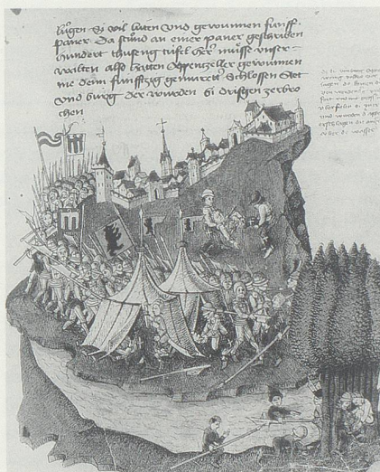
Der Überfall auf die Appenzeller bei Bregenz 1408 nach der Bilderchronik von Tschachtlan (1470).

Mit der Schwächung der Königsgewalt seit dem Ende der Stauferherrschaft begann der Kampf des Hochadels um möglichst zusammenhängende Herrschaftsbereiche; dieser Prozess der Verdichtung der Herrschaft und der Übergang zur Landesherrschaft fand seinen Abschluss erst im Nationalstaat des 19. Jahrhunderts. Seit dem 14. Jahrhundert versuchten Städte (und innerhalb der Eidgenossenschaft auch Länderorte), Kleinherrschaften in ihrem Einflussbereich aufzukaufen. Das Ergebnis war «eine Sammlung löche-