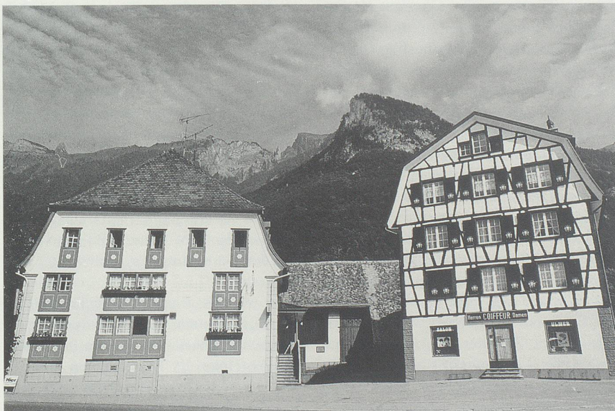
Der Gasthof zum «Adler» (links) in Sennwald wurde 1605 erbaut, 1926 renoviert und 1962 erweitert. Das Wirtswesen gehörte zu den «Ehaften»-Gewerben, die nur mit obrigkeitlicher Bewilligung ausgeübt werden durften und einen hohen Status genossen.

Die Reformation der Herrschaft Sax-Forstegg fand in den Jahren 1564 bis 1566