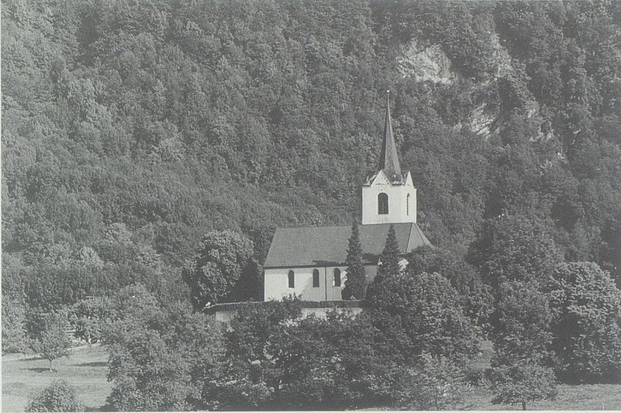
Die Kirche von Sennwald. Die Reformation der Herrschaft Sax-Forstegg war im wesentlichen eine Folge der jahrhundertlangen Beziehungen mit der Stadt Zürich.

stellt Kreis für das 18. Jahrhundert einen Rückgang des Bussenertrages fest. Er interpretiert dies als ein Zeichen milderer Gerichtspraxis und «einer freieren Stellung der Untertanen». 125