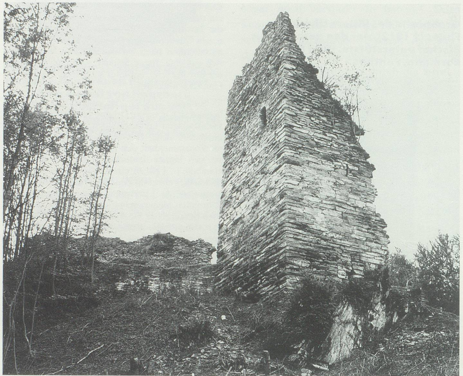
Die Reste der Burg Hohensax, der Stammfeste der Freiherren, vermutlich erbaut 1206, erstmals erwähnt 1210. Die Appenzeller zerstörten sie 1446 während der Auseinandersetzungen des Alten Zürichkriegs. Damals gehörte die Burg den mit Habsburg verbundenen Herren von Bonstetten.

Bis ins 17. Jahrhundert bleibt diese Untersuchung aufgrund der Thematik und der vorliegenden Literatur vor allem im politischen und adelsgeschichtlichen Rahmen. Gelegenheit für sozial- und wirtschaftsgeschichtliche Ansätze bietet dann die ausgiebige Betrachtung der Herrschaft als Zürcher Landvogtei. Die Erkenntnis, dass neben «grossen Persönlichkeiten» eine Mehrheit in sozial tieferstehenden Schichten mit einer erwähnenswerten Geschichte existierte, ist zwar nicht neu, aber immer wieder bemerkens-