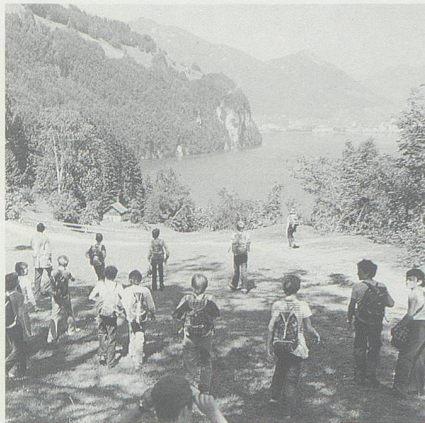
Die Schulreise aufs Rütli, früher für jede sechste Primarklasse eine Selbstverständlichkeit.

Und heute? – Der Geschichtsunterricht habe dem Mittelstufenschüler 6 auch ein Grundwissen über Entstehung und Entwicklung der Eidgenossenschaft zu vermitteln, verlangt der aktuelle «Lehrplan für die Primarschulen des Kantons St. Gallen». 7 Dafür steht jedem Sechstkläss-