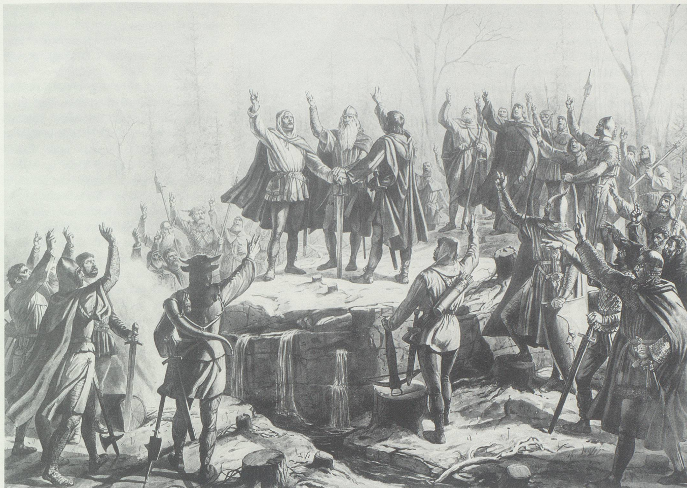
Der Rütlichswur, gezeichnet von Karl Jauslin (1842–1904). Grossformatige Jauslin-Bilder waren ehemals in den meisten Schulhäusern als Anschauungsmittel vorhanden.

Wie erwähnt, war die Einbettung der Geschichte unserer Heimat in den grösseren Zusammenhang der Weltgeschichte ein Anliegen unserer Erziehungsdirektion, das den Lehrern schon früh empfohlen wurde. Der Unterricht in den oberen Klassen sollte bis in unser Jahrhundert hereinführen. Doch gerade in dieser Hinsicht traten offenbar Mängel zutage.