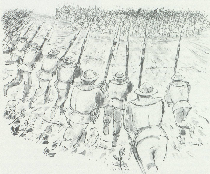
Die Abwehr fremden Einflusses als prototypisches Bild schweizerischen Geschichtsverständnisses. (Illustration von A. Saner im st.gallischen Geschichtsbuch «Geschichte der Schweiz», Band II, S. 87.)

«Wenn Heimat als Identität im räumlichen Sinne, verbunden mit der Kontinuität von Werten, Symbolen usw. angesehen wird, so ist die Betrachtung des Geschichtsunterrichts sicher ein guter Indikator für die Untersuchung eben dieses Heimatbegriffes», steht in einer Untersuchung über den Geschichtsunterricht der Volksschule. 1 Was bewirkt denn heute in der modernen Konsum- und Mediengesellschaft Identität? Was stiftet das Bewusstsein von Kontinuität und Identität beim häufigen Wohnortwechsel oder bei der starken Einwanderung und Anwesenheit von Ausländern? Diese Frage ist vor