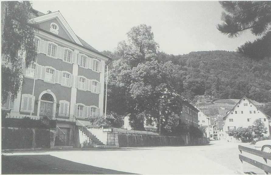
Noch heute bilden die stattlichen Sulser-Häuser den eigentlichen Dorfkern von Azmos.

ten noch jetzmahligen G[emeinde]Rath sind nie die geringsten Missshelligkeiten gewesen. Solche heimliche Klagen werden aber gewiss nicht berücksichtigt, rechtliche Männer machen ihre Klagen ungescheut & öffentlich. Gesezt sie wären so behandelt, so mögen sie solches der competenten Behörde einklagen, wo sie sicher Schuz gegen jede Unterdrückung finden werden. 12