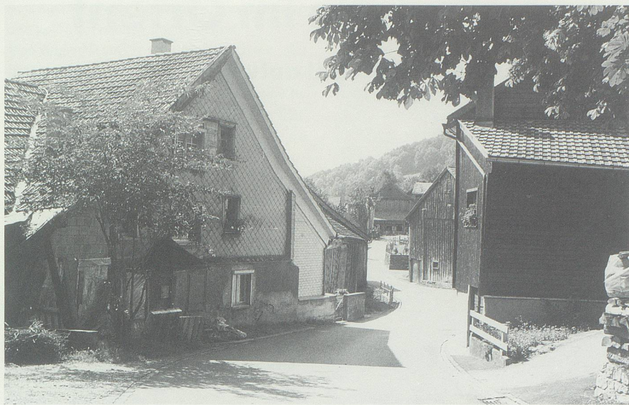
Dorfpartie in Malans SG: Zusammen mit Malans versuchte Azmoos seinem Trennungsbegehren grösseres Gewicht zu verleihen.

«Azmoos, d. 26. Merz 1832. Der Gemeinde Rath der Gemeinde Azmoos, an die vom Grossen Rath des Cant. S. Gallen zur Prüfung der Vorschläge über die Gebiets Eintheilung eingesetzte Commission.