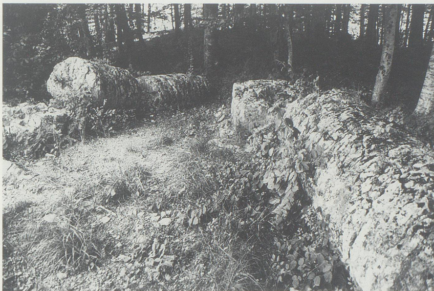
Die beiden Säulen des Galgens.

Da sich die alte Richtstätte am Waldrand befindet und mit Gebüsch und Bäumen umgeben ist, konnte lediglich ein Sondierschnitt von 160 cm Länge und 70 cm Breite zwischen den Säulen angelegt werden. Die stark durchwurzelte dunkelbraune