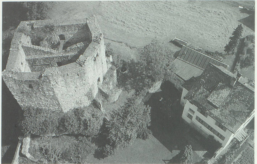
Ruine Forstegg bei Salez. Auf diesem ehemaligen Saxer Herrnsitz wurde um 1600 die Manessische Handschrift aufbewahrt.

Als Mutter der vil schoenen minne , das ist Christus, 37 nimmt sie die Sünder barmherzig unter ihren Schutz, sie allein vermag den Zorn Gottes zu besänftigen und die Menschen zur wahren Liebe zu führen. Eberhard erfindet in seinem Lied keine neuen Bilder. Die Hörer kannten sie aus lateinischer Hymnenliteratur und deutschsprachiger Mariendichtung. Die sinnliche Betonung Marias als Braut und Geliebte des Herrn weist aber auf eine neue Religiosität hin, die im 14. Jahrhundert als ekstatische Brautmystik nicht zuletzt bei den Dominikanern ge- und erlebt wird. Ein Nachfahre Heinrichs und Eberhards spielt schliesslich noch einmal eine Rolle in der Geschichte der Manessischen Liederhandschrift: Johann Philipp von Hohen-