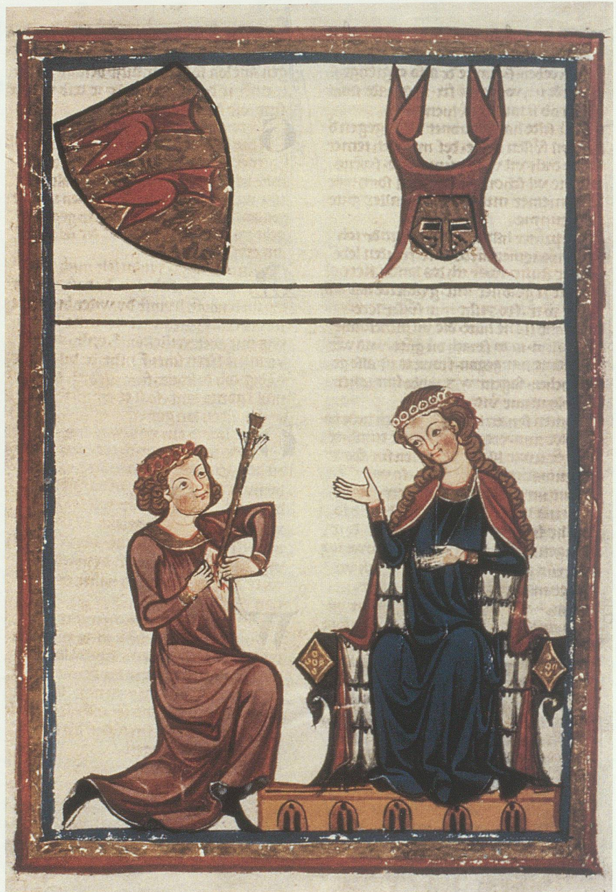
Engelhart von Adelnburg. Codex Manesse fol. 181v. Vom Minnepfeil getroffen, kniet Engelhart von Adelnburg vor seiner Geliebten.

Ein ganz anderes Leben hat der Neffe Heinrichs gewählt, der ebenfalls im Codex Manesse vertreten ist. Als bruder Eberhart von Sax tritt er am 26. April und am 9. November 1309 in zwei Urkunden als Zeuge auf. 16 Zweifellos gehörte er also dem Zürcher Dominikanerkloster an und ist wirklich der Mönch gewesen, als der er