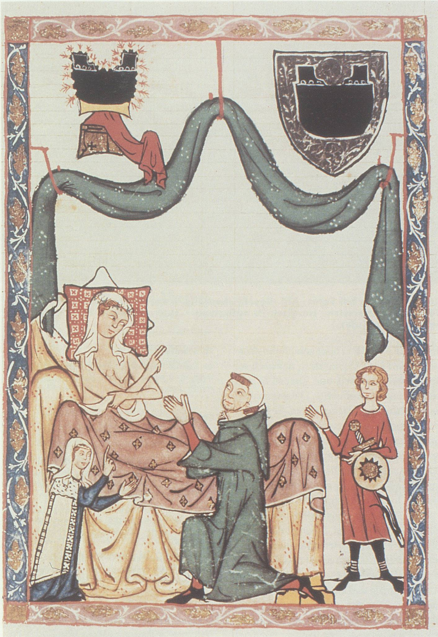
Meister Heinrich Teschler. Codex Manesse fol. 281v. Das Bild stammt vom gleichen Maler wie die Miniatur Eberhards. Es zeigt deutlich den Humor und die offensichtliche Fabulierlust des Künstlers.

gegen Gottes Gebot ass. Die hast Du von der Strafe befreit mit tugendhaftem Bemühen. Was immer Dir jemand an Lob schriebe, das ist die Unbeständigkeit eines Schattens gegenüber der Grösse Deiner Würde, die keine Zunge je verkünden könnte. Zu einem guten Ende kannst du das törichte Beginnen Evas wenden.) 36