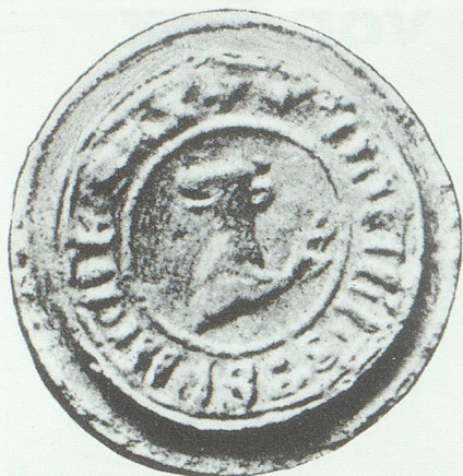
Siegel des Ulrich Stephan von Sax.

die für die staufische Macht und Politik von grosser Bedeutung waren. Dem Besitzer der Herrschaft Misox, einem saxischen Stammland, kam eine eigentliche Schlüsselstellung der Nord-Süd-Achse zu. Anfang des 13. Jahrhunderts dehnten die Saxer ihren Besitz nach Norden aus und beherrschten nun auch den Verkehr im St. Galler Rheintal, einer wichtigen Etappe auf der Route Bodensee-Italien.