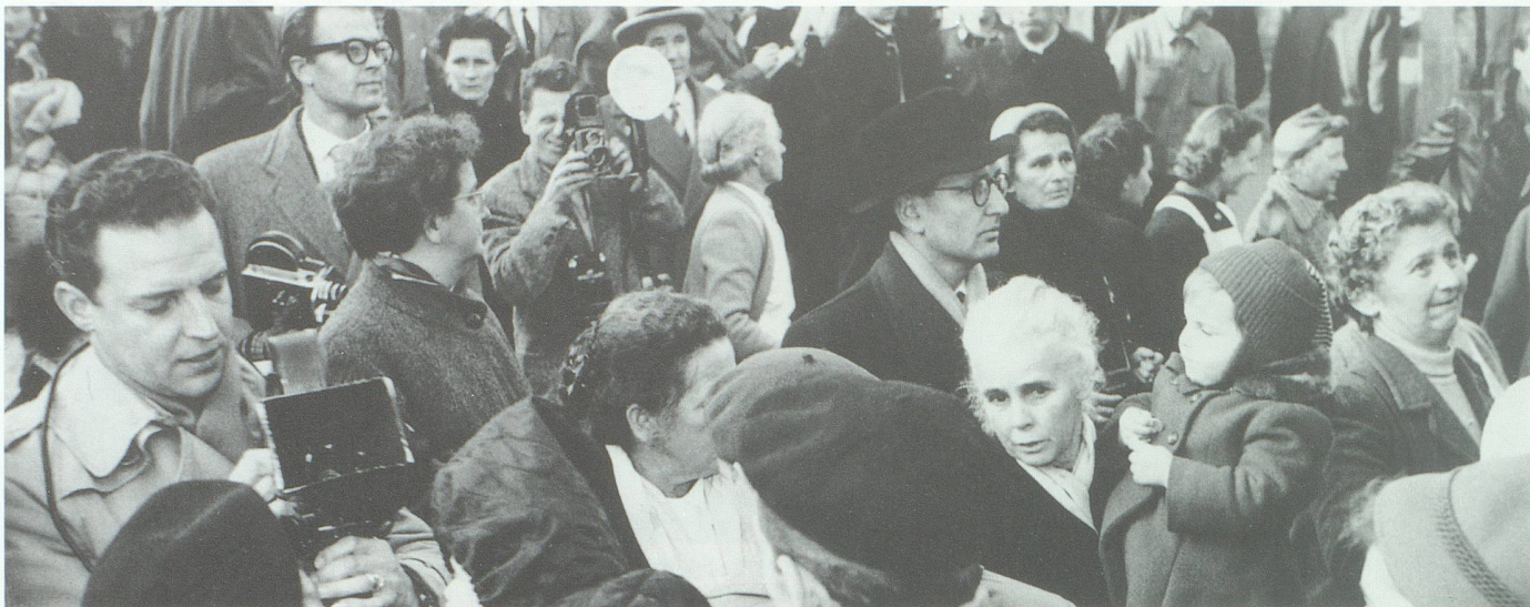
Unter Schaulustige und Flüchtlinge mischten sich auch Fotoreporter.