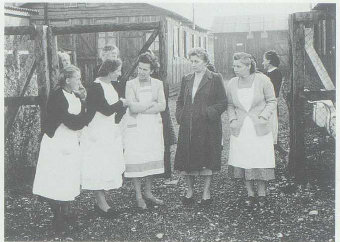
Beim Barackenlager (Areal heutige Post Bahnhof) stehen einheimische Rotkreuz-Helferinnen bereit.