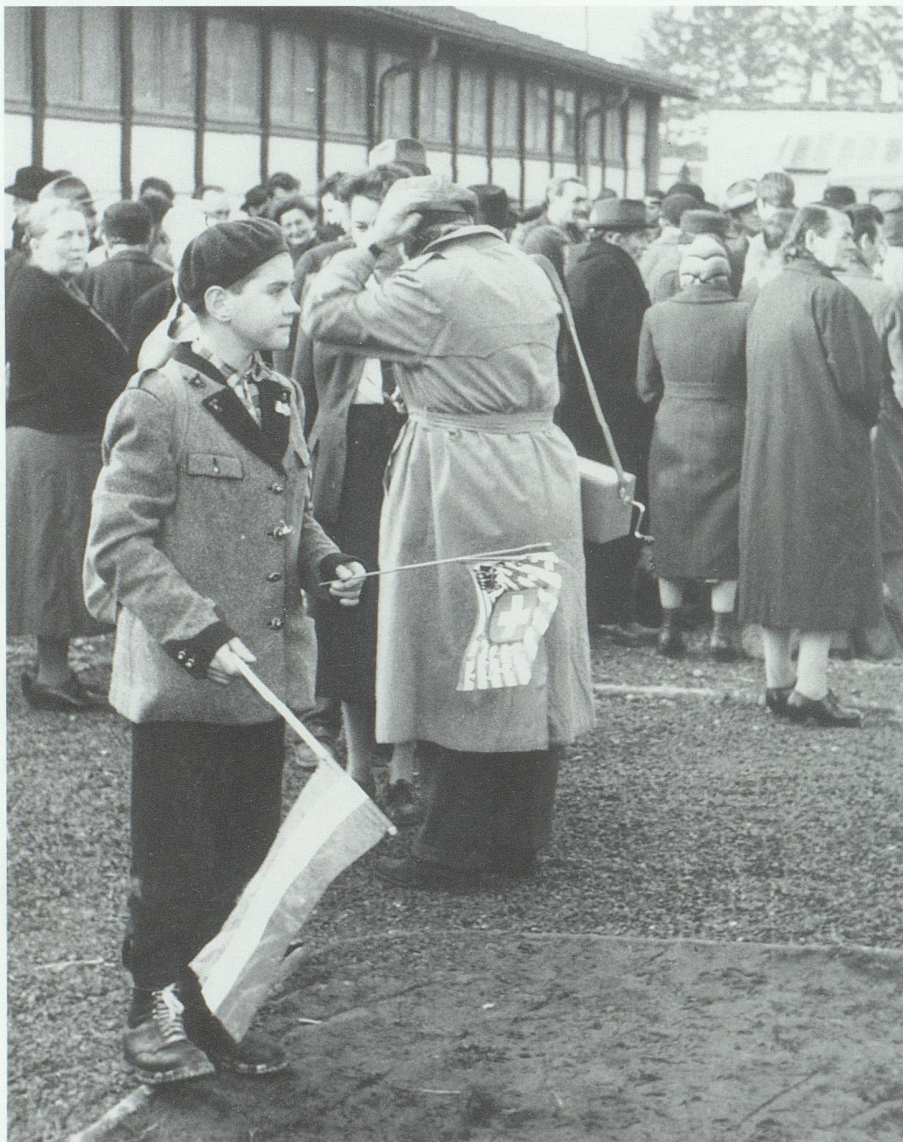
Auf freiem Boden! Ein ungarischer Junge schwenkt ein Schweizerfähnchen und die Fahne seines Heimatlandes.

hält dazu fest: «Kurz nach zwei Uhr nachmittags traf ein Sonderzug mit 364 Flüchtlingen in Buchs ein. Eine grosse Menschenmenge hatte sich zur Ankunft auf dem Bahnhof eingefunden, um den Flüchtlingen in herzlicher Weise Sympathie und Willkomm zu entbieten. Im Barackenlager des Grenzsanitätsdienstes wurden auch diese Ungarn aufgenommen, der notwendigen sanitärischen Untersuchung unterzogen und selbstverständlich auch gepflegt. Zum grössten Teil wurden sie dann noch am gleichen Abend weitergeleitet zu ihren vorläufigen Unterkunftsorten in den Kantonen Zürich, Graubünden und St.Gallen, ihrer hundert nach Wildhaus, wo sie in drei Ferienheimen untergebracht werden.»