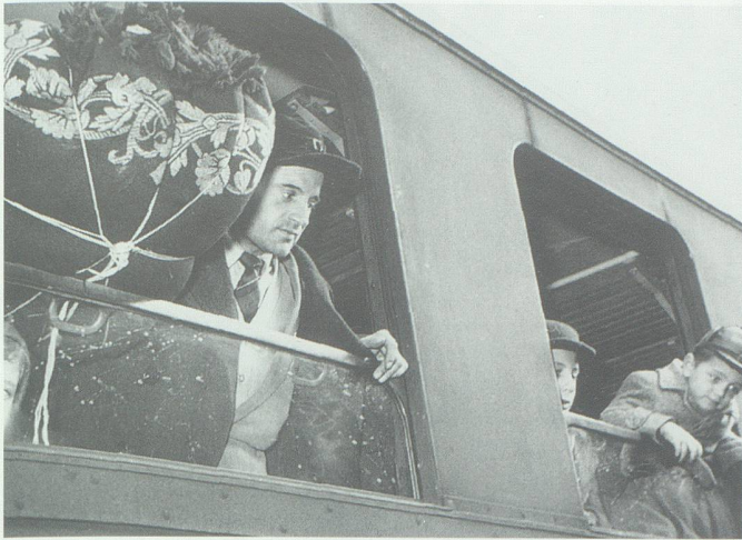
Fragende Blicke aus den Wagenfenstern des eingefahrenen Zuges.