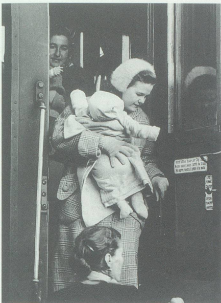
Eine ungarische Mutter mit ihrem Kleinkind entsteigt sorgenvoll dem Wagen.