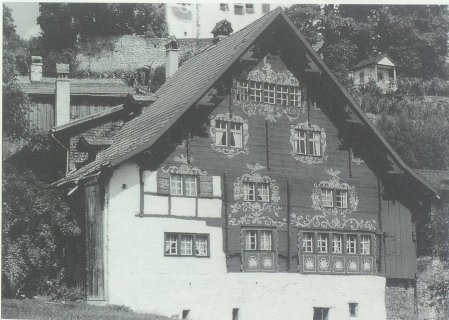
Das Schlangenhaus im Städtli Werdenberg.

Die damit auch aufgeworfene Frage nach dem finanziellen Rückhalt all dieser aufblühenden Kultureinrichtungen findet unterschiedliche Antworten. Es fällt auf, dass recht oft finanzstarke Mäzene – Personen, Stiftungen oder Firmen – hinter solchen Institutionen stehen. Aus persönlicher Neigung oder in weitsichtiger Verpflichtung dem historischen Erbe gegenüber engagieren sie sich in uneigennütziger Weise. Nicht wegzudenken ist heute das Kultursponsoring durch Wirtschaftsunternehmen, die zumeist in zurückhaltend-diskreter Weise diese Sparte als vornehmen Teil ihrer PR-Politik pflegen. Ohne diese Formen der vertrauensvollen Vorausleistung wäre auch das Museumsprojekt Regionalmuseum Schlangenhaus kaum geboren worden und sicher noch nicht beim gegenwärtigen Stand der Sammlung von annähernd einer Million Franken angelangt.