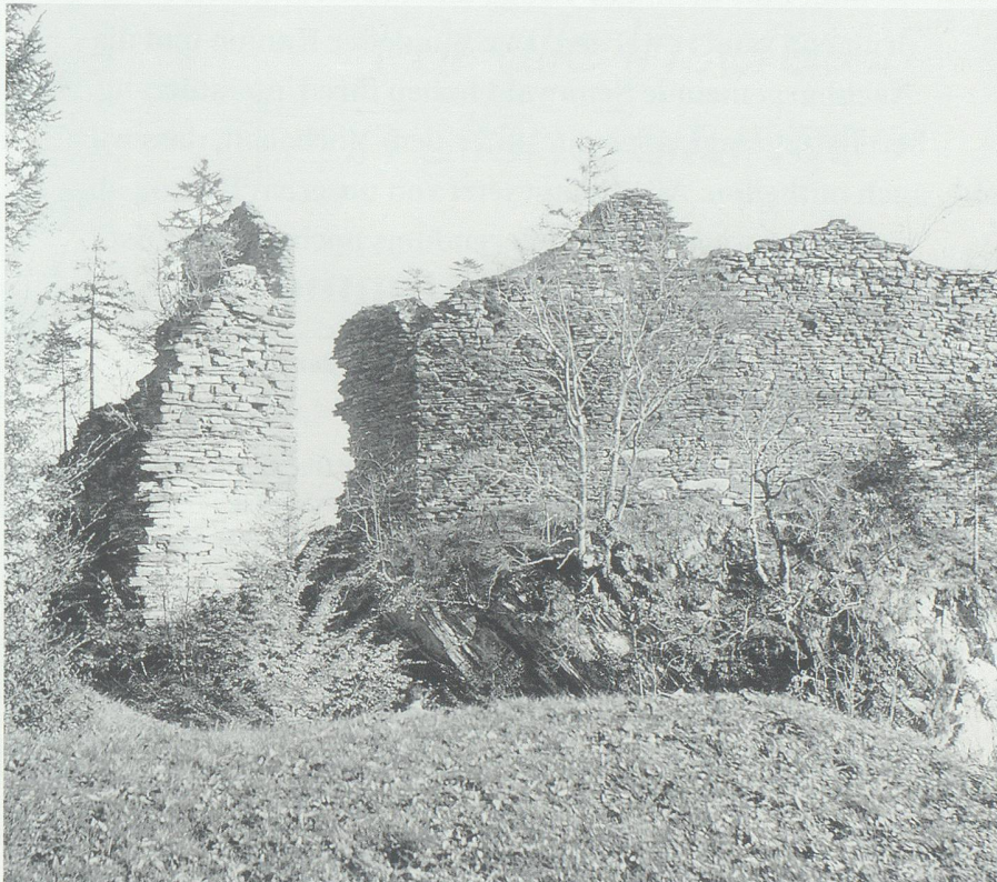
Der Zustand der Ruine Hohensax vor 40 Jahren.

Es lag nun an den Bürgern der Gemeinden Gams und Sennwald, ebenfalls noch die Gemeindebeiträge zu bewilligen. Vom 25. Januar bis 23. Februar 1995 wurden diese dem fakultativen Referendum unterstellt. Während die Bürger der Gemeinde Sennwald nichts gegen die Restaurierung der Ruine Hohensax einzuwenden hatten, machte sich in Gams kurz vor Ablauf der Referendumsfrist Opposition bemerkbar.