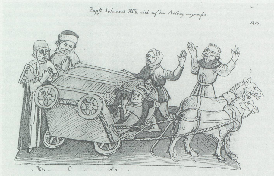
Verkehrsunfall im Mittelalter. Auf seinem Weg zum Konstanzer Konzil kippte 1414 der Reisewagen des (Gegen-)Papstes Johannes XXIII. auf dem Arlberg um. Zeitgenössische Darstellung in der Chronik des Konzils von Konstanz von Ulrich Richental.

Seit der Antike ist das Rheintal eine wichtige Verkehrsverbindung auf der europäischen Nord-Süd-Achse. Nachdem schon die Römer hier auf ihrer Heeresstrasse nach Germanien gezogen waren, rückte im Laufe des Mittelalters die Bedeutung als Fernhandelsstrasse in den Vordergrund. Als Zufahrt zu den Bündner Pässen bildete das Rheintal ein Verbindungsstück zwischen den beiden grossen Wirtschaftsräumen Lombardei und den Bodenseestädten. Noch heute rollt hier vor allem Strassenverkehr zwischen Deutschland, der Schweiz und Italien. Heute von geringerer Bedeutung, wurde gerade im Spätmittelalter neben der Nord-Süd-Verbindung jene in ost-westlicher Richtung immer wichtiger. Gemeint ist die um 1309 eröffnete Hallfahrt, der im 14. Jahrhundert eine wachsende Bedeutung zukam. 1 Damals wurde der Passweg über den Arlberg ausgebaut, damit die wichtigen Salztransporte aus Hall im Tirol (bei Innsbruck) auch im Winter geführt