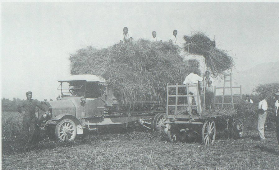
Der kettenbetriebene erste Lastwagen des Strassenkreisinспекtorates Buchs beim Streuetransport im Saxerriet.

Spezielle Weisungen galten für den Dienst in der Garage: Jeden Abend musste der Wagen in vollkommene Fahrbereitschaft gestellt werden. Diese Arbeiten umfassten hauptsächlich das Reinigen vom gröbsten Schmutz, das Ölen und Schmieren des Mechanismus, die Ergänzung aller Betriebsmittel – Benzin, Öl, Fett und Kühlwasser –, die Vornahme einfacher Reparaturen und die Instandstellung der Beleuchtungsanlage. Wöchentlich wurde der Wagen zudem während eines halben Tages ausser Betrieb gesetzt, gründlich gereinigt und revidiert.