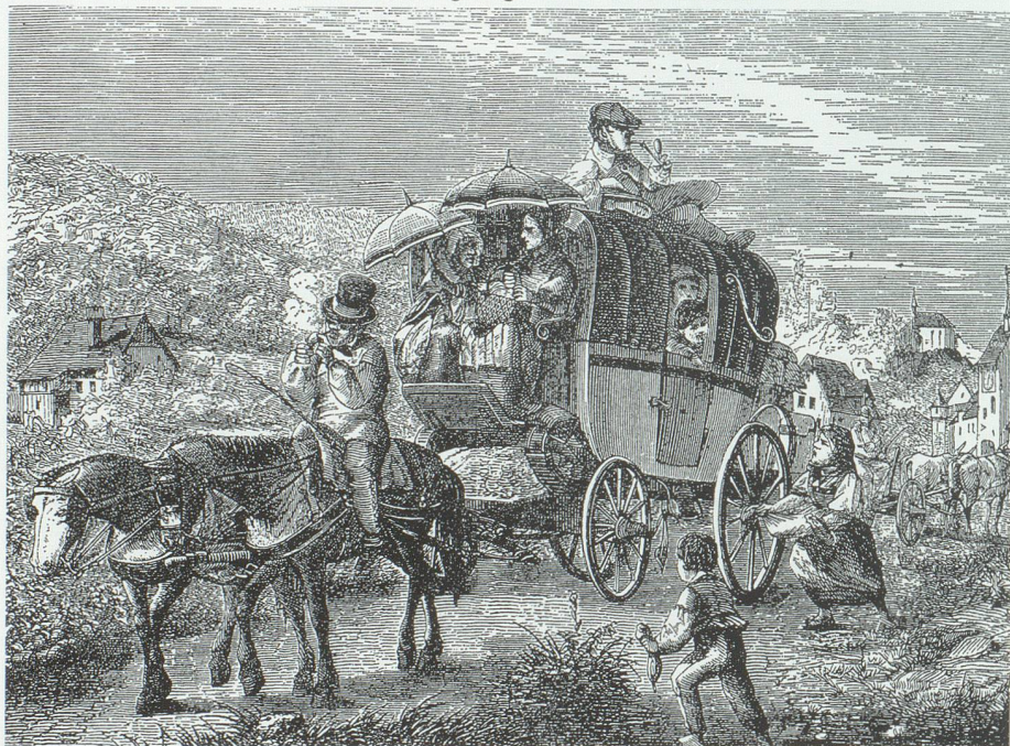
Im 19. Jahrhundert war die Fahrt in einer Kutsche auf holprigen Strassen eine malerische, aber beschwerliche Angelegenheit. Bild aus Mittler 1988.

«Das Baudepartement Namens der Strassenverwaltung des Cantons St.Gallen übergibt dem Christian Fuchs in Salez von der Staatsstrasse No. 1 die Abtheilung von dem Stundenstein XII bis Stundenstein XIII in einer Länge von 16 000' [Fuss] zum Unterhalte in Pacht oder Akkord. Unter den dem Chr. Fuchs übergebenen & von demselben in Akkord übernommenen Unterhaltsarbeiten ist verstanden & inbegriffen: Der gehörige Unterhalt der Fahrbahn, das Reinigen der Seitengraben & der