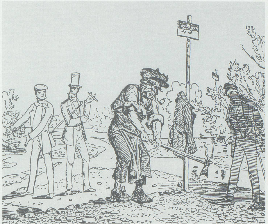
Strassenunterhalt als lästige Pflicht – noch im 19. Jahrhundert begnügte man sich mit minimalem Aufwand. Die Zeichnung aus dem «Postheiri» von 1855 zeigt, wie Arbeitslose stümperhaft an einer Strasse arbeiten. Zeichnung aus Mittler 1988.

Bei wirklicher Vernachlässigung der übernommenen Strassenstrecke aber wird der betreffende Pacht betrag theilweise oder ganz solange zurückbehalten, bis den Ver-