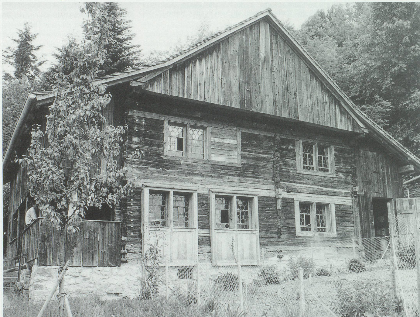
Besuch in Schellenberg: Das sogenannte Biedermannhaus, Zweigstelle des Liechtensteinischen Landesmuseums, ein bedeutender Zeuge der Bau- und Wohnkultur des 16. bis 19. Jahrhunderts.

Ich bedanke mich herzlich bei allen, die sich im abgelaufenen Jahr gemäss unseren Zielsetzungen in direkter Mitarbeit, mit materiellen Zuwendungen oder dem Einbringen von interessanten Ideen und Anträgen engagiert haben.