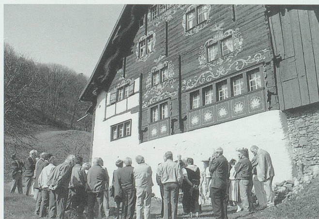
Mit einem feierlichen Akt wurde am 22. April 1996 der Baubeginn begonnen.

Thematisch ergeben sich gegenüber dem schon früher vorgestellten Konzept keine wesentlichen Änderungen. Der neue Akzent liegt vielmehr in der emotionaleren Interpretation und in der gestalterischen Anpassung an diese neue Ausrichtung.