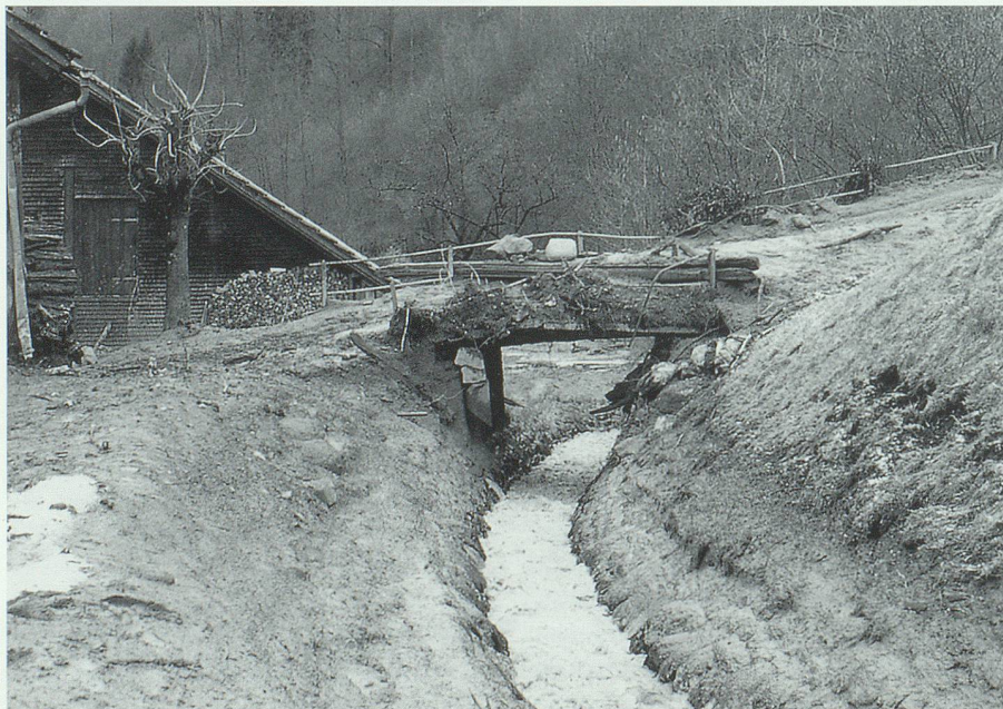
Überschwemmungsschäden am Lognerbach (Grabs) nach dem Unwetter vom Februar 1990.

Art. 49: Die Leitung und Aufsicht der Unterhaltung des Grabserbachs wird 2 sachkundigen Männern, die unter besonderer