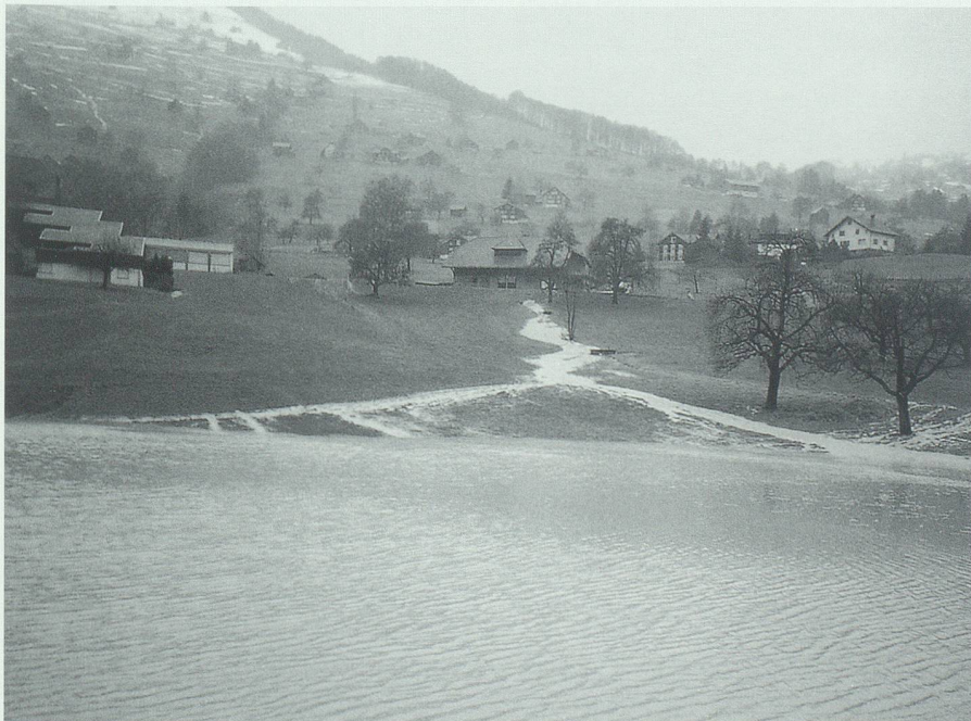
Der grosse Regen vom Dezember 1991 führte unterhalb des Lukashauses zu einem See.