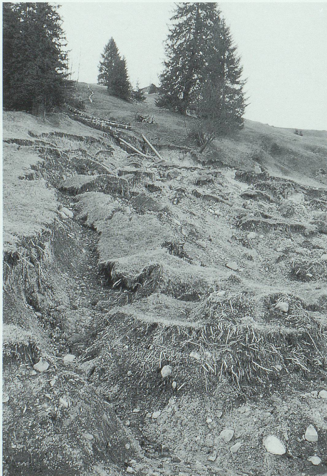
Erdrutsch in der Röhliweid am Oberen Grabserberg im Jahr 1994.