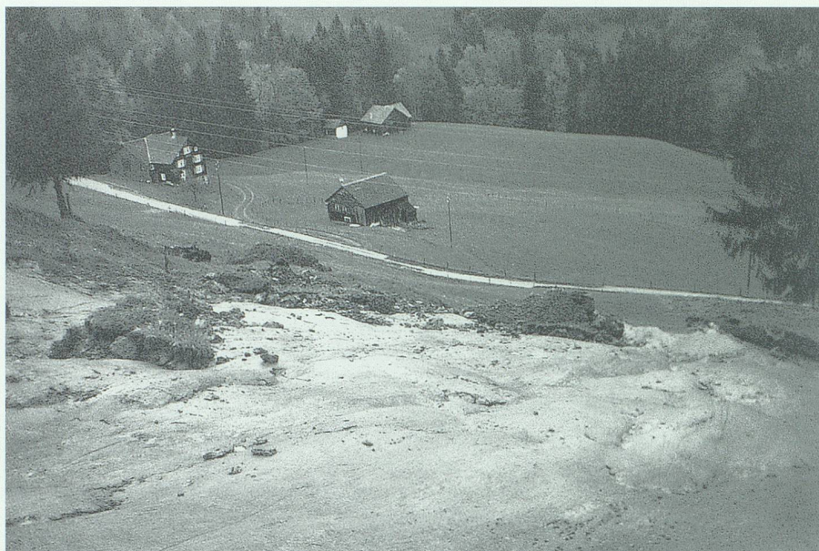
Erdbeben oberhalb der Schwendi am Hinteren Grabserberg am 10. Mai 1888.

106 Altendorf den 7ten Febr. 1862. L. Beusch.»