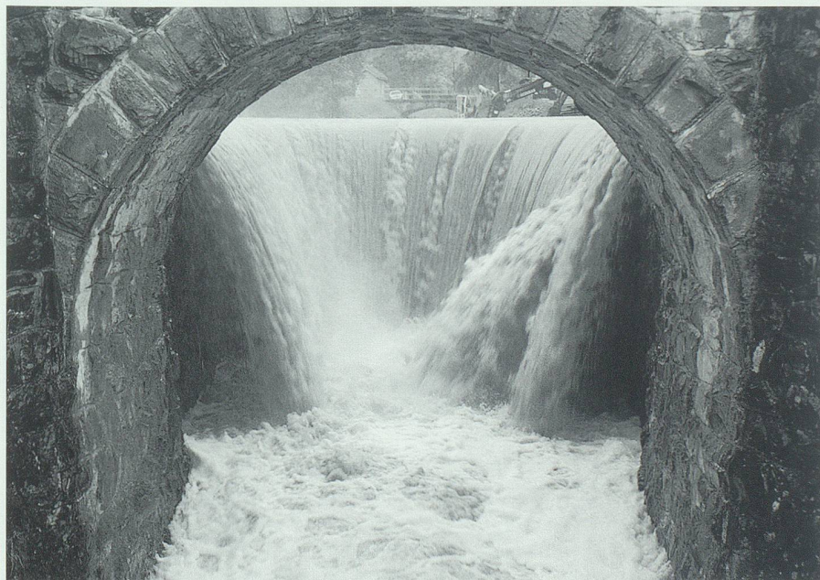
Hochwasser vom 15. Februar 1990: Auslauf des Kiesfangs im Grabserbach.