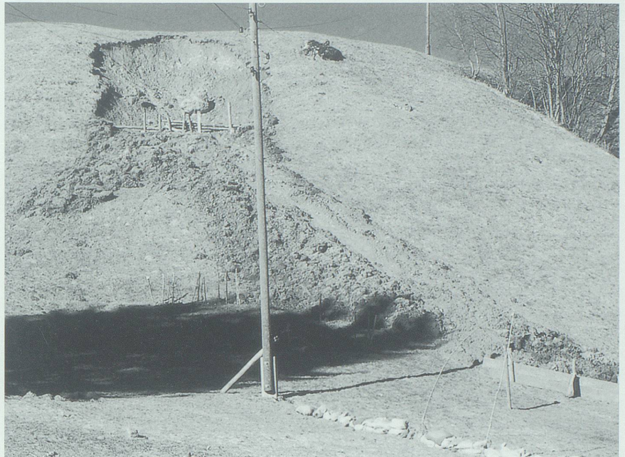
Schliff im Rogghalm am Grabserberg beim Unwetter vom 15. Februar 1990.

b) Beim jetzigen Zustande, wo kein Kies-sieb angebracht ist, wird so zu sagen alles Sand, Kies und Gestein in unsere Sandsämmler geleitet; durch die projektierte streitige Vorrichtung würden grössere Steine aufgehalten; auch Sand würde nicht mehr so viel in unsere Sämmler kommen,