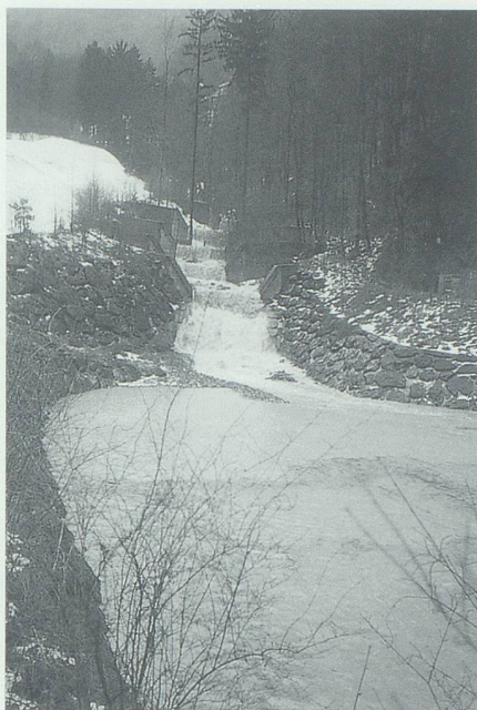
Verbauungen und Kiesfang im Studnerbach beim Obergatter (Grabs).

Art. 57: Jeder zieht eine jährliche Belohnung von nicht weniger als 3 Stöss Früh-