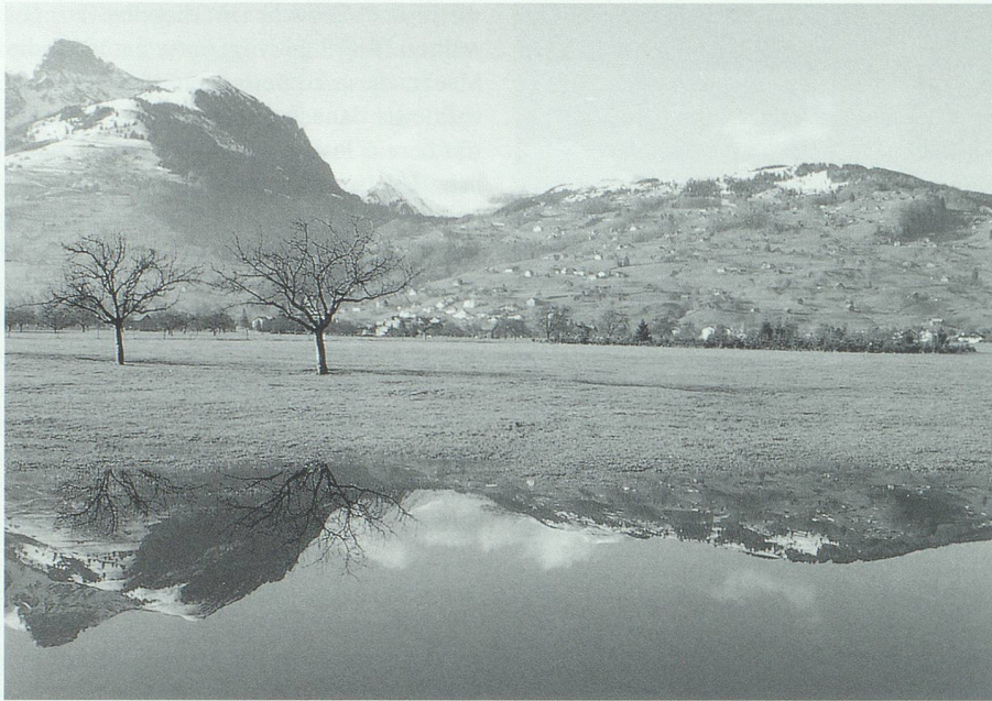
Seltene Spiegelung im Grabserriet: Nach einem Dauerregen von 1992.

Auf sothane geziemende Vorstellungen hin, habe ich nicht ermanglen wollen denselben geneigt zu willfahren, und habe in dieser Absicht mir obbemelte Verkommenschrift, die inhanden der anstossenden Rieth Besitzern gelegen, überbringen lassen, die aus dem Original wörtlichen copialiter hernach folget und also lautet: