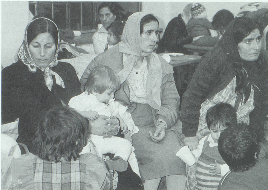
Das Verhalten der «ansässigen» Bevölkerung gegenüber den «Neuankömmlingen» ist entscheidend dafür, ob und wie diese heimisch werden können. Asylsuchende Kurdinnen im Jahr 1990.

der «ansässigen» Bevölkerung gegenüber den «Neuankömmlingen» ist, ob und wie diese heimisch werden können. Wenn die Schale allzu hart ist, kann das geschehen, was ganz gewiss nicht eine gesamtgesellschaftlich sinnvolle Absicht sein darf: dass sich die «Anklopfenden» schliesslich in ihr Schneckenhaus zurückziehen, in die Isolation einer selbst zurechtgezimmerter Scheinwelt, in welcher nicht selten die alte, verlorene Heimat idealisiert und damit der Zugang zur neuen Umgebung erst recht verbaut wird. Dies gilt auch für das Erlernen der Landessprache. Erlebt ein Ausländer oder eine Ausländerin die Sprache der neuen Umgebung primär im Zusammenhang mit Diskriminierungen, wird sie von Menschen gesprochen, die sie, die «Anderssprachigen», belächeln oder herabwürdigen, dann wird die Motivation, eine solche Sprache zu erlernen und zur eigenen Alltagssprache werden zu lassen, begreiflicherweise äusserst gering sein.