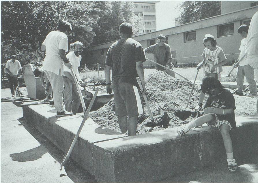
Interkulturelles Zusammenleben ganz praktisch: Ein Spielplatz entsteht, an dem sich alle freuen.

Grammatik gehen, sondern vorerst um so alltägliche und praktische Dinge wie das Einkaufen, Einholen wichtiger Informationen, Ausfüllen von Formularen und dergleichen. «Den Arbeitgebern», so ein weiterer Ausschnitt aus dem bereits zitierten Bericht «Interkulturelles Zusammenleben» des Kantons St.Gallen, «wird empfohlen, Firmenkurse für ihre fremdsprachigen Angestellten anzubieten. Schulgemeinden wird empfohlen, Deutschkurse für Eltern anzubieten. Das Angebot für Deutschkurse auf verschiedenen Stufen ist auszubauen.»