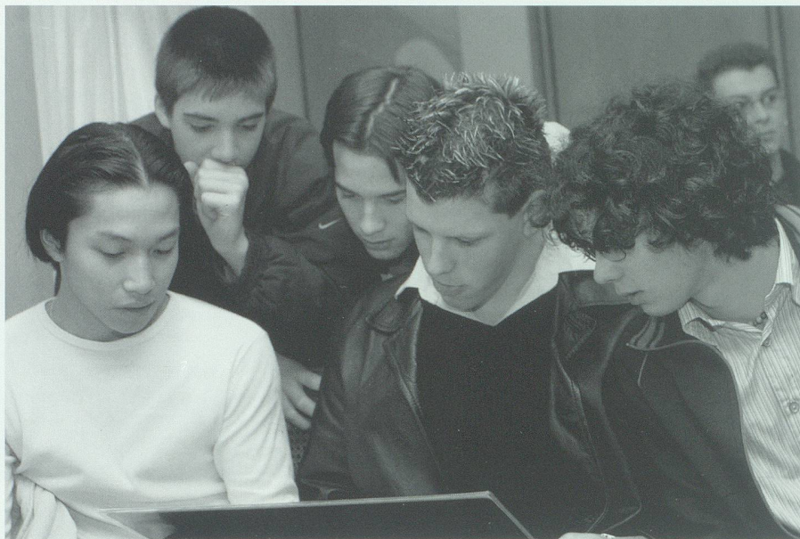
Die «multikulturelle» Gesellschaft ist auch in der Schweiz längst eine Tatsache.

116 Ja, wenn das so einfach wäre. Die Frau, die in einem südamerikanischen Land ge-