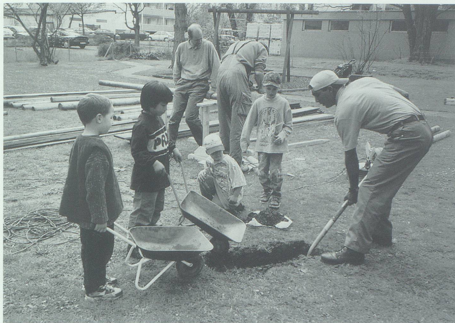
Eltern und Kinder in Aktion. Alle helfen mit, und Papi zeigt, wie es geht.

«Kommission für interkulturelles Zusammenleben». Das aus Vertretern und Vertreterinnen von Gemeinde- und Schulrat sowie verschiedenen Fachstellen zusammengesetzte Gremium soll Initiativen und Projekte zur Verbesserung der Integration anregen und begleiten sowie Lösungsansätze zu aktuellen Problemen aufzeigen.