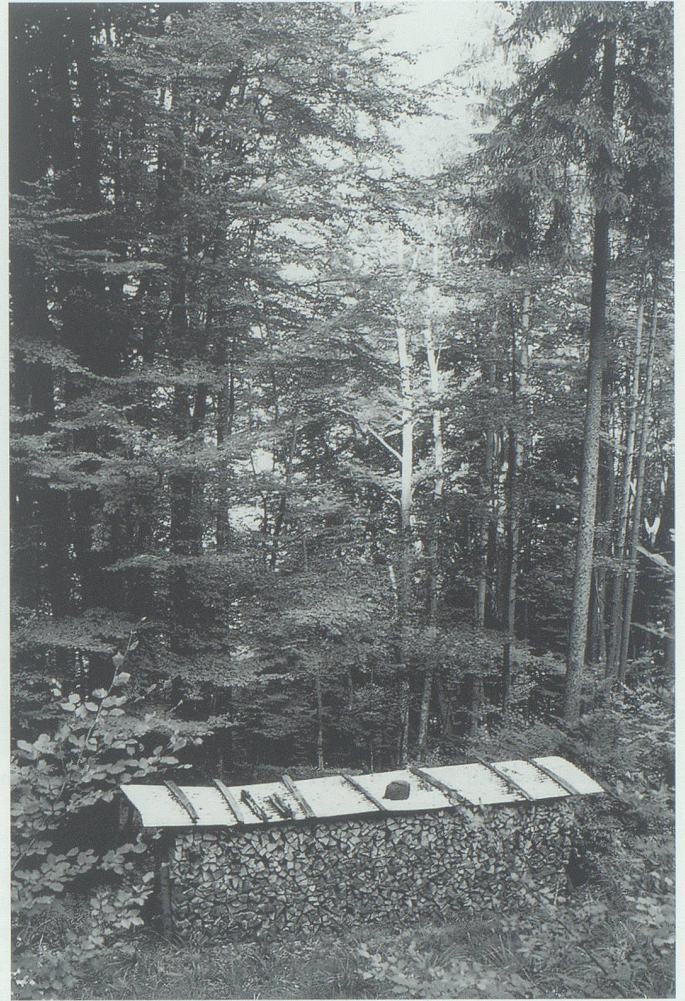
Brennholzbeige im Banholz hinter der Bunsenhalde.

Rahmenbedingung seine natürliche Verjüngungskraft behalten. Obwohl in die Trittsiegel von Schafen und Ziegen längst Rehe und Hirsche getreten sind, die auch vor dem Banholz nicht Halt machten, hat er doch noch genügend Vitalität und Samenkraft, sich selber zu verjüngen. Eine gut dosierte Verbesserung der Lichtverhältnisse mit gezielten Verjüngungshieben hat in den letzten Jahren diese Entwicklung erfreulich begünstigt.