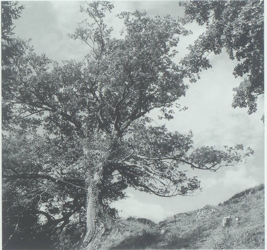
Alte Eiche im Malanserholz (Wartau). Bild: Markus Gabathuler, Buchs.

Als Dichter fragt Walser auch «Ist der Wald poetisch?», und er antwortet: «Ja, das ist er, aber nicht mehr als alles andere Lebendige auf der Welt. Besonders poetisch ist er nicht, er ist nur besonders schön! Von Dichtern wird er gern aufgesucht, weil es still ist darin und man wohl in seinem Schatten mit einem guten Gedicht fertig werden kann. Er ist viel in Gedichten, der Wald, deshalb glauben gewisse, sonst gänzlich poesielose Menschen, ihn als etwas besonders Poesievolles verehren und beachten zu müssen. Beachtet und notiert ihn euch immerhin! Der Wald bleibt deshalb ganz ebenso unbekümmert und frisch Wald. [...] Die Poeten, das ist sicher, lieben den Wald, die Maler auch, das ist ebenso sicher, und alle braven Menschen, beson-