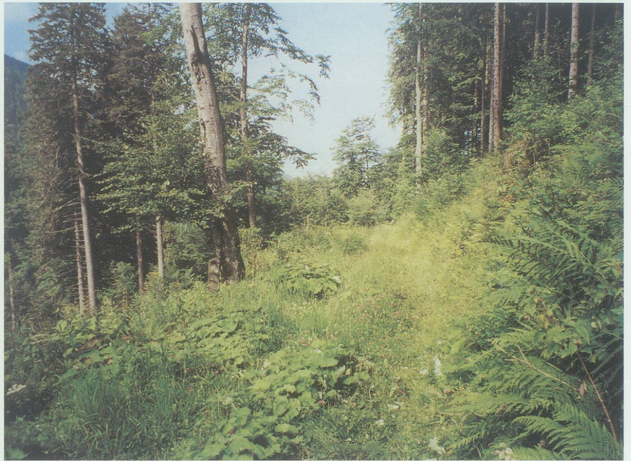
Nebeneinander von älterem Baumbestand und Naturverjüngung im Höland.

Ich komme recht gut voran und setze mich bald einmal auf die Kanzel in einer Waldlichtung, die durch die Nutzung der Bäume in den letzten Jahren entstanden ist. Erhaben liegen der Steilhang, die Geröllhalde, die Felsen, die alten Bäume, die Büsche vor mir. Es ist äusserst interessant, die Natur lange und eingehend zu betrachten. Rund fünfzig Meter vor mir, wo durch die Pflege der Jäger ein Stück Wiese in einer Bejagungsschneise liegt, ist das Gras an einer Stelle zusammengedrückt. Dort hat letzte Nacht ein Stück Wild gelegen, ein Lager, wie die Jäger es nennen. Am Waldrand steht eine Fichte mit einem geknickten Wipfel, den der Sturm in den vergangenen Tagen abgebrochen hat. Da fliegt plötzlich mit grossem Geschrei ein Eichelhäher über die Lichtung und setzt sich am Lichtungsrand auf einen Ast. Nicht viel später macht sich an einem absterbenden Baum ein Schwarzspecht zu schaffen. Nun ist es aber Zeit, den Cervelat, das Bürli und das kleine Bier aus dem Rucksack zu geniessen, für mich immer eine besondere Freude. – Doch was ist das? Ich höre das Geräusch von herunterfallenden Steinen: ein Zeichen, dass Gämsen in der Nähe sind. Und tatsächlich, schon wechseln eine Gamsgeiss und ein Gamskitz von links oben in die Lichtung. Bald ziehen noch mehr Gämsen nach, etwa zwölf Stück müssen es sein, ein ganzer Fasel, fünf Geissen, vier Kitze und drei Jährlinge. Heute ist ein guter Tag, denn schon oft habe ich den ganzen Abend gar nichts