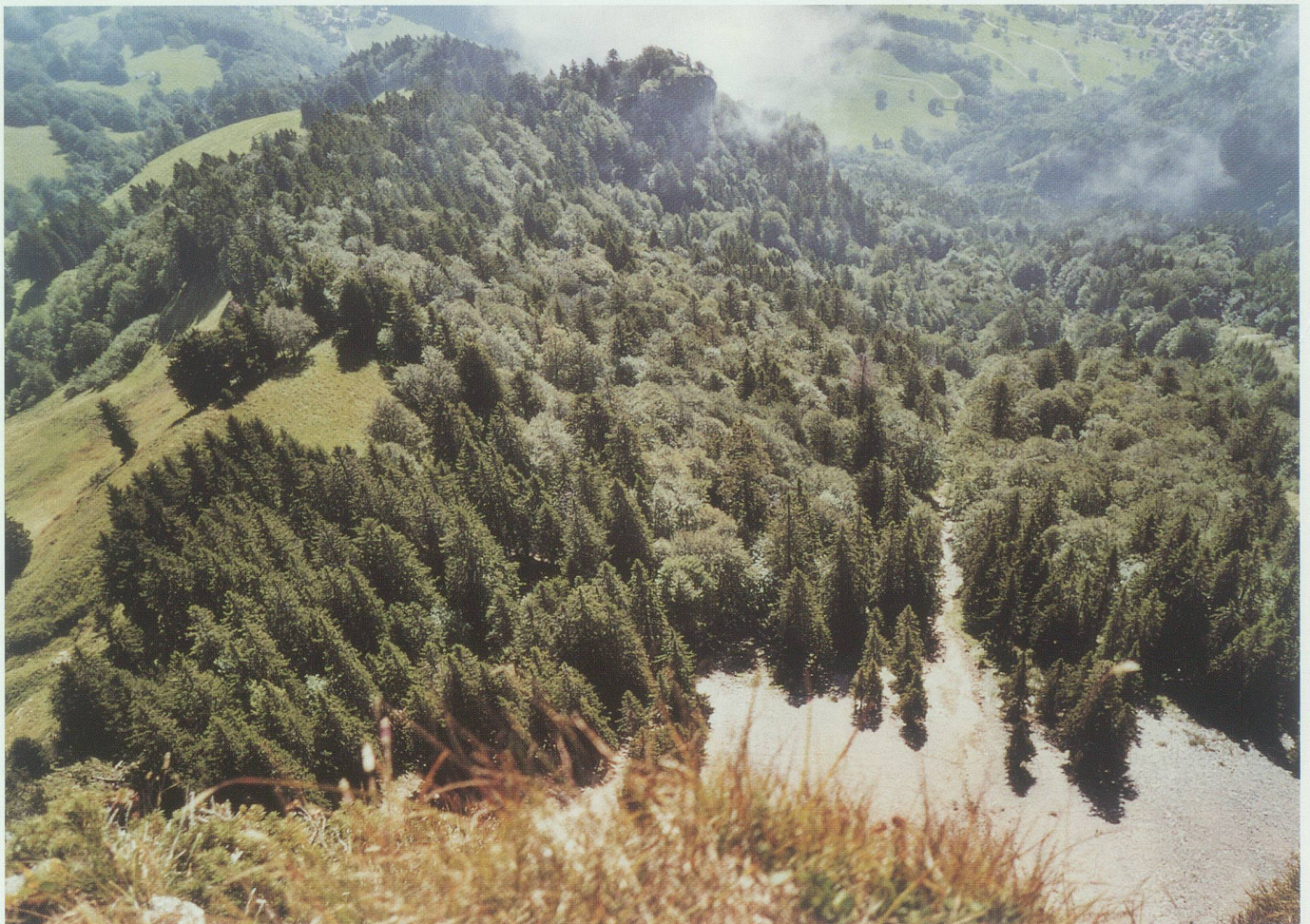
Blick vom Chüeststein auf den Plumperwald. Ganz am oberen Bildrand links Plona und rechts Lienz.

Die drohenden Gefahren sind erkannt worden, und 1984 wurde ein Gebirgswaldwiederherstellungsprojekt gestartet, in das der Plumperwald einbezogen