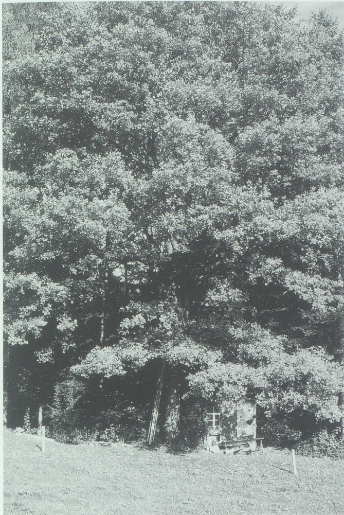
Bubenhütte unter einer Eiche am Waldrand auf Grist.