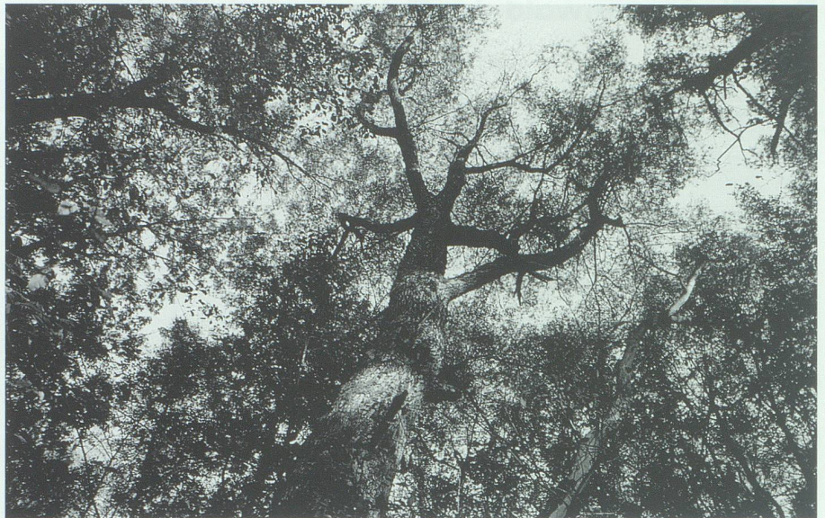
Im Waldreservat Ceres. Eine letzte Erinnerung an die einstigen Rheinauenwälder mit ihren mächtigen Felben und Albern.

• In der Oberschicht finden wir zur Hauptsache die Alber (Schwarzpappel)