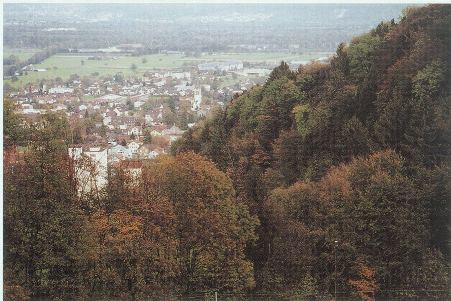
Blick vom Mülihäldeli – Teil des Banholzes – aufs Dorf.

Im Banholz ist dies anders. Dieser Wald hat dank der geschilderten günstigen