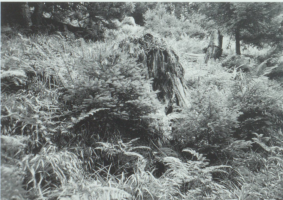
Im Schutz der alten Stöcke stellt sich Verjüngung ein. Hier, auf 1400 m ü. M., gehört die Fichte zu den Pionierarten.

Das zeigt sich darin, dass es vom Bundesamt für Forstwesen zusammen mit einer Gebirgswaldsanierung im Berner Oberland zum nationalen Pilotprojekt erklärt wurde.