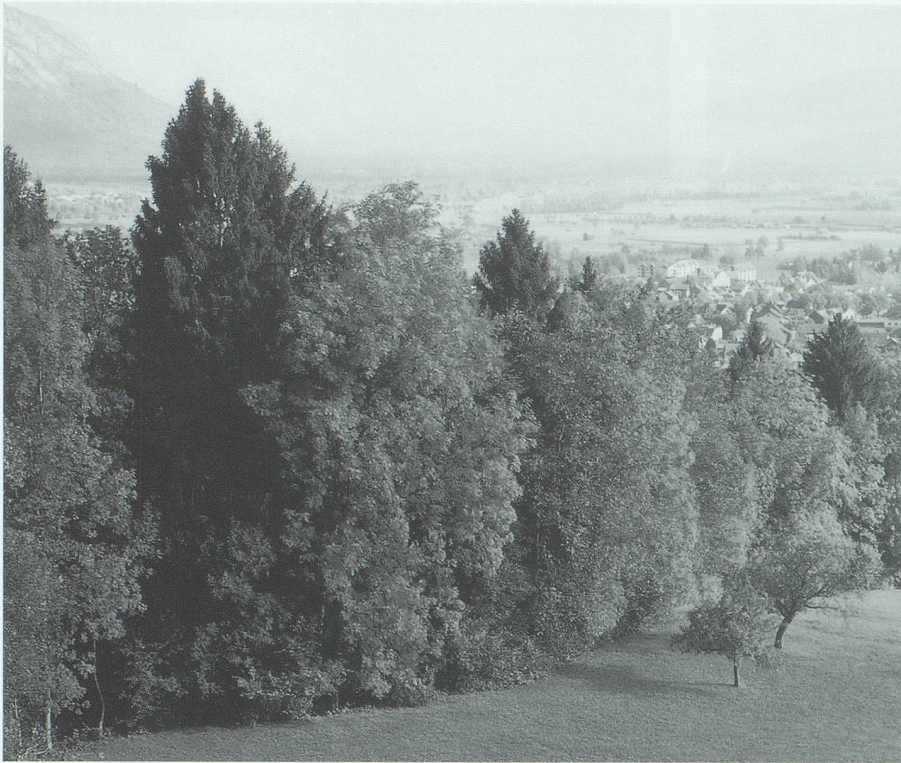
Der Waldrand auf Grist, an der Studnerbergseite des Banholzes.

der Natur: am Walchen- und am Schlussbach, am Wingert, im Ried und natürlich im Wald.