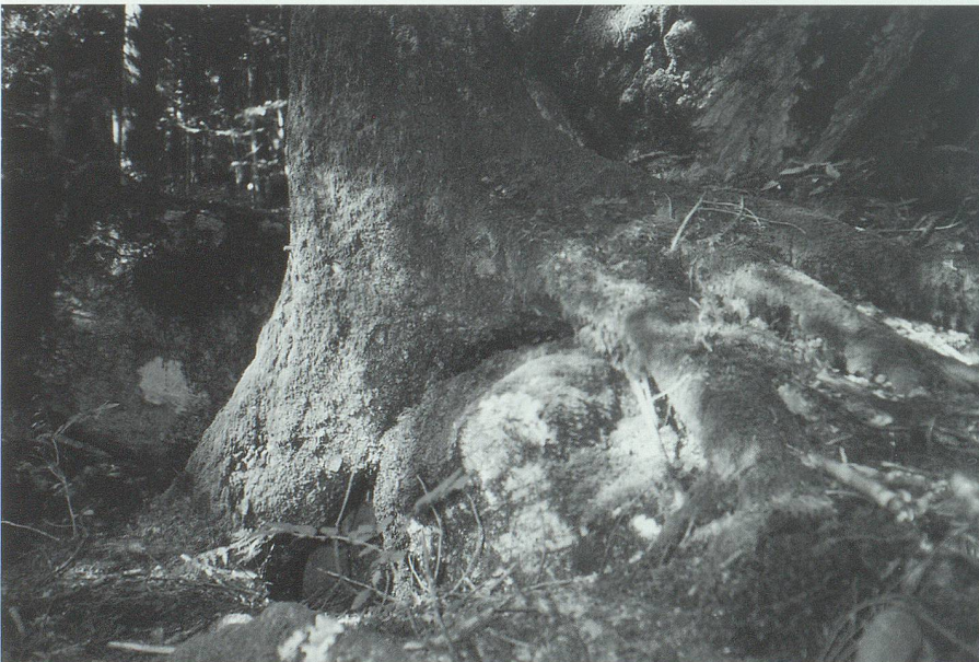
Stock und Stein: Die Wurzeln umklammern die Felsbrocken, als ob sie diese am Weiterrollen hindern wollten.

Das Bergsturzgebiet Gufera steht wohl in Zusammenhang mit einem Ereignis des 17. Jahrhunderts, das der Werdenberger Chronist Nikolaus Senn unter dem Titel «Bergfahl zu Sax» erwähnt: «Den 10. Juli 1678 ist ein grosser Theil des stotzachtigen Gebirgs oberhalb dem Dorf Sax Zürcher Gebieths, auf zween starke Steinwürf lang und breith, mit entsitzlichem Krachen, abgerissen und auf die Ebne gestürzt. Da unter anderm ein ungeheures Stuck Felsen mit grossem Gewalt in zwey zersprungen, und sich in die Tieffe gesetzt. Gleich wol sind von diesem geschwinden Bergfahl weder Menschen noch Viehe beschädiget worden: Und befindit sich an diesem Orth eine hohe felsichte Wand, da nichts lebendiges mehr weder hinauf noch hinabsteigen kann.» 2 H.J.R.