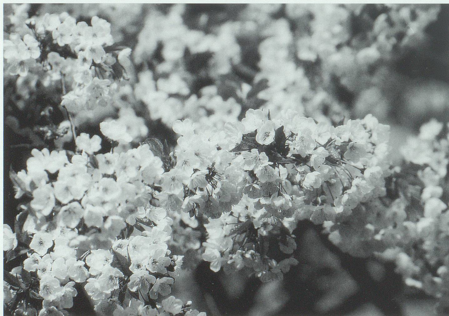
Nur kurz dauert die Blütezeit – dafür sind dann die im Frühsommer reifen Kirschen umso süsser.