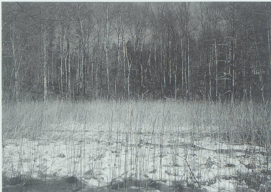
Namengebend für Sennwald: das bis heute charakteristisch gebliebene Nebeneinander und Ineinander von Wald und Sumpf.

ein paar kümmerlichen Resten Rheinauenwald – hat das geschafft. Und dieser Bann wirkt, wenn man so will, noch immer: Der Schlosswald und seine Umgebung, insgesamt um die 300 Hektaren, stehen heute unter Landschaftsschutz.