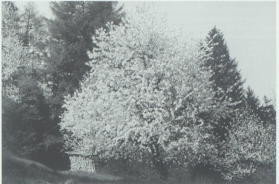
Die weiss blühenden Kirschbäume leuchten so hell, als ob es über Nacht geschneit hätte.

Im Moment ist der Steinbruch stillgelegt. Ein Gesuch um die Weiterführung liegt zurzeit in St.Gallen. Beim Stein, der im Übertagbau abgetragen wurde, handelt