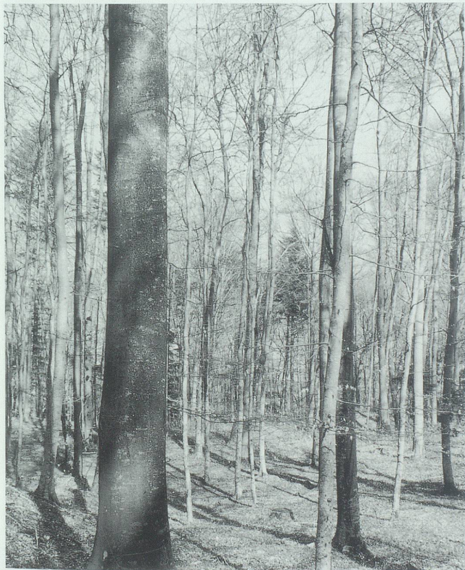
Hallenartiger Buchenwald vor dem Blattaustrieb im Frühjahr.

die Baumarten sind in diesem Gebiet aussergewöhnlich vielfältig. Das Gretschinscher Holz ist auch Lebensraum für unzählige Straucharten und Bodenpflanzen. Diese Vielfalt bietet wiederum der Tierwelt ideale Voraussetzungen. Unzählige Insekten, verschiedene Reptilien, eine reiche Vogelwelt, zahlreiche Kleinsäuger sowie Fuchs, Reh und Hirsch kommen hier vor.