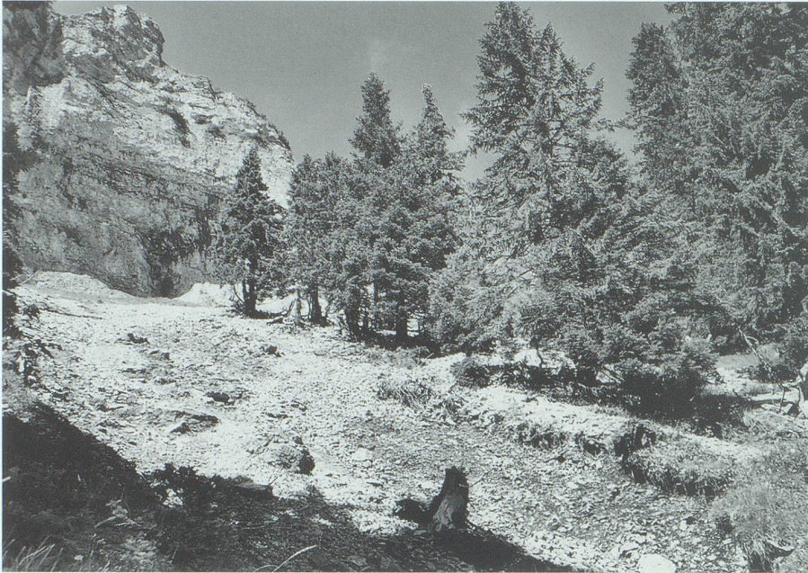
Am oberen Waldrand des Plumperwaldes: Steinschlag und Erosion schwächen hier den Bestand.

wurde. Das Projekt beinhaltete die Erstellung eines Maschinenweges, Pflegemassnahmen und Aufforstungen. An die budgetierten Kosten von 380 000 Franken hatte die ortsbürgerliche Rhode Lienz 42 000 Franken zu leisten. Dieses Projekt war und ist nicht nur für Lienz von Bedeutung, auch auf Bundesebene wurde ihm ein hoher Stellenwert beigemessen.