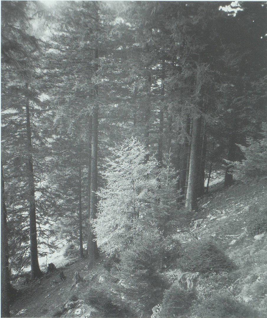
Die Verjüngung in den Bärenlöchern hat einen schweren Stand: Beweidung und Wildverbiss setzen den jungen Bäumen hart zu; ab einer Höhe von einem bis zwei Metern kommt es aber zu einem kräftigen Wachstumsschub.

zur Bewirtschaftung hat sich dadurch stark verkürzt. Es handelt sich jedoch nur um eine Groberschliessung. Das Holz muss an vielen Orten mit dem Seilkran an die Strasse gerückt werden.