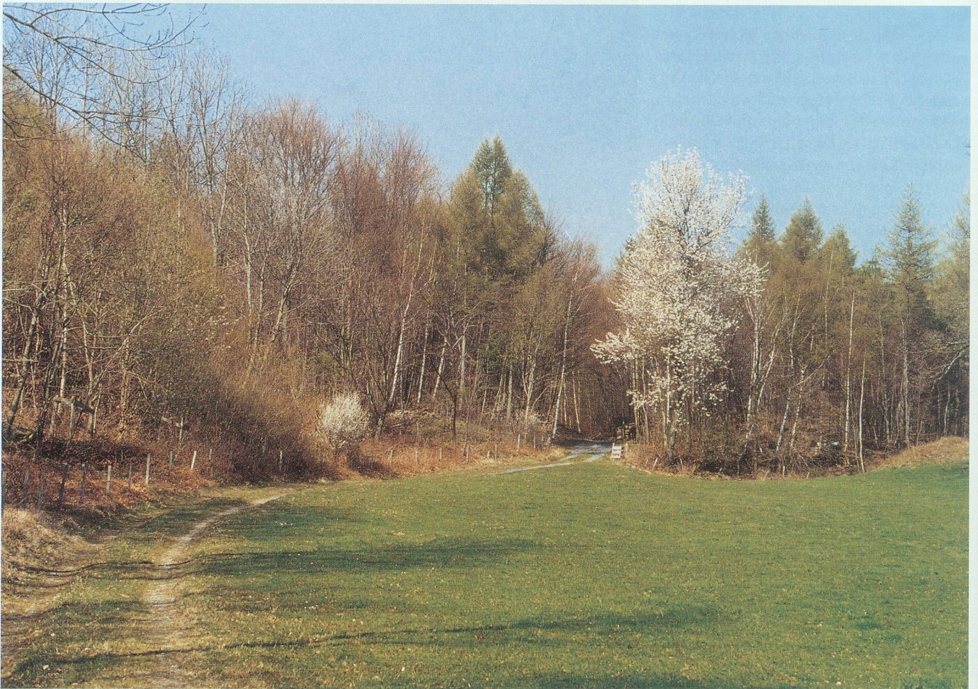
Frühlingserwachen am Waldrand im Gretschiner Holz zur Zeit der Kirschbaum- und Schwarzdornblüte.

Das milde Wartauer Klima begünstigt eine sehr grosse Artenvielfalt. Nebst vielen anderen Baumarten sind die Edelkastanie, der Speierling, der Kirschbaum, der Nussbaum, die Föhre und die Lärche im Gretschinerholz anzutreffen. Auf den höchsten Erhebungen finden wir einige Arten wie zum Beispiel die Felsenbirne, die sich nur auf diesen sonnigen, kargen Kalkfelsen behaupten können. Nicht nur