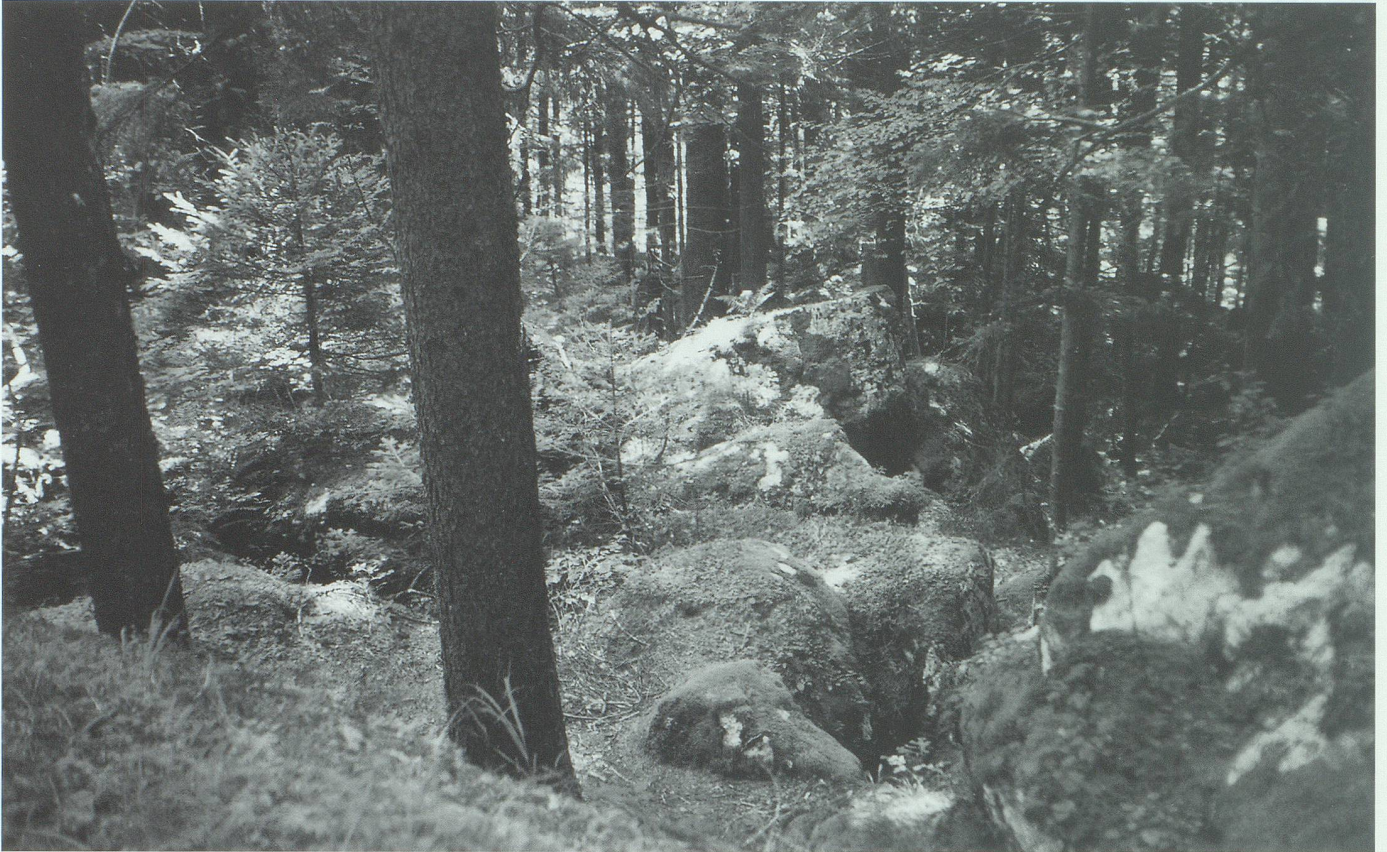
Im Guferawald, einem Ruhe- und Rückzugsgebiet für die Tierwelt.

Höhepunkt erreicht. Am Boden wechseln sich Licht und Schatten ab. Dort, wo genügend Licht auf den Boden gelangt, findet man vereinzelt auch junge Bäume,