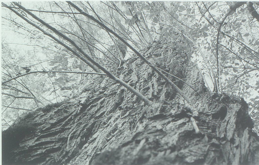
Urgestalt im Cereswald: eine alte Felbe, die in ihrer Jugend wohl noch den unkorrigierten Rhein gesehen hat und in einem richtigen Auwald gestanden ist.

serspiegel massiv gesunken – Hunderte von Kubikmetern Dürholz waren die Folge. Besonders betroffen waren alte Albern, Pappeln und Felben. Sie hatten ihren «Wurzelteppich» auf Höhe des Grundwasserhorizontes ausgebreitet. Beim raschen Absinken des Wasserspiegels vermochten vor allem ältere Bäume, die auch viel Wasser brauchen, ihr Wurzelwachstum nicht mehr zu aktivieren und mussten somit «verdursten».