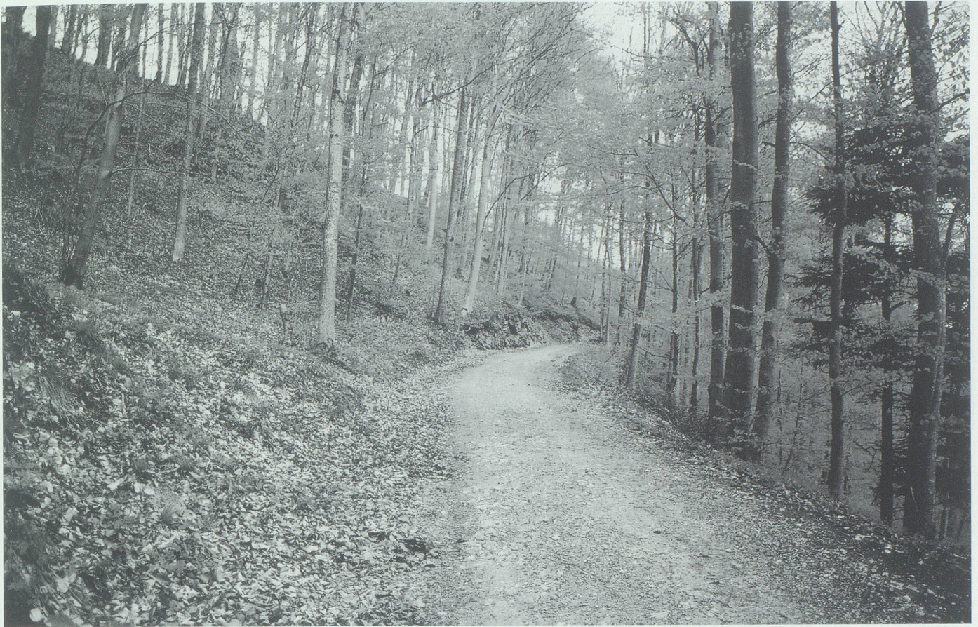
Frühling im Laubwald: Hier sind Nutz- und Wohlfahrtsfunktion optimal vereint.