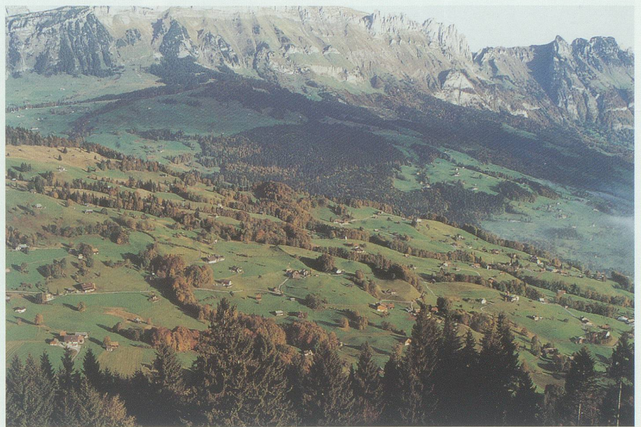
Durch Bachgehölze reich strukturiert: der Grabserberg.

Die meist in schmalen Streifen stehenden Waldpartien überraschen mit einem hohen Potential für die Holzproduktion. Die guten Lichtverhältnisse, verbunden mit ausreichender Wasserversorgung des Bodens, und die mittleren Höhenlagen von 600 bis 800 m ü. M. bieten ideale Be-