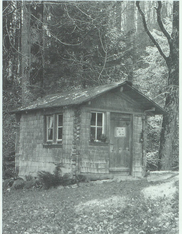
Waldhütten unterschiedlicher Anspruchskategorien: Zeugen der Beliebtheit der Wälder als Tummelplatz unserer Jugend.

ben an Haus und Stall. Aus diesem Grund wurden da und dort Fichten angepflanzt, deren Holz hauptsächlich Verwendung in der Konstruktion und im Innenausbau findet. An älteren Häusern lässt sich zeigen, dass für Wände und Dachstuhl über die Aussenfassaden, Böden, Wandtäfer bis hin zu den Türen und Schränken Fichten- und Tannenholz von normaler, heute als grobstig bezeichneter Qualität verwendet wurde. Der Trend der letzten zwanzig, dreissig Jahre zu «feinerer» Holzqualität schliesst diese schnell gewachsenen, astreichen Nadelbäume von der einheimischen Holzverarbeitung praktisch aus. Dieses Holz wird nicht einmal mehr für den Bau von Ställen oder Remisen verwendet. Harzgallen und grobe Äste sind verpönt – das Holz der einst von unseren Vorfahren gepflanzten Fichten muss wegen der heutigen Ansprüche nach Italien exportiert werden! Dagegen finden die Laubholzstämmen je nach gerade herrschendem Modetrend im Innenausbau erfreulich guten Absatz. Aufgrund der Vielfalt an Baumarten und der teilweise hervorragenden Qualitäten