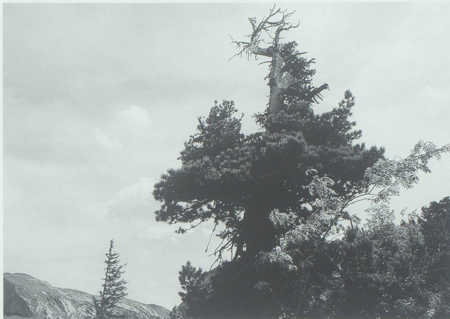
Von Sturm und Schnee zerzaust: Arve am Gulmen.

Ein mächtiger Baum steht an einem Waldhang, ihr Stamm scheint sich ins Endlose zu verlieren, der Wipfel muss sich irgendwo zwischen Himmel und Erde befinden. Es ist die Schibentanne im Gamserwald. Beim imposanten Baum handelt es sich um eine Weissstanne, zirka 60 Meter hoch, mit einem Volumen von