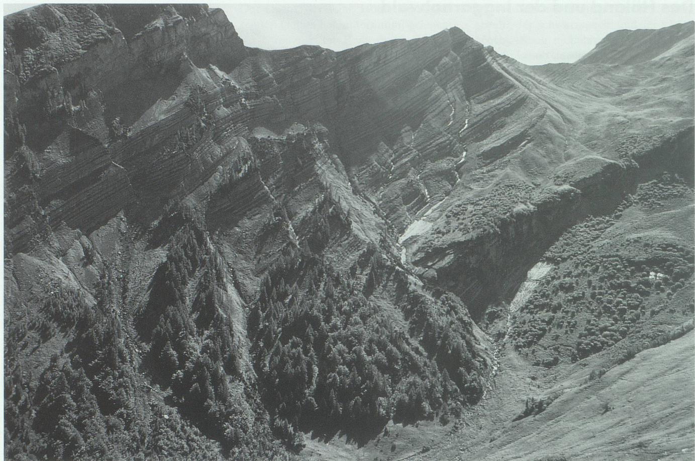
Blick über den Talkessel von Imalschüel gegen den Chopf (rechts von der Bildmitte), die Felswände des Hurst (Rote Platten) und die hinteren Bereiche des steilen Inggarnolwaldes (links).

bis zu 200 Prozent in den steilsten Hangabschnitten. Das Gebiet ist gegen Nordwesten exponiert, dem Föhn abgewandt, ziemlich feucht, ein Gewitterkessel. Im Frühling liegt der Schnee in den Mulden im unteren Teil sehr lange. Die topographischen Kleinstandorte sind vielfältig und wechseln rasch ab. Wir finden zahlreiche Pflanzengesellschaften: Steinrosen-Bergföhrenwald, Buntreitgras-Tannen-Buchenwald mit Rostseggen, Buntreitgras-Fichtenwald, Hochstauden-Tannen-Buchenwald mit Bärlauch, den Typischen Karbonat-Tannen-Buchenwald sowie den Typischen Hochstauden-Fichtenwald.