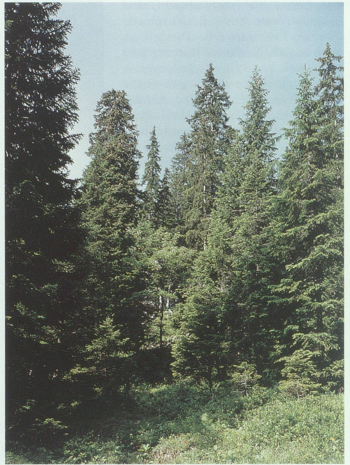
Buntreitgras-Fichtenwald beim Rossboden, einer schmalen Weide in der Alp Gamperfin (Grabs).

waldes auf der Ablagerung von Bergsturzmaterial in Hinterelabria oder auf Karren am Grabserberg. An Schattenhängen ist dieser Standort auch in der Stufe der Tannen-Fichtenwälder zu finden – zum Beispiel am Buchserberg –, weil die Felsblöcke Kälte speichern. Die Bodenvegetation ist ähnlich wie im Alpenlattich-Fichtenwald mit Heidelbeere, aber das Kleinrelief ist wegen der Felsblöcke oder Karren sehr stark ausgeprägt. Die Fichten werden höchstens 30 Meter hoch; beigemischt sind Vogelbeere und teilweise Bergahorn. Der Standort ist nicht sehr produktiv, teilweise sind aber Fichten mit guter Qualität (feine, regelmäßige Jahrringe) vorhanden. Die Holzernte ist erschwert, und das Holz kann nur bei Schnee auf dem Boden gezogen werden. Vor allem in den unteren Lagen ist dieser Wald ein günstiger Lebensraum für Auerhühner.