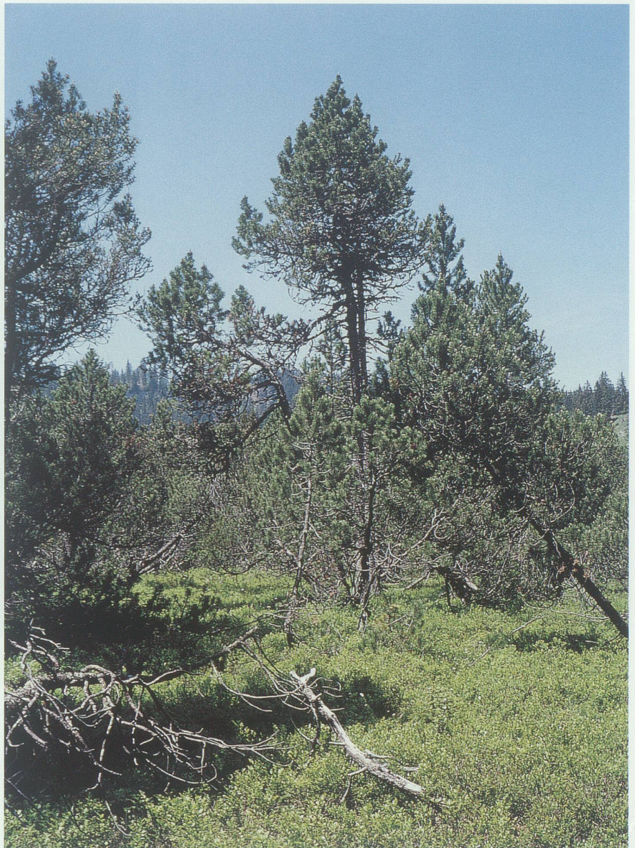
Torfmoos-Bergföhrenwald beim Hochmoor Gamperfin am Grabserberg.

In dieser Stufe – sie liegt oberhalb von etwa 1600 m ü. M. – spielt die fehlende Wärme eine grosse Rolle. Die Tanne kommt in der Regel nicht vor, da sie zu wenig frostresistent ist. Die Fichte dominiert meistens. Es sind aber nicht mehr alle Kleinstandorte verjüngungsgünstig. Vor allem in Mulden hat die Fichte wegen langer Schneebedeckung und wegen Schneepilzen kaum Chancen, sich zu verjüngen. Die Waldstruktur ist deshalb relativ offen, viele Bäume oder Baumgruppen (Rotten) haben Kronen bis gegen