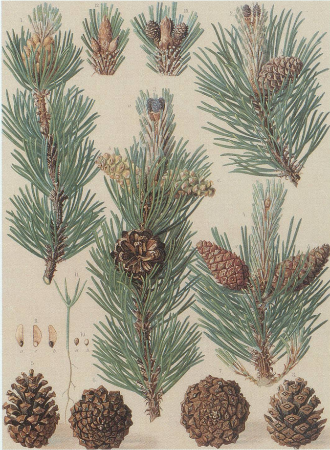
Zweige, Blüten und Zapfen der Bergföhre. Farbtafel im Archiv des Kreisforstamtes Werdenberg.