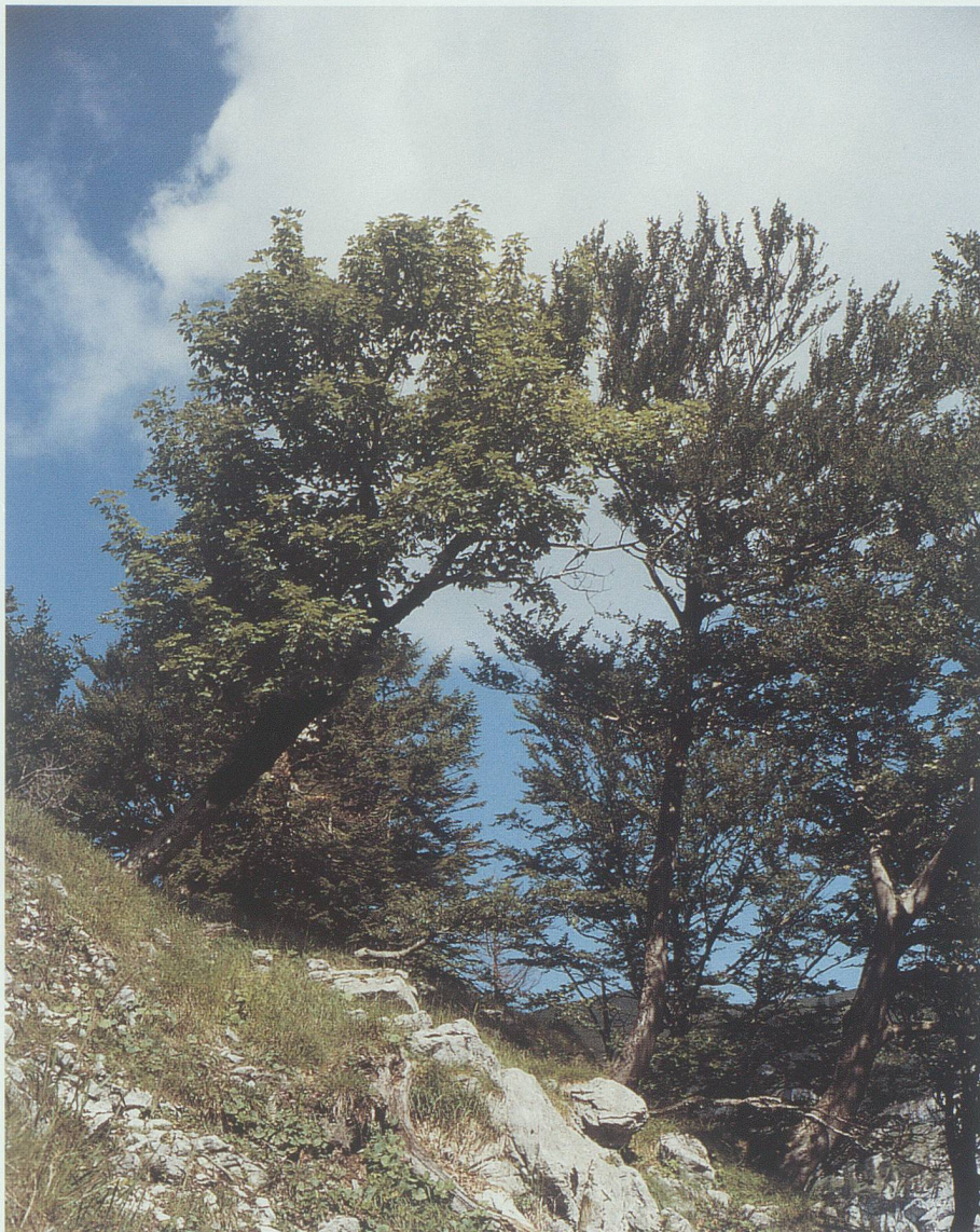
Karbonat-Tannen-Buchenwald mit Weisssegge auf dem Lienzerspitz (Gemeinde Altstätten).

Auf kalkreichen Kreten an den Hängen unterhalb des Stauberenfirns und des Kamors gedeiht der Karbonat-Tannen-Buchenwald mit Weisssegge. Zusätzlich zu den Kalkzeigern wie Bingelkraut, Kahler Alpendost oder Dreiblattbaldrian sind auch Pflanzen vorhanden, die Kalk und Trockenheit anzeigen, darunter Bergsegge ( Carex montana ), Weisssegge oder Blaugras ( Sesleria caerulea ). Weiter unten sind auf ähnlichen Standor-