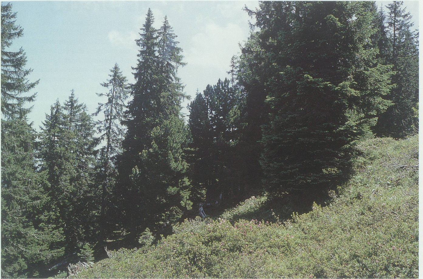
Nordalpen-Arvenwald im Übergang zum Buntreitgras-Fichtenwald beim Scheitenplatz (Grabs) mit Fichten, Arven und Tannen.

gen Bäume werden oft durch das Schneegleiten verformt oder ausgerissen. Sie können deshalb am besten auf Kleinstandorten aufwachsen, die durch Steine, Bäume oder Holz geschützt sind, so dass der Schnee lokal nicht abgleitet. Der Standort ist nicht produktiv und wird wegen der unzugänglichen Lage meistens nicht genutzt. Der Wald ist oft ein guter Steinschlagschutz. Er ist auch besonders beliebt als Wintereinstand für Schalenwild, da in grossen Teilen der Lücken der Schnee den Boden nur kurz bedeckt, weil er abgleitet, sobald die Sonne darauf scheint. Oft sind der Dreizehenspecht oder die Kreuzotter anzutreffen.