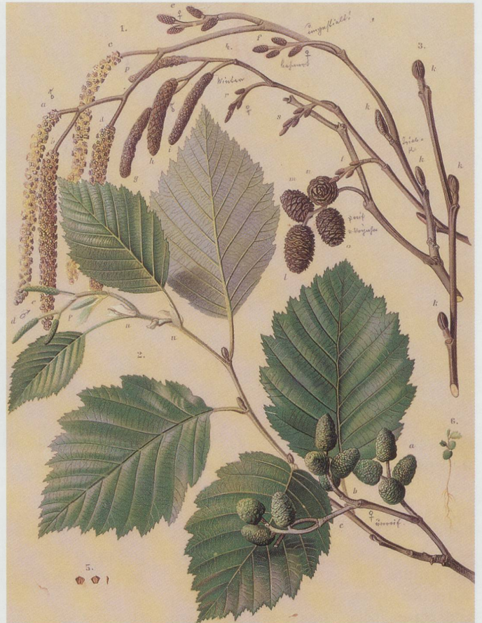
Zwei Arten der Rheinauen, die – wie die Felbe – unter der Grundwasserabsenkung besonders zu leiden haben: die Alber oder Schwarzpappel (links) und die Grau- oder Weisserle (rechts). Farbtafeln im Archiv des Kreisforstamtes Werdenberg, aus einer mit «Amtlich, Oberforstamt des Kts. St.Gallen» abgestempelten Serie, die offenbar um etwa 1950/60 für Ausbildungszwecke verwendet wurde.

kant verändert. Weichholzaunen mit Weiden, Erlen und Pappeln (Alber) entwickeln sich zu Hartholzaunen mit Esche, Ulme und Ahorn.