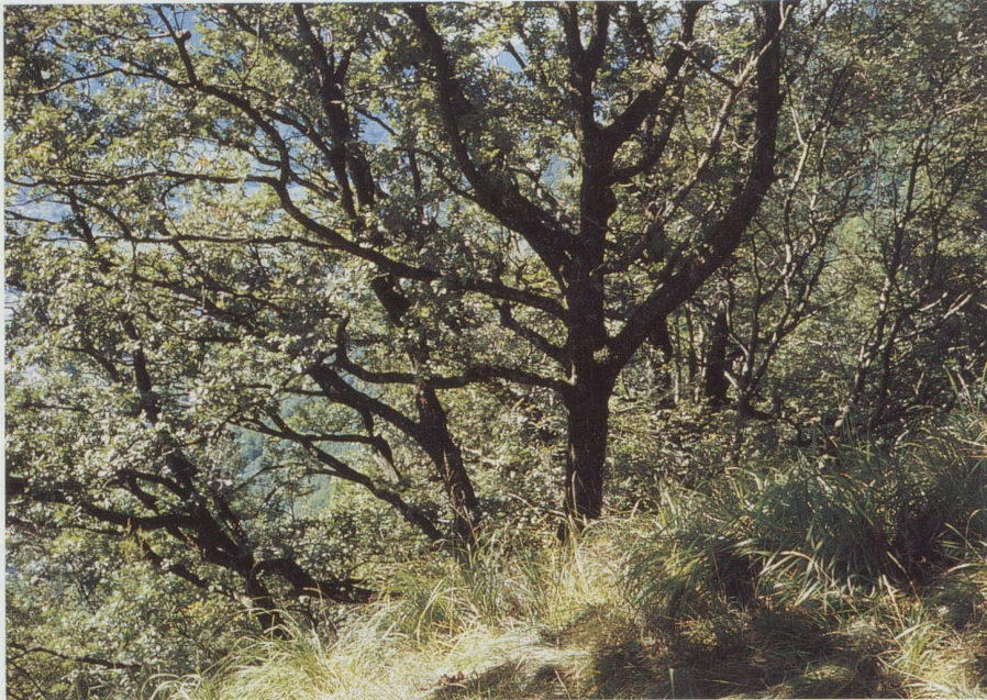
Gamander-Traubeneichenwald am Schollberg (Wartau).

bäche bildet der Wald zusammen mit der dichten Krautschicht einen guten Erosionsschutz.