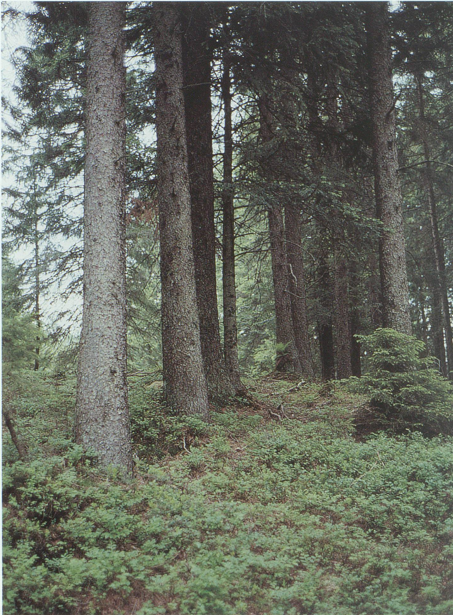
Typischer Heidelbeer-Fichtenwald am Grabserberg.

Konkurrenz zu bilden vermag. Die Fichte hingegen benötigt mindestens so viel Licht wie die Krautschicht, sie verjüngt sich deshalb auf Spezialstandorten wie Moderholz oder Mineralerde, wie sie sich beispielsweise auf Windwurfflächen finden.