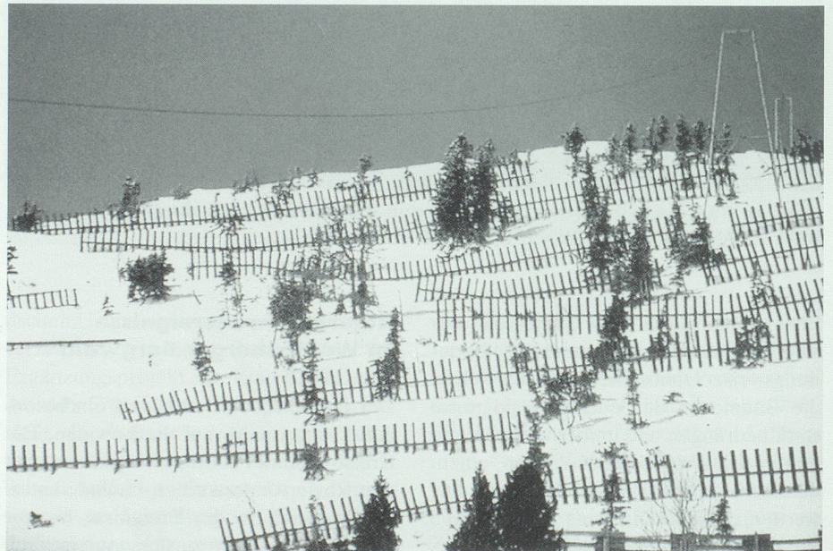
Lawinnenverbauung am Gonzen (Aufnahme Winter 1984).

sung abgeschätzt. Dort, wo die ermittelten Wirkungsräume der potentiellen Gefahrenprozesse wichtige Schadenpoten-