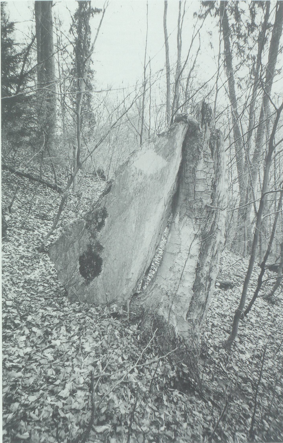
Wälder sind ein wirksamer Schutz gegen Steinschlag, wie dieses Bild aus dem Geissbergtobel (Sevelen) eindrücklich zeigt.

firstes anzutreffen. Das Projektziel besteht darin, die Gleitschneerutsche beziehungsweise Gleitschneelawinen, welche die Bäume an der oberen Waldgrenze stark bedrängen und immer wieder Wunden in die Waldbestände reissen, einzudämmen. Auf diese Weise soll verhindert werden, dass plötzlich eine Ausgangslage für grössere Lawinen entsteht.