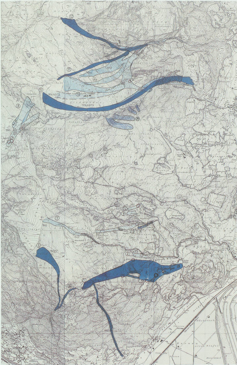
Lawinenkarte des Forstreviers Wartau. Unten die Sturzbahn der Gonzenlawine, die 1945 bei Matug ein Todesopfer forderte. Oben die Lawinenzüge im Gebiet der Schaner Alp, die bis hinunter nach Gapätsch oberhalb von Oberschan reichen.