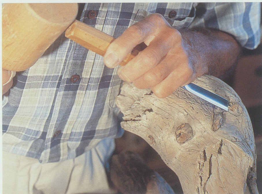
Eugen Henauer entfernt die Rinde und das lose Holz: Es braucht Fingerspitzengefühl (oben). Das Gesicht beginnt sich zu zeigen: Sachte entfernt der Holzwerker kleine Reste von überflüssigem Holz (unten).