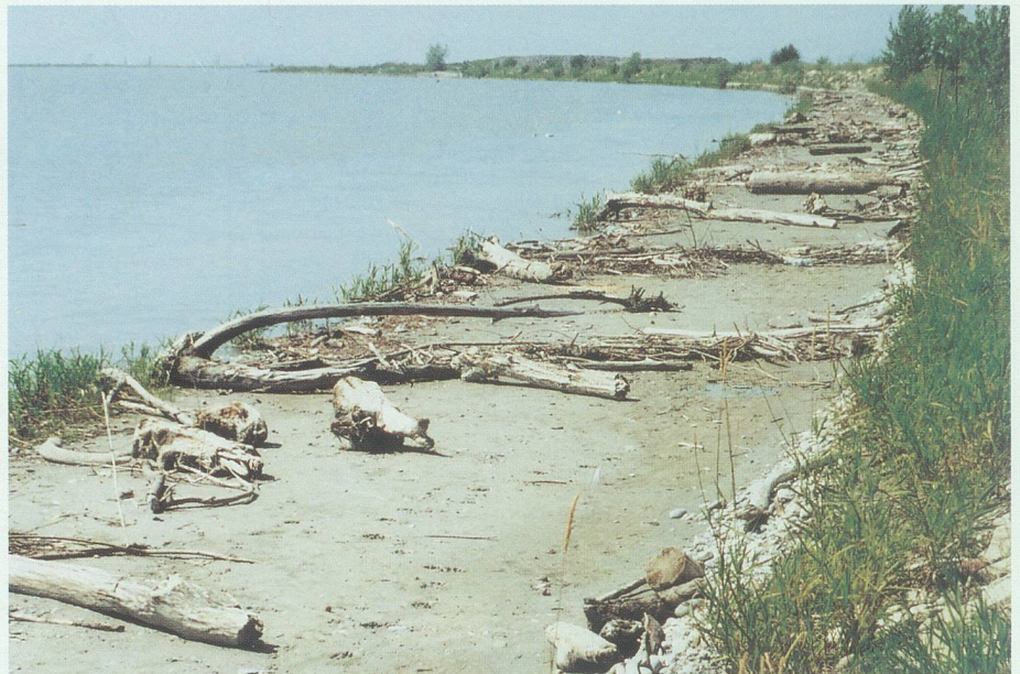
Viel Schwemmholz an der Rheinmündung am Bodensee: eine der Fundstellen für Eugen Henauers Figuren aus Holz.

Was heute schon mit einer gewissen Perfektion geschieht, aber bis heute immer wieder mit einer Prise Abenteuer und Nervenkitzel verbunden sei, begann im Jahr 1972 an und in der Urnäsch: Die