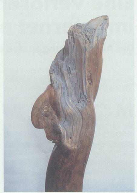
Ein Tannenstück aus dem Rhein: «Grosse Nase».

kommt auch die künstlerische Arbeit zum Tragen», meint Henauer, dieser Prozess sei nicht ganz einfach. Sicher aber ist, dass er am gleichen Stück bis zur endgültigen Figur durcharbeitet.