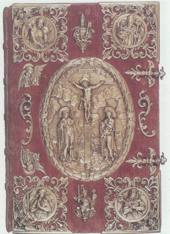
Bild links: Prunkinitialen aus dem Liber Aureus aus dem späten 11. Jahrhundert (Folium 9r.). Bild rechts: Der Pracht-einband des Liber Aureus. Hervorragende Arbeit der Goldschmiedekunst; sie gehört zu den bedeutendsten in der Schweiz erhaltenen Goldschmiedearbeiten der Spätrenaissance.

das erste Werk von geistesgeschichtlicher Bedeutung aus dem Sarganserland – ein äusserst vielgestaltiges Dokument, das trotzdem als beeindruckende Einheit, als Gesamtkunstwerk, bezeichnet werden kann. Es ist «für das Verständnis des Frühmittelalters von höchstem geschichtlichem Interesse». 11