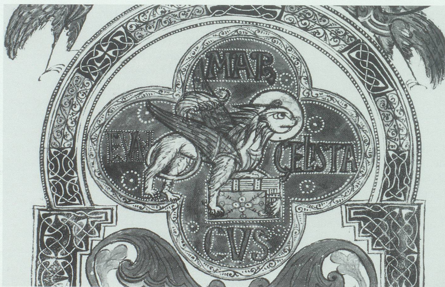
Aus dem Liber Viventium (Faksimiledruck): Löwe, Symbol des Evangelisten Markus.

An erster Stelle steht der um 800 angelegte Liber Viventium , das Buch der Lebenden. Diese Handschrift bezeugt die weite kulturelle Ausstrahlung der Abtei und des Skriptoriums der Abtei Pfäfers in karolingischer Zeit. Die Handschrift diente zunächst liturgischen Zwecken. In ihrer reichen künstlerischen Ausstattung gehört sie zu den bedeutendsten und wohl auch interessantesten noch erhaltenen Erzeugnissen karolingischer Buchmalerei. Die bildlichen Darstellungen wirken unmittelbarer und sind besser erhalten als manche restaurierte Zeugnisse aus jener Zeit. Inhaltlich und formal ist das Buch –