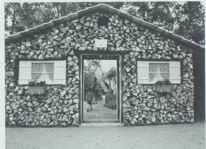
Auf dem Rundgang am Werdenbergersee boten sich verschiedene Durchblickssituationen (Unter- und Mittelstufe Räfis; Leitung Daniel Walser).