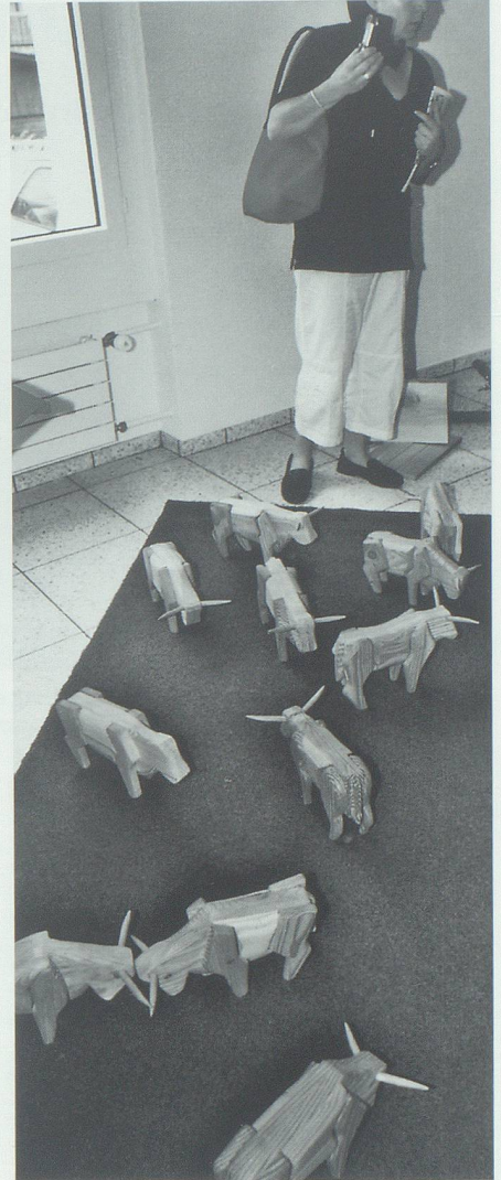
Figuren aus einheimischem Holz als Abstraktion einer Naturform (Realschule Buchs; Leitung This Schwendener).

Der grosse Einsatz der Werdenberger Lehrerschaft hat sich in jeglicher Hinsicht gelohnt, wenn auch die Vorarbeiten für die nur eintägige Veranstaltung enorm aufwändig waren. Die offenen Türen unserer Schulen und die herzliche Aufnahme der unzähligen Gäste aus der gesamten Bodenseeregion vermochten dem Motto der Veranstalter – «Tore öffnen» – in jeder Beziehung gerecht zu werden. Gästen und Eltern bot die Imta verschiedenste Einblicke in die breite Palette musischer Ausdrucksmöglichkeiten. Zudem ist es gelungen, in den beteiligten Schülerinnen und Schülern den Sinn für