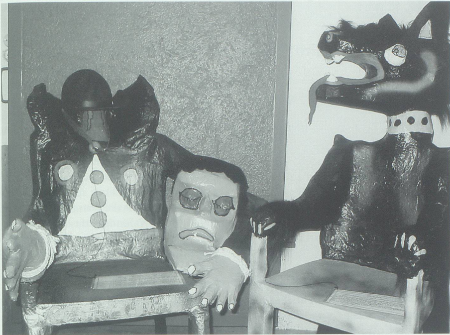
Werdenberger Sagengestalten, auf ausgediente Stühle appliziert (Mittelstufe Flös, Buchs).