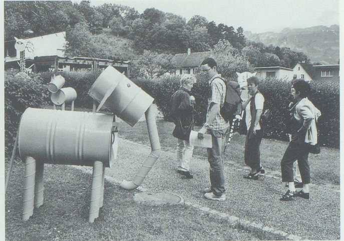
Fässertiere aus Röhren und alten Ölfässern (Realschule Buchs; Leitung Kurt Meyer).