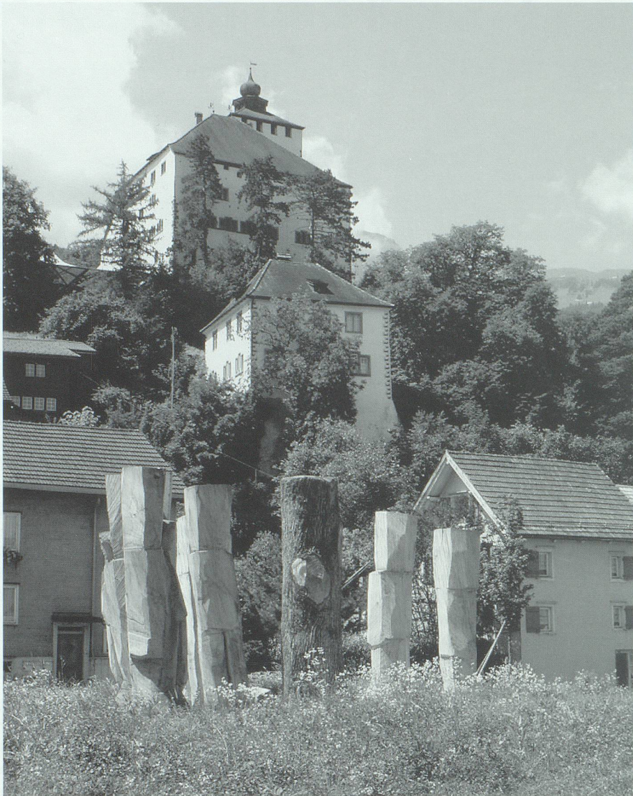
Das Schloss und das mittelalterliche Städtchen, in dem viele Holzstämme verbaut sind, erhalten mit der Figurengruppe Besuch aus den Wäldern.

entscheidend für Verständnis und Ablehnung der Figuren von Stefan Gort.