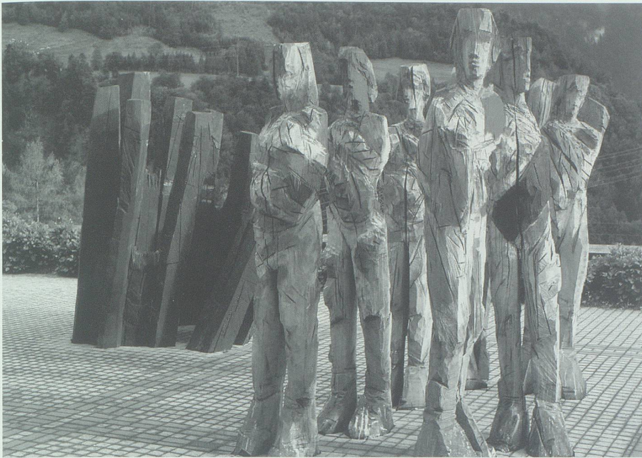
Auf der Terrasse der Klinik Valens lösen sich Heilung Suchende aus dem undifferenzierten Hingestelltsein.

Form einer einfachen Schnitzerei an Holzstämmen, welche die Szenen eher andeuten als ausformen. Aus dem traditionellen Motiv des Kreuzwegs in katholischen Kirchen nimmt er einige Themen auf. Schrift und sparsame, zeichenhafte Attribute bezeichnen die Station und bringen den Betrachter in eine Situation, in der er sich selber vorfinden kann. Ei-