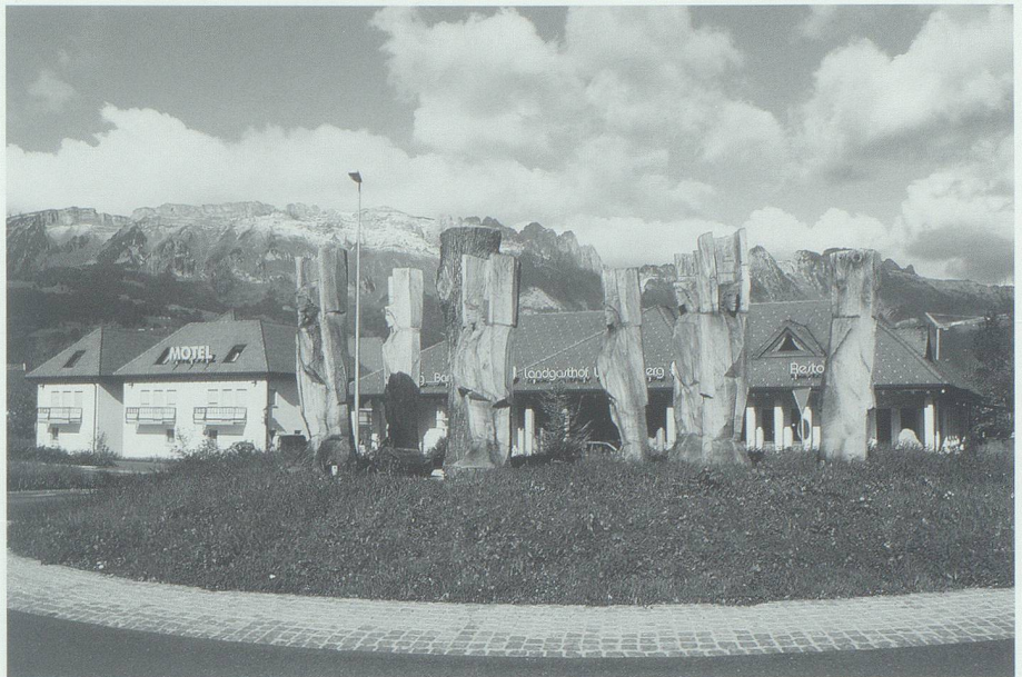
Wie auf einer grünen Insel haben diese urtümlichen Waldboten auf dem Kreisel Werdenberg Aufstellung genommen.

Die Fichten der dichten Wälder leben sie vor: Als ob nichts ihren Drang nach oben hindern könnte, dem sich alles unterordnet, auch die notwendigen Äste bilden keine Krone mit einem Eigenleben in die Breite wie beim Laubbaum oder auch bei der Föhre. In respektvollem Abstand be-