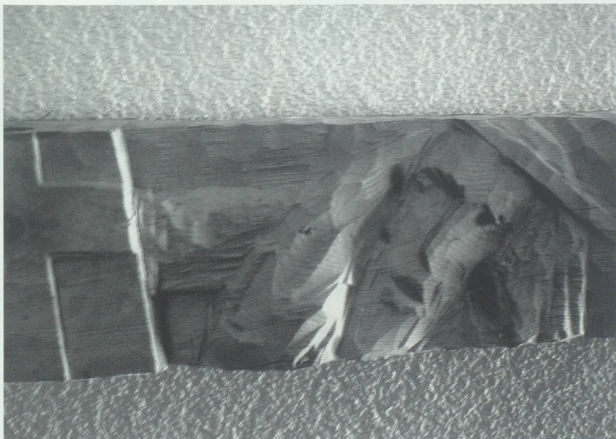
Simon von Kyrene, der Mann, der das Kreuz trägt, auf dem Kreuzweg in Wattwil.

noch an diesem Werk weiterarbeiten», und sagt wenig später: «Was mir auch wichtig war: dass das Thema nicht zu schwer wird, dass nicht eine Riesentrauer in den Figuren zum Vorschein kommt.» 12 Welch ein Abstand sowohl zu den naturalistischen Kreuzen des Elends als auch zu den triumphalistischen Auferstehungsbildern früherer Zeiten.