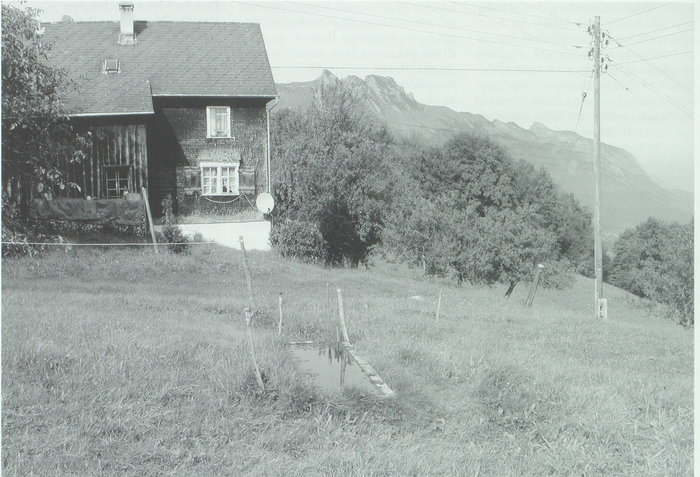
Der Hofbrunnen, heute beinahe eingewachsen, liegt nahe vor dem Hofhaus. Hinten rechts der Hohe Kasten.