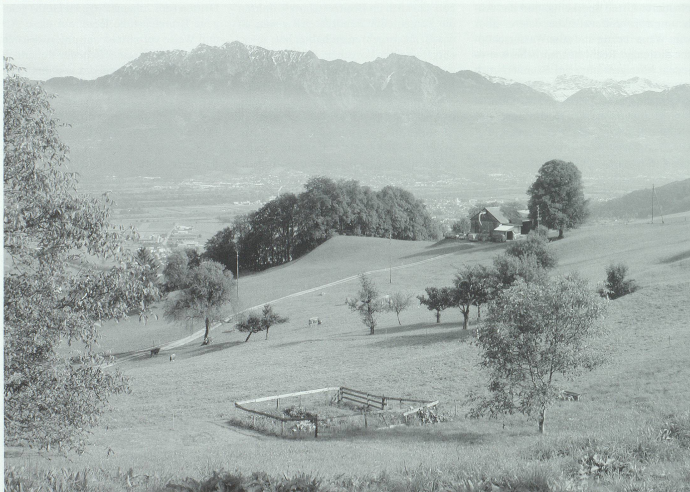
Der weite Ausblick von Tanners Haus am Lehn über das Höfli (rechts «s Salis») hinweg ins Tal hinab. Hinten die Drei Schwestern.

Im vorliegenden Falle kommt hierzu noch der Umstand, dass eine direkte materielle Schmälerung des Mitbesitzes durch grössere Wasserentnahme, bewirkt vom Rekursbeklagten, allermindestens soweit glaubhaft gemacht ist, dass jedenfalls einstweilen der Besitzstand der Rekurrenten auch aus diesem Grunde zu schützen wäre, zumal das Besitzeschutzverfahren gerade den Zweck hat, dort wo Selbsthilfe nicht angewendet werden kann oder will, die bestehenden Verhältnisse bis auf Weiteres, d. h. bis zu einem allenfalls provozierenden Richterspruche aufrecht zu erhalten (vgl. Amtsbericht 1907 pag. 289/91, ferner die hier ebenfalls einschlagenden Erwägungen betr. Erwerb