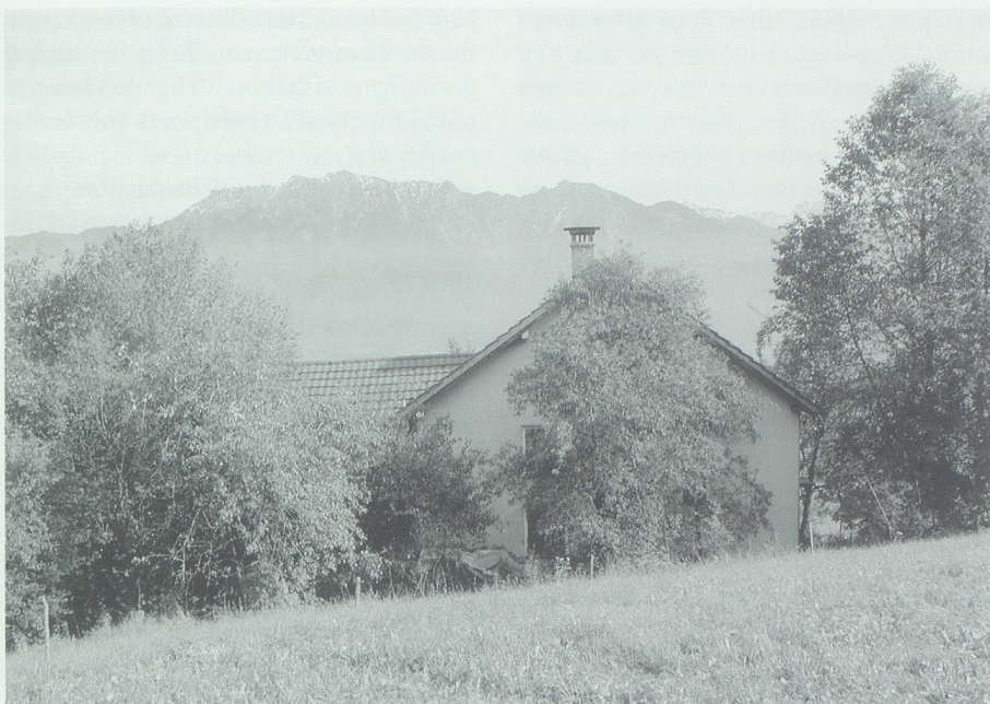
Blick vom Standort des Hofbrunnens hinunter zu Tinner's Haus.

gerten des Beweisführers in auf- & absteigender Linie, seine Brüder & Schwestern, Schwäger und Schwägerinnen, Gegenschwäger & Gegenschwägerinnen.