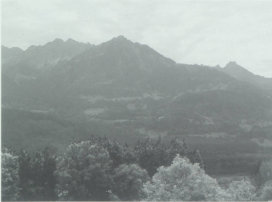
Auch die ausgedehnten Waldungen im Walgau – hier bei Röns – lagen im Visier von Holzhändler Rohrer.

den Vordergrund. Eichene Eisenbahnschwellen fanden für das wachsende Bahnstreckennetz guten Absatz. Das Eichenholz trotz in seiner Unverwüstlichkeit bekanntlich jeder Witterung und bewährte sich als Geleiseunterlage auf dem Schotterkies bestens. Dort, wo in den Forsten Vorarlbergs in früheren Zeiten Schweineherden die Eichenwälder zur Mast durchwühlten hatten, liessen sich nun die Buchser Holzherren die mächtigsten Bäume anzeichnen und reservieren.