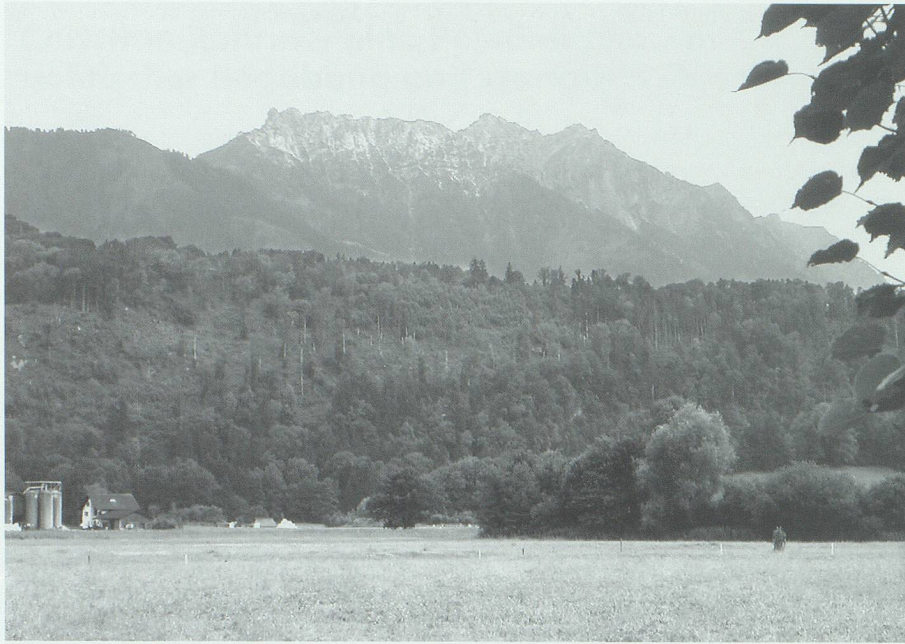
Der Schellenberg (Eschnerberg) und der Waldgürtel um die Drei Schwestern – Lieferanten für «das grüne Gold» des Christian Rohrer.

kam damit auch ein Schweizer Lieferant zum Zug. Im Jahr 1867 waren aber immer noch lange nicht alle Häuser unter Dach, denn am 20. Juni wurden vom Zwischenlager Buchs wieder rund 1000 Dachlatten nach Glarus gebracht.