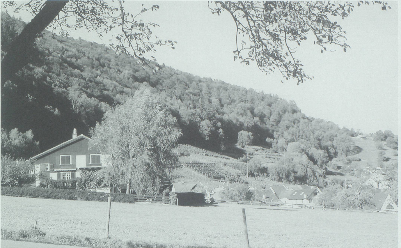
«Grünes Gold» für Christian Rohrer stammte auch aus dem Azmooser Eichwald oberhalb der Rebberge des Dorfes.