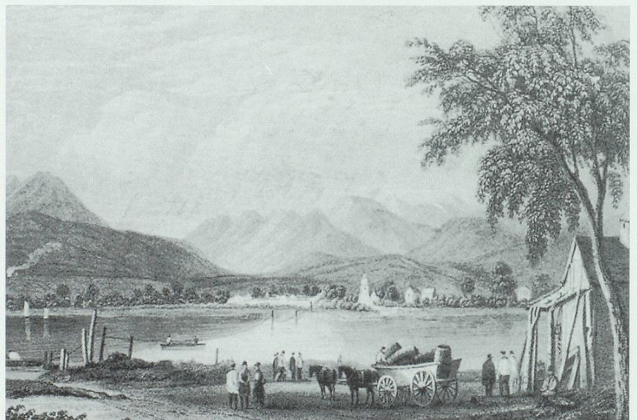
Die Oberrieter Fähre Blatten-Meiningen mit dem abgestützten Fährseil wurde oft für Rohrers Holztransporte benützt. Aus Gabathuler 1992.

Nachdem der Bedarf an Bauholz für Glarus einigermaßen befriedigt war, trat mehr und mehr der Handel mit Eichen in