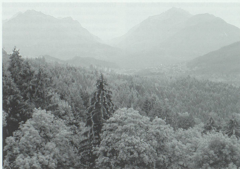
Fichten- und Weisstannenwald mit eingestreuten Föhrenbeständen oberhalb Rankweil: Blick von Batschuns über Göfis zum Saminatal.