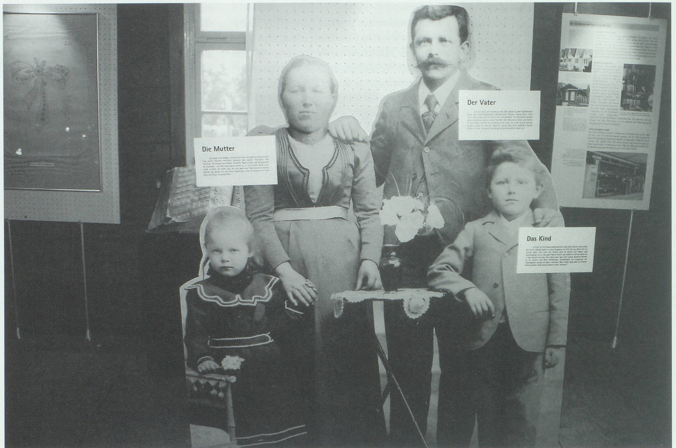
Eine Werdenberger Stickerfamilie begrüsst die Besucherinnen und Besucher des Regionalmuseums Schlangenhaus.

vetik sowie im jungen Kanton St.Gallen dargestellt.