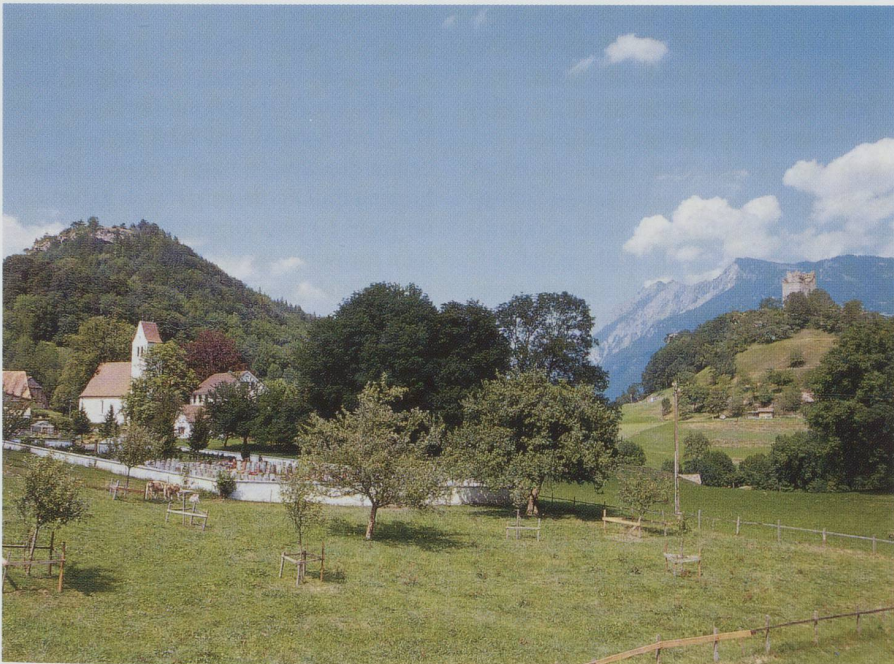
Die Burg Wartau (rechts hinten) und das Kirchdorf Gretschins bildeten den Kern der Herrschaft Wartau. Die Burg war nie Sitz eines Glarner Landvogts.

und 14. Jahrhundert sind nicht mit Sicherheit festzustellen, bis die Herrschaft 1399 an die Grafen von Werdenberg-Heiligenberg fiel. Im 15. Jahrhundert ging sie als Pfand- oder Erbbesitz an die Grafen von Toggenburg (1414), die Grafen von Thierstein (1429) und an die Schenken von Limpurg (1451). 1470 vereinigte sie Graf Wilhelm von Montfort-Tettnang mit seiner Grafschaft Werdenberg, mit deren Schicksal – ab 1517 als Glarner Landvogtei – die Herrschaft Wartau bis zum Untergang der Alten Eidgenossenschaft verbunden blieb. 3