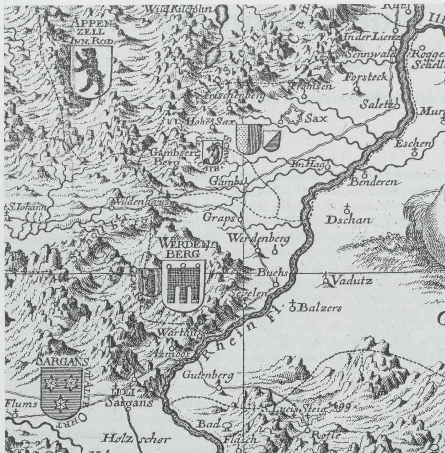
Auf der «Nova Helvetiae Tabula Geographica» (Johann Jakob Scheuchzer, 1712) sind die unterschiedlichen Herrschaftsverhältnisse mit den entsprechenden Wappen angedeutet: Neben dem Wappen der Freiherrschaft Sax-Forstegg steht das Zürcher Wappen, neben jenem der Grafschaft Werdenberg der Glarner Fridolin; das Wappen von Gams trägt die Umschrift «Glar[us].Cath[olisch].Schw[yz]» und das Wappen des Sarganserlandes «VII Alte Ohrt». Kein Wappen beigefügt ist der kleinen, ebenfalls glarnerischen Herrschaft Wartau, die mit dem übrigen, zu Sargans gehörenden Wartau stark verflochten war.

Wie im schweizerischen Mittelland war es auch im Alpenrheintal keinem der einheimischen Adelsgeschlechter gelungen, einen umfassenderen Territorialstaat zu bilden. Ein letzter Ansatz dazu waren die Bestrebungen der Grafen von Toggenburg, die versuchten, ihre Landeshoheit im Gebiet der heutigen Ostschweiz auszubauen, und die auch grosse Teile des ehemals montfortischen Herrschaftsbereichs beidseits des Rheins unter ihren Einfluss hatten bringen können. Schon bevor der mächtigste und zugleich letzte Toggenburger Graf, Friedrich VII., 1436 starb, hatten auch die Habsburger im Gebiet Fuss gefasst. Nebst ihnen erhoben nun ebenfalls die expandierenden eidgenössischen Orte Schwyz und Zürich Anspruch auf das Toggenburger Erbe.