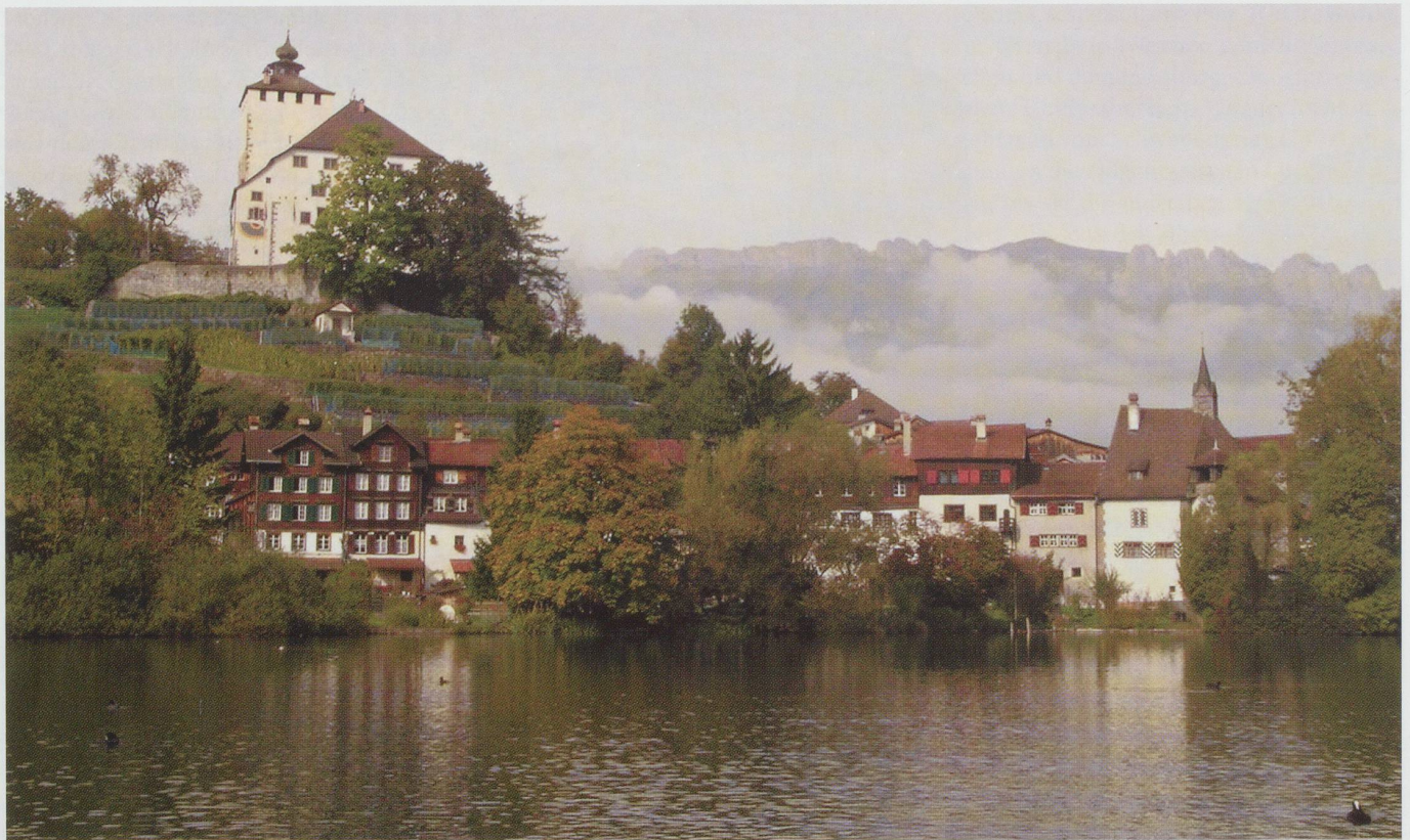
Schloss Werdenberg, von 1517 bis 1798 Sitz der Glarner Landvögte. Aufnahme 2004.