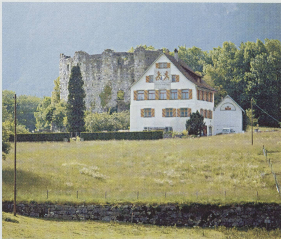
Schloss Forstegg, von 1615 bis 1798 Sitz der zürcherischen Landvögte.