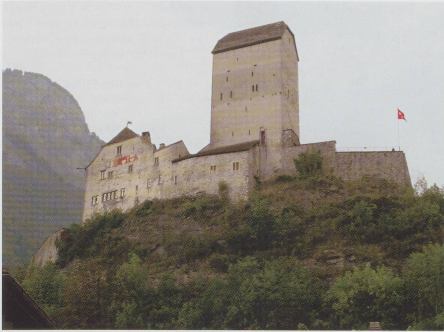
Schloss Sargans, von 1483 bis 1798 Sitz der eidgenössischen Landvögte.

zung – und das Kollaturrecht, das heisst das Recht zur Einsetzung des Pfarrherrn der Kirche Gretschins, der Pfarrkirche für wiederum alle Wartauer. Die Kollatur bezog sich somit auch auf die Wartauer Untertanen der Grafschaft beziehungsweise Gemeinen Herrschaft Sargans. Zu den Herrschaftsgütern gehörten die Burg, das