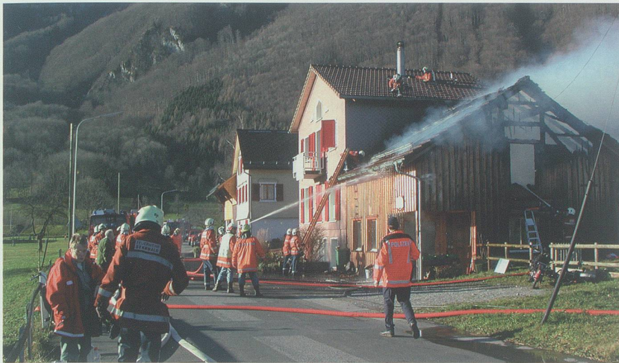
Die Alarmierung über Telefon 118, ein Alarmstufenplan, dem auch die Samariter angeschlossen sind, und eine gut organisierte Nachbarschaftshilfe stellen sicher, dass für jeden Ernstfall die erforderlichen Kräfte und Mittel möglichst rasch zum Einsatz gebracht werden können. Brandfall vom 1. Dezember 2002 in Frumsen.

Feuerwehr stehen und die ebenfalls Familie oder Beruf in den Hintergrund stellen, um anderen Hilfeleistungen zu erbringen.