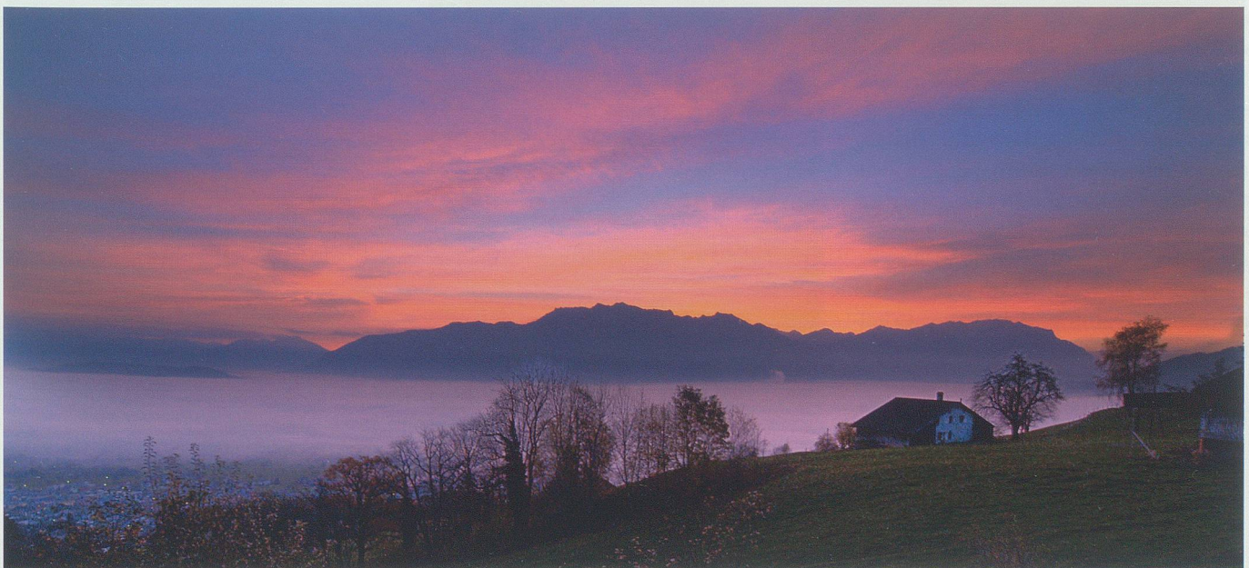
Morgen am Berg.

Da freut es ihn natürlich, dass er an der Berufsmittelschule des Berufs- und Weiterbildungszentrums Buchs Foto-