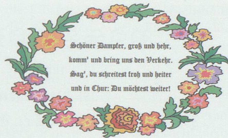
Begrüssungsvers in Sevelen für den Dampfzug anlässlich der Eröffnung der Eisenbahnlinie. Nachbildung Hans Hiller, mit Originalwortlaut