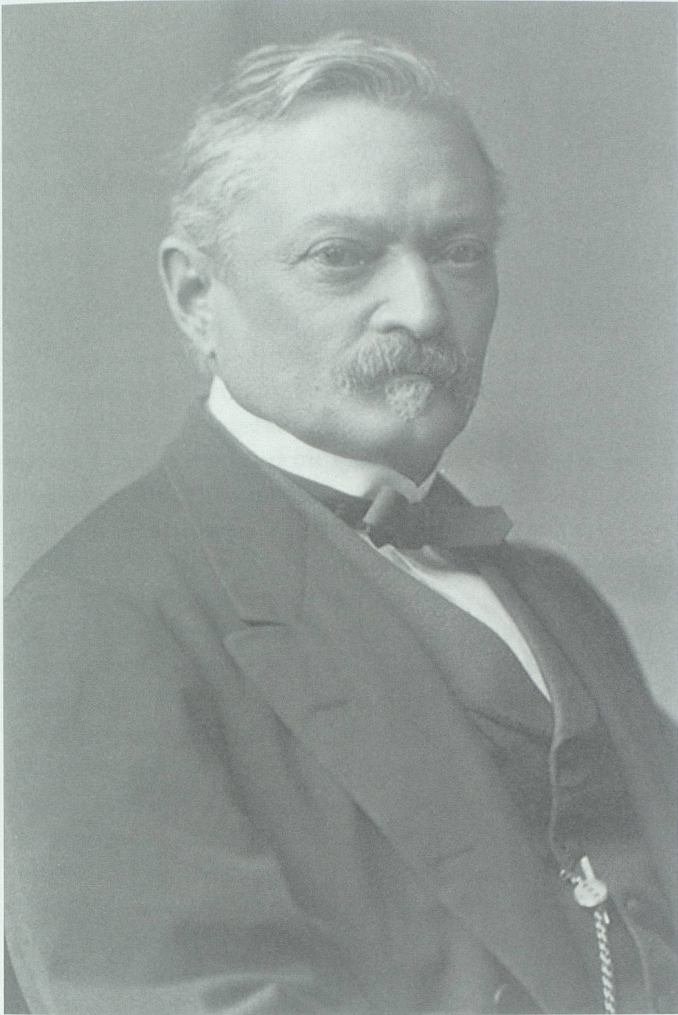
Arnold Otto Aepli (1816–1897), in der zweiten Hälfte des 19. Jahrhunderts der wohl am breitesten engagierte Schweizer Staatsmann.