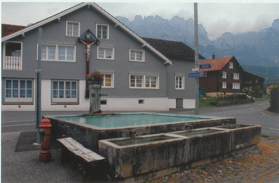
Der Brunnen am Gasenzler Dörfliplatz – manchmal auch eine Einladung zum Bade.

Zurück zum Treffpunkt: Oftmals scharenweise trafen sich die Kinder auf dem Platz zu Spiel und Schabernack. Bei Regenwetter einigte man sich rasch auf angrenzende Ställe, Remisen oder