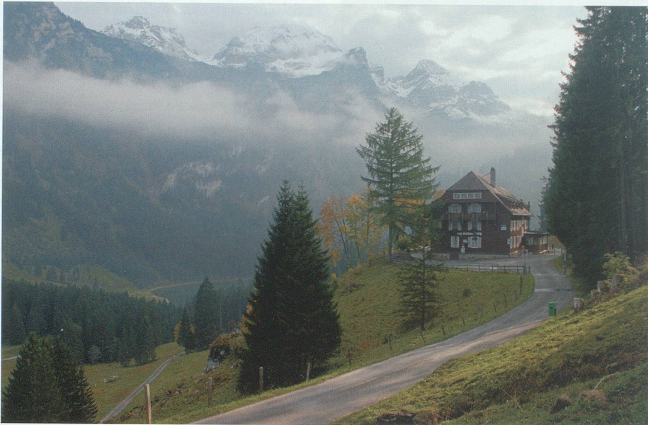
Höhen und Tiefen erlebt: das altehrwürdige Kurhaus Voralp.

Schafe, keine Menschenseele. Der Blick zurück ostwärts gibt jetzt den industrialisierten Talboden nicht mehr frei, dafür umso eindrucklicher die Drei Schwestern und die Voralpberger Erhebungen.