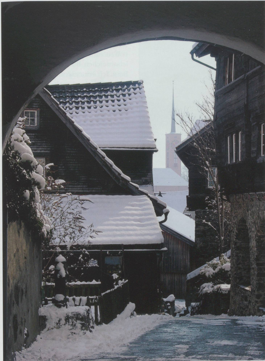
Etwas, das man immer wieder anschauen muss: das Städtchen Werdenberg.