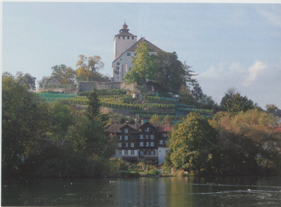
Schloss und Städtchen Werdenberg. Foto Hans Jakob Reich, Salez

Das Städtchen Werdenberg hat für mich eine ganz besondere Bedeutung. Darum erinnere ich mich gern an meine Kindergartenzeit zurück. Damals besuchte ich den Kindergarten im Städtli Werdenberg. Da wir früher stets auch samstags den Kindergarten zu besuchen hatten, holte mich mein Vater je-