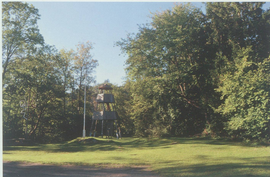
Ein kleines unbewaldetes Fleckchen mitten im Wald: das Schneggenbödeli.

Am Fuss des Buchser Bergs, leicht erhöht im Wald über dem Dorf, liegt der Runggels. Eine Lichtung, aufgeteilt in drei kleine Höfe. Während die beiden vorderen Höfe eher flach sind, steigt