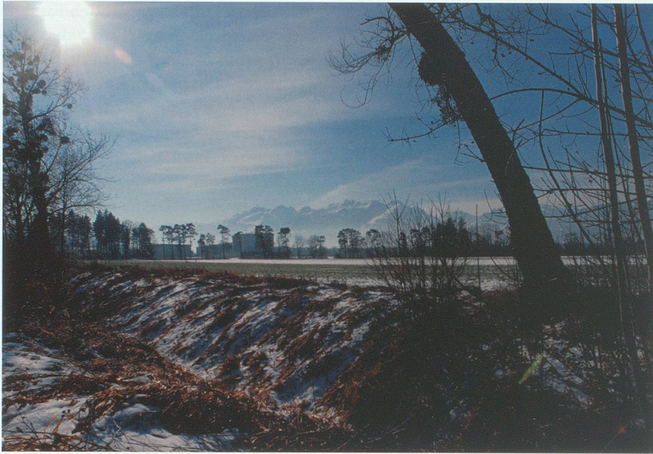
Im Untersand in der Sennwalder Au, die nicht mehr ist, was sie einmal war.