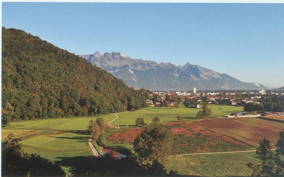
Das Rietli, vorne der Kiessämmler des Röllbachs, hinten in der Mitte der Buchser Ortsteil Wäseli.