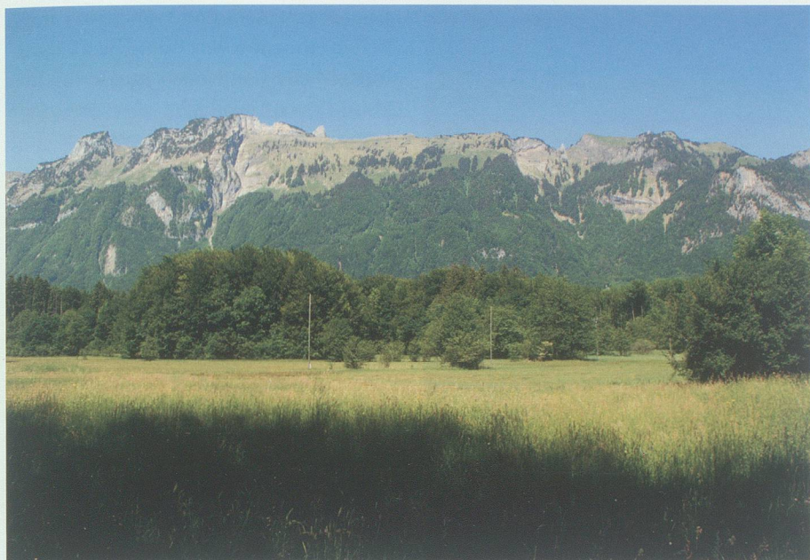
«Wellnessoase, frische Luft und das Gefühl von Freiheit in einem»: das Galgenmad bei Salez.

auf den Körper scheinen lässt, ruhig atmet und sich einfach nur auf die Umgebung konzentriert, hat man Wellnessoase, frische Luft und das Gefühl von Freiheit in einem.