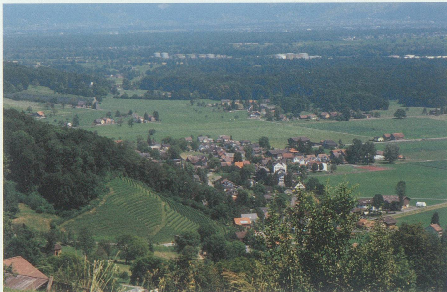
Frümisen am Fuss der Stauberer, vorne der 1987 angelegte Wingert, hinten vor dem Schlosswald der Weiler Büsmig.

Dorf, heraus aus der hektischen Umgebung. Viele Kindheitserlebnisse verbinden sich mit meinem Dorf: Waldspaziergänge, Schlittelstrasse, Dorfskirennen, Chlausschellen. Schade finde ich, dass in unserem Dorf keine Einkaufsmöglichkeit mehr vorhanden ist und die Post auch kurz vor der Schliessung