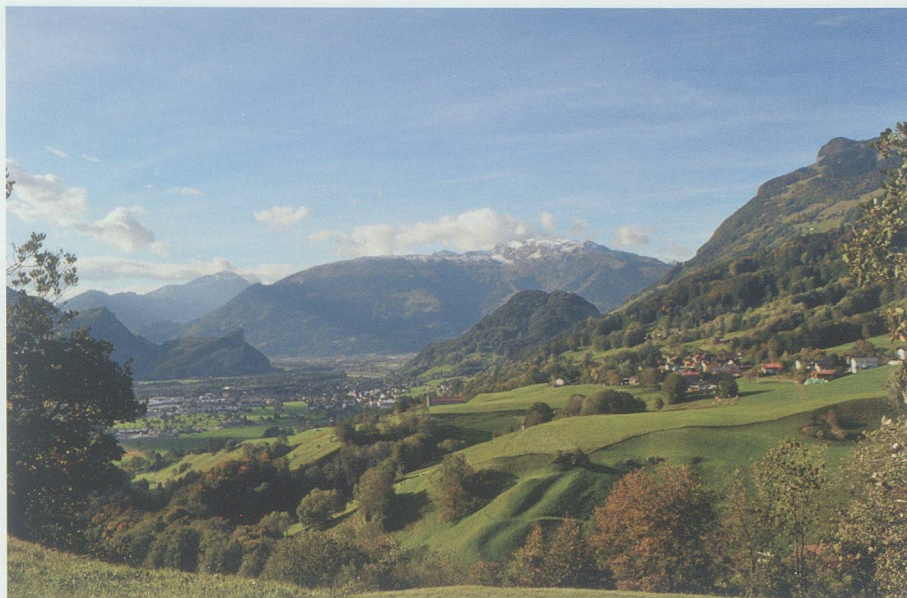
Die Aussicht vom Salzbüel auf Malans (rechts), dahinter Maziferchopf und Gonzen.

Vom Dörfli Gretschins aus führt der Weg erst ins Herrenfeld. Der Name erinnert uns an alte, längst vergangene Zeiten. Auf dem Weg zum Burghügel gibt der Einschnitt zwischen Martinswand und Magletsch den Blick nach Vaduz und Schaan und bis ins liechtensteinische Unterland frei. Da weht immer eine mehr oder weniger scharfe Bise. Weiter zwischen Magerwiesen und den nun wieder gepflegten Rebbergen mit stabilen Trockenmauern geht es dem Burghügel entlang. Mit einer herrlichen Rundschau nach Triesen, den Liechtensteiner Bergen, Balzers, St.Luzisteig und weit in die Bündner Berge wird man hier belohnt. Unten präsentiert sich das Dorf Weite. Im Frühling mit den blühenden Bäumen ein wunderschönes Bild. Noch ein paar Schritte und eine bequeme Bank lädt zum Innehalten ein. Nun wird der Weg schmaler und führt zu einer vor einigen Jahren erstellten Holzterrasse. Über diese erklimme ich der Felswand ent-