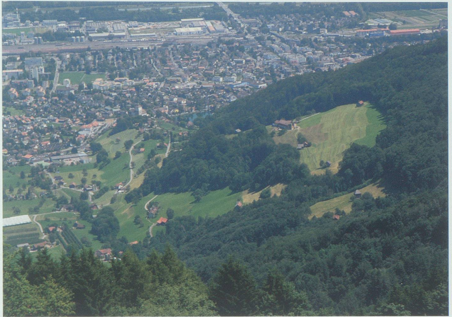
Blick von der Alp Pir auf Werdenberg und Buchs, rechts das waldumsäumte grosse Gut Muntaschin.

Nachdem wir in der Bergstation ausgestiegen waren, warfen wir noch einen Blick zurück und konnten von hier den Altmann, den Wildhuser Schafberg und den Säntis als den wohl bekanntesten Berg des Alpsteingebietes bewundern. Nun begann die eigentliche Wanderung, hinauf zum Ölberg – dem höchsten Punkt der heutigen Etappe. Auf einer Naturstrasse ging es weiter bis zum Lochgatter, und von dort nahmen wir die Abkürzung, auf Wegspuren ging es steil bergab bis zum Voralpsee. Bei dem heimeligen Gasthaus mit Gartenterrasse machten wir einen kurzen Einkehrhalt und bestaunten den prächtigen Felsenkessel, in dem der See sehr romantisch liegt. Dies wäre ein Ort zum