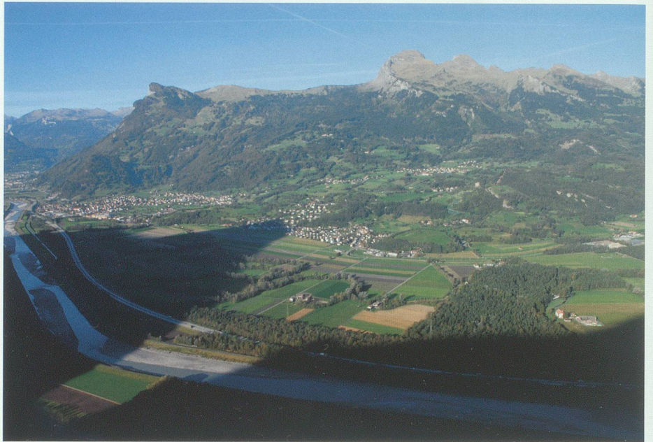
Wartau aus der Vogelschau. Luftaufnahme 2006 Hans Jakob Reich, Salez

11. September 2009. An diesem Tag bekam ich einen ganz neuen Blickwinkel auf meine Wohngemeinde Wartau. Wo ist mein Lieblingsplatz in meiner Bürgergemeinde? So lautete der Auftrag, den ich gefasst hatte. Um den Bericht zu schreiben, überlegte ich lange, was für ein Sujet ich wählen soll, aber ich konnte mich einfach nicht entscheiden, da es viele Plätze gibt, die mir ge-