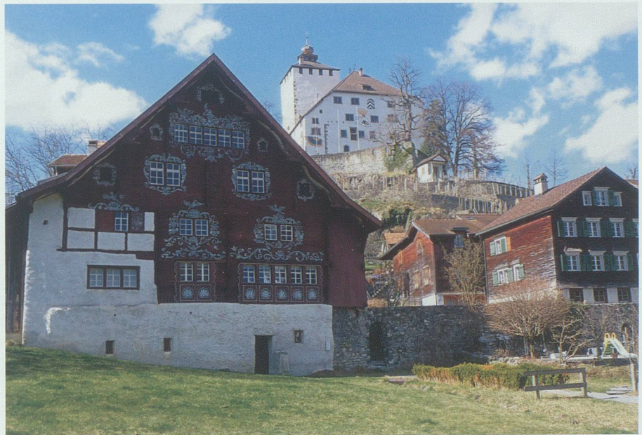
«Das Ganze wirkt sehr gepflegt und nostalgisch.»

Verweilen, was auch von vielen genutzt wird, da man mit dem eigenen Auto wie auch mit dem Postbus hochfahren kann.