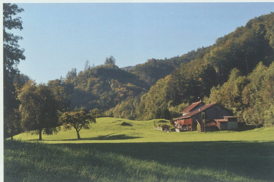
Im Vorderen Runggels mit Blick gegen den Sonnenbüel.

der dritte gegen den Berg hin ziemlich steil an.