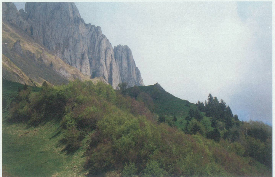
Das Wisenchöpfli zwischen Obetweid und Igadeel.

Für mich ist das Wisenchöpfli dank seiner einzigartigen Lage ein Ort, wo Himmel und Erde sich berühren. Steht man oben, geniesst man in östlicher und südlicher Richtung ein atemberaubendes Panorama aufs Rheintal und die umliegenden Alpen – ein Anblick, der einen weit über die kleinen und grossen Sorgen des Alltags erhebt. Wendet man sich dagegen nach Norden, fühlt man sich angesichts der imposanten, majestätisch in den Himmel aufragenden Kreuzberge wieder ganz