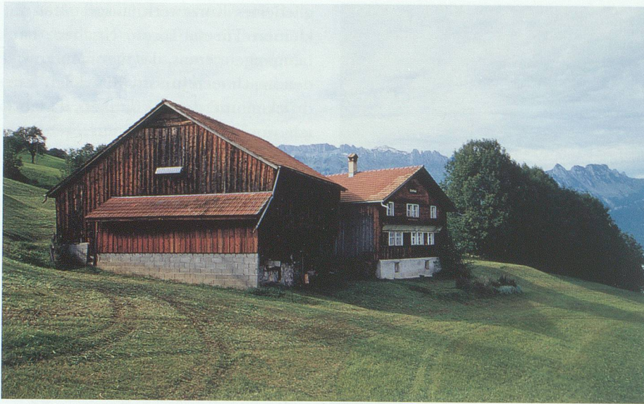
Wo der Zivilisationslärm nur noch von Weitem hochdringt: der Sandbühel.