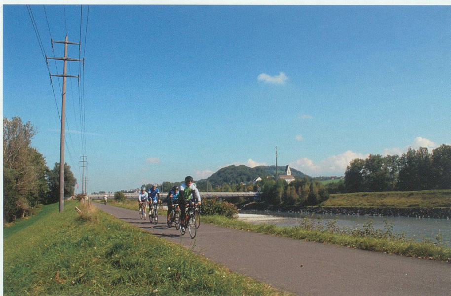
Der Rheindamm bei Haag 2010.

Wenn ich an meine Umgebung denke, das heisst an das Dorf Salez und die nähere Landschaft, denke ich an den grossen, schönen, stillen Wald, der zum Träumen verleitet. Ich denke auch an die stattlichen Berge, die auf beiden Seiten unseres schönen Tales verlaufen. Sie grenzen zwar unseren Horizont etwas ein, geben mir aber das Gefühl von Sicherheit, Geborgenheit und hautnah erlebbarer Natur. Dieses Idyll und die Ruhe in unserem Dorf gefallen mir sehr. Man hat auch einige Plätze, die Rückzugsmöglichkeiten zum Nachdenken bieten. Einer dieser Plätze, der mir sehr gefällt, ist das Galgenmad. Es ist das Sumpfbereich, in dem früher der Galgen stand und durch das die alte Landstrasse zur Burg Forstegg führt, ein Naturweg. Im Sommer ist er von hohen Gräsern und Blumen umgeben. Die Grillen zirpen und die Vögel pfeifen, Bienen, Schmetterlinge und andere Insekten fliegen, und der Wind streicht langsam durch die Gräser. Auf dem Weg selber wächst niedriges Gras, das an den Füssen kitzelt. Nur selten kommt ein Spaziergänger mit seinem Hund vorbei. Es ist still. Einzig das leise Sausen und Brummen ist zu hören. Wenn man sich da hinlegt, die Sonne