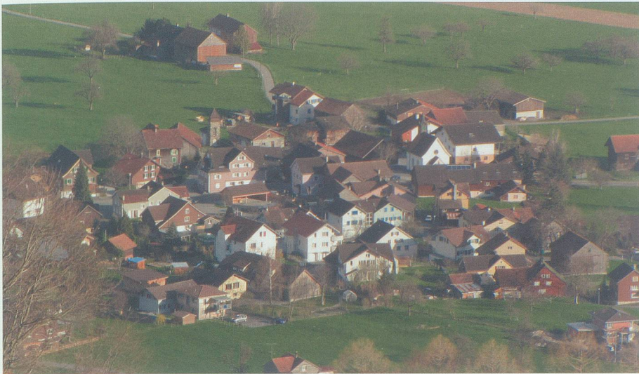
Den Charme bewahrt und noch immer eine bauliche Einheit: das Dörfli Gasenzen.