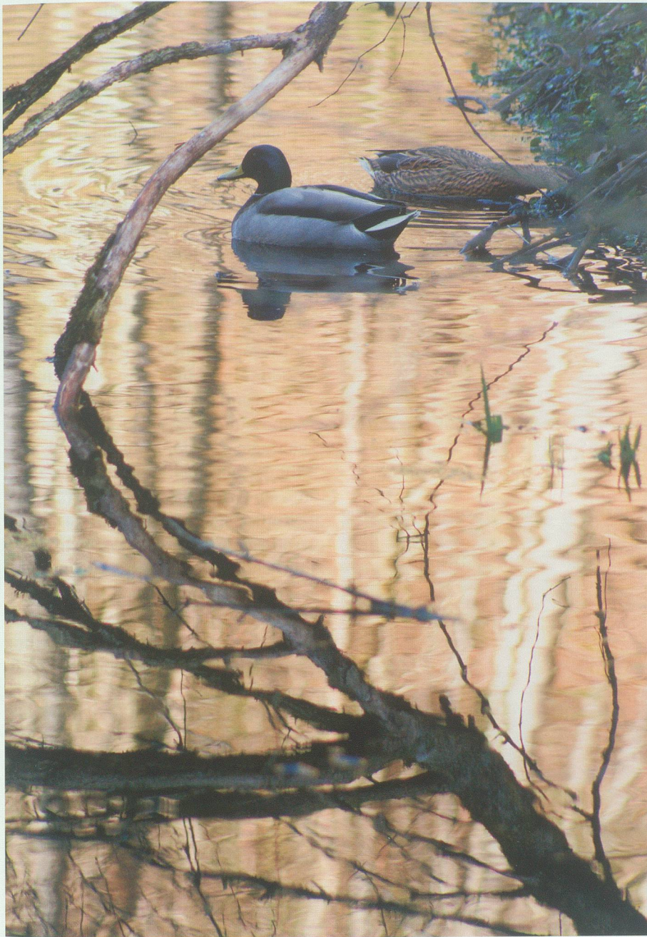
Stockenten im Vorderen Ifelgup.

ling ist gekommen. Ich laufe den Kiesweg hoch durch den schönen Wald, in welchem ich vor knapp sechs Jahren gekocht, gebastelt und gebaut habe, in der «Waldwoche». Momente, die ich zum Teil wahrscheinlich nie vergessen werde. Am Bienenhaus vorbei und über die Waldwiese bis zu den Weihern im Vorderen Ifelgup. Ich setze mich auf die Jacke und schaue meinem Hund zu, wie er die Gerüche der Wildtiere riecht