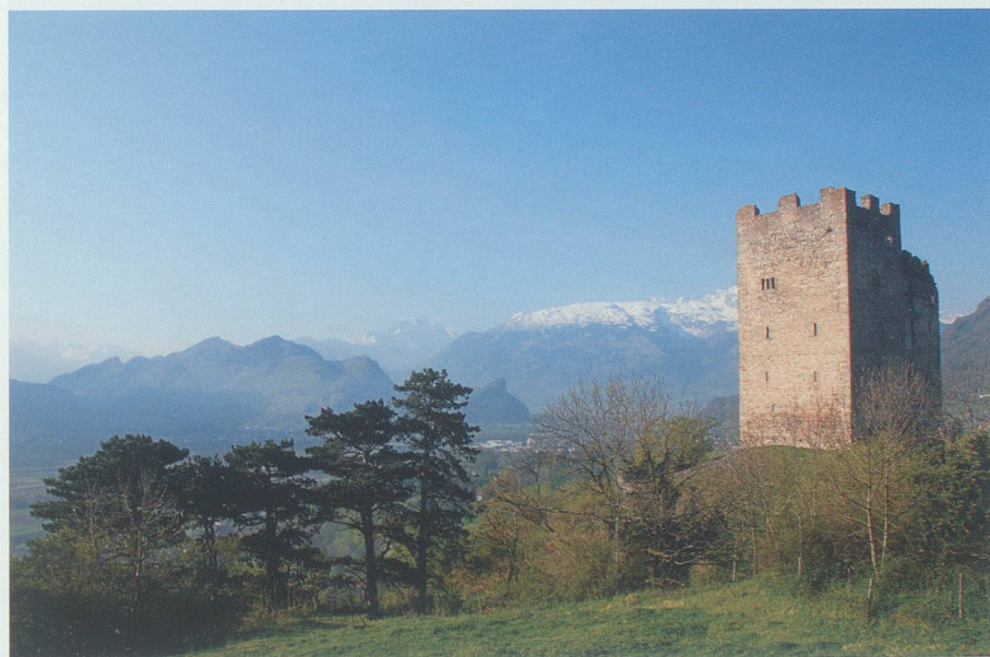
Ruine Wartau vom Ochsenberg her.

lang die kleine Mulde hinter der Burgruine. Für mich ist das ein ganz besonderer Ort. Rechts der St.Martinsberg [Ochsenberg], auf dem eine längst verfallene Siedlung unter der Grasdecke gut verborgen liegt, und links die gewaltige Nord-Ost-Mauer der Burgruine Wartau. Ist Ehrfurcht wohl das richtige Wort, um meine Gefühle, die ich hier spüre, auszudrücken?