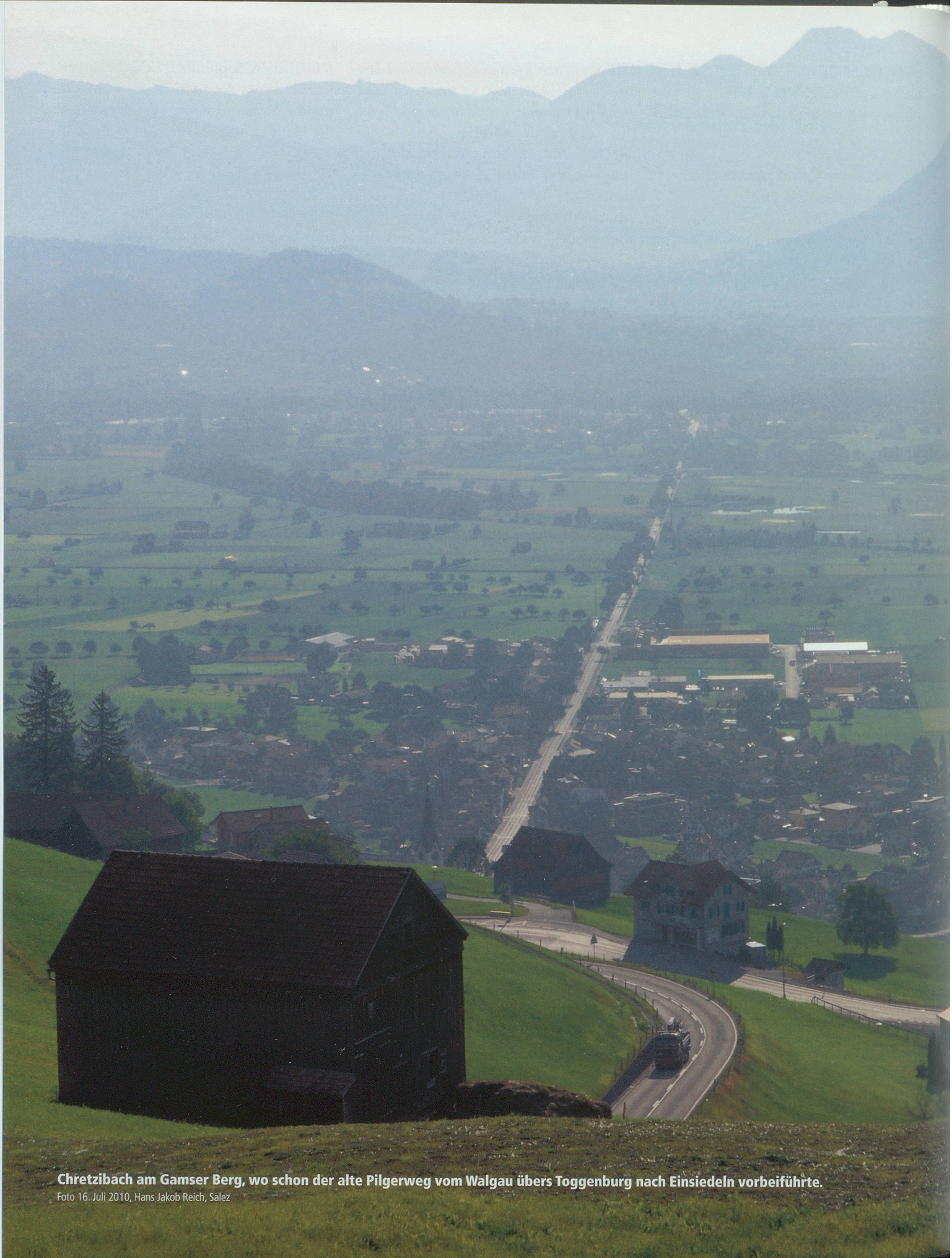
Chretzibach am Gamser Berg, wo schon der alte Pilgerweg vom Walgau übers Toggenburg nach Einsiedeln vorbeiführte.

Foto 16. Juli 2010, Hans Jakob Reich, Salez