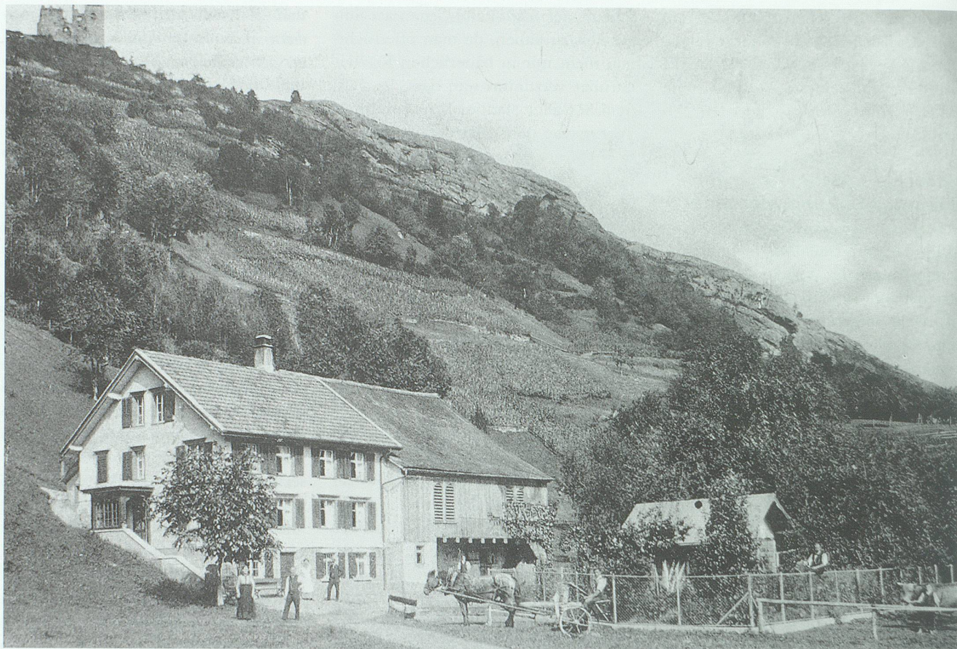
Der Bauernbetrieb Schalär am Fuss des Wartauer Burghügels steht ebenfalls am Rand von melioriertem Boden: beim Murriser Riet, in der Talschüssel nördlich des Dorfes Weite, dessen Bewohner man nicht ohne Grund scherzweise als «Fröschni» bezeichnete. Aufnahme um 1920. Bild bei Hansjakob Gabathuler, Buchs

liche Interessen fixiert gewesen sein. Offenbar lag die fehlende Sympathie auch in seiner Persönlichkeit und seinem Umgang mit den Leuten begründet; seine «Kompromisslosigkeit» und seine «draufgängerische Art» brachten ihm «viele Gegner auf politischer Ebene» ein. 34