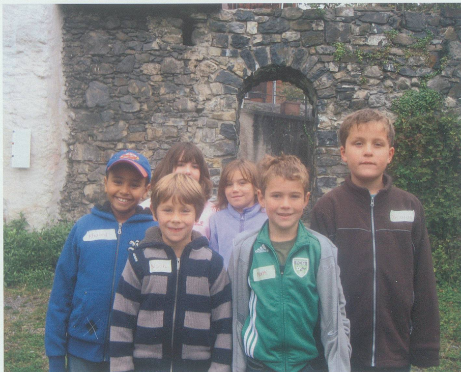
Spass im und rund ums Schlangenhaus anlässlich des Ferienpasses der Gemeinde Grabs.

Während der Herbstferien war das Schlangenhaus Ziel einer Gruppe von interessierten Grabser Schülerinnen und Schülern, die im Rahmen des Ferienpasses das Museum besuchten. Während die eine Gruppe durchs Haus geführt wurde, begab sich die andere auf eine Foto-Schnitzeljagd durchs