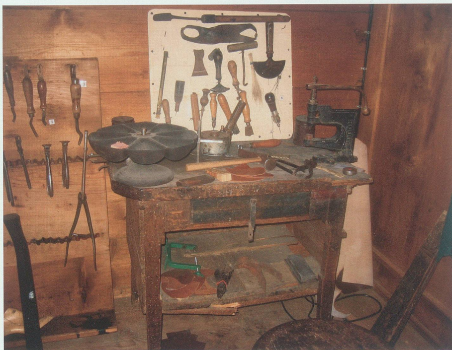
Ein heute selten gewordener Anblick: eine Schuhmacherwerkstatt mit diversen Spezialwerkzeugen.

Das Angebot für Schulen, das Schnitzeljagd und Führung umfasst, kann über Tourismus Werdenberg auch ausserhalb der Ferienzeit gebucht werden.