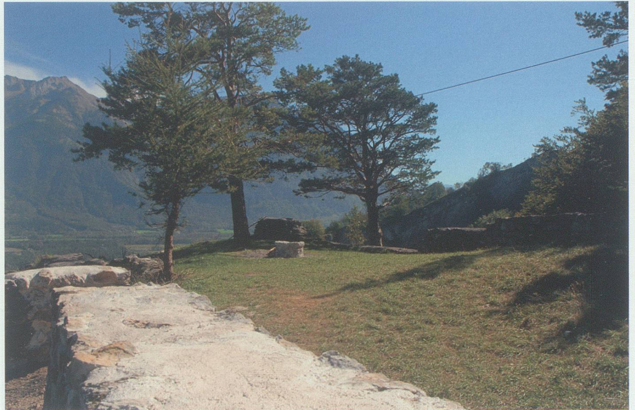
Auf der im Sommer 2010 vor dem weiteren Verfall gesicherten Procha Burg.

Die Messerschmiede am Farbbach wurde nach ihrer Versetzung von ihrem ursprünglichen an den heutigen Standort im Jahr 1987 wieder eröffnet. Sie geriet infolge verschiedener widriger Umstände nahezu in Vergessenheit und steht mittlerweile auch wegen diverser sie verdeckender Bauten ziemlich unbeachtet. Zusammen mit dem Mülbachverein möchte die HHVW die Messerschmiede an einen geeigneten Platz