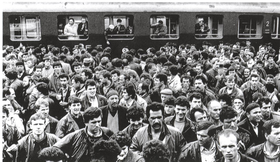
Ankunft jugoslawischer Saisonarbeiter 1988 in der Schweiz, die zu einem grossen Teil mit dem «Belgrad-Express» via Buchs einreisten.

Mit zunehmendem Wirtschaftsaufschwung in den kriegsgeschädigten Nachbarländern liess die Attraktivität der Schweiz im Verlauf der 50er Jahre nach. Deutschlands Arbeitsmarkt wurde 1964 mit der Einführung der Arbeitnehmerfreizügigkeit in der Europäischen Wirtschaftsgemeinschaft (EWG) gestärkt und zur Konkurrenzdestination der Arbeitswanderung über die Alpen. Die Zahl italienischer Zuwanderer in die Schweiz ging zurück. An ihre Stelle traten Arbeitskräfte aus weiter entfernten Ländern: Spanien, Portugal, Jugoslawien, Griechenland und Türkei. Insgesamt reisten zwischen 1951 und 1970 2,68 Millionen Men-