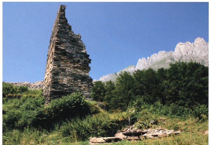
Hochmittelalterliche Burgen des aus Süddeutschland zugewanderten «rätischen» Adels (von oben links): Sagogn, Santa Maria in Calanca, Mesocco, Hohensax.

rätien) immer noch weitgehend aus Romanen.