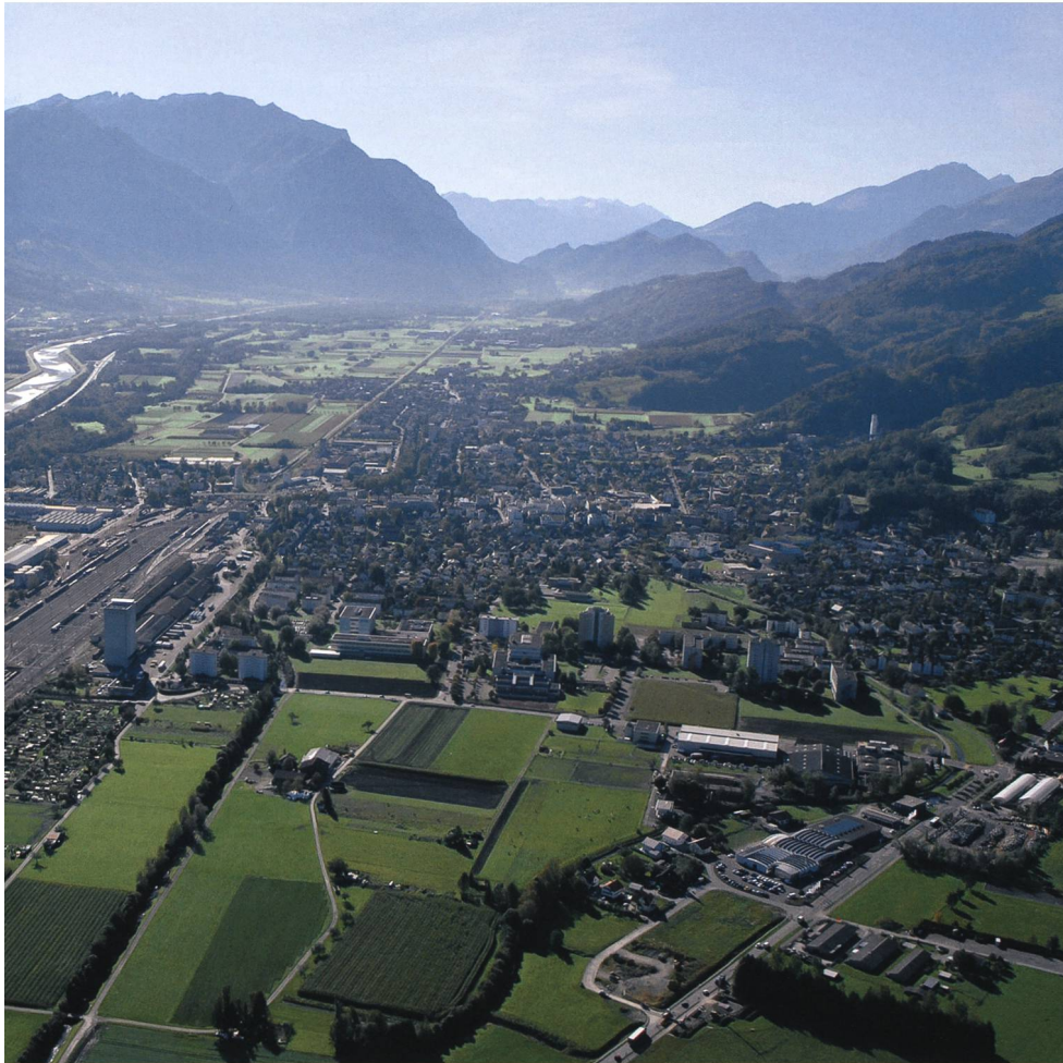
Das Alpenrheintal ist seit jeher Transitland mit schon in der Frühzeit alpenquerendem Austausch. Luftaufnahme 2006 Hans Jakob Reich, Salez

gion geplant sein. Menschen wollen durch ihre Wanderung Chancen nutzen, ihre wirtschaftliche und soziale Situation im Zielgebiet zu verbessern – vor allem, wenn zwischen dem Herkunfts- und dem Zielgebiet ein ökonomisches Gefälle besteht, und sei es auch nur in einzelnen Branchen. Geldüberweisungen der Arbeitswanderer an die Familie zuhause sollen das Los im wirtschaftlich schwächeren Gebiet erleichtern.