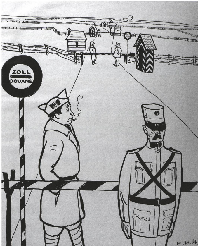
Diese Karikatur in der Flüchtlingszeitschrift «Über die Grenzen», 1945/ Nr. 14, ist betitelt mit: «'Begrenztes' Europa oder europäische Ueberlandstraße».

ETH, Archiv für Zeitgeschichte, NL Otto Zaugg, VE 6.8.1