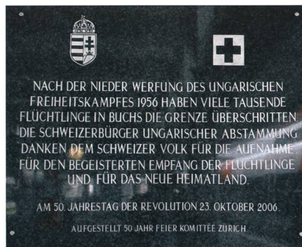
Gedenkplatte im Bahnhof Buchs zur Erinnerung an die Ungarn-Flüchtlinge von 1956.

2010 betrug der Ausländeranteil in der Schweiz 22,4 Prozent. Die Zuwanderer stammen aus den unterschiedlichsten Ländern und sozialen Schichten. Sie sind sowohl in hochqualifizierten als auch einfachen Berufen tätig. Im Kanton St.Gallen leben zurzeit Menschen aus über 150 Ländern. 67