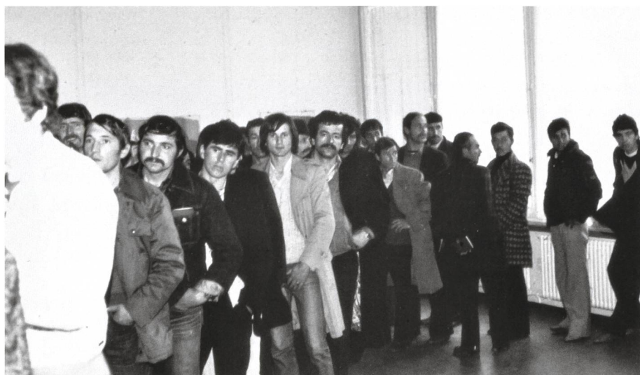
Jugoslawische Saisoniers stehen Schlange für die grenzsanitarische Untersuchung im Postgebäude Buchs, 1980.

Die ausländischen Arbeitskräfte verrichteten oft unattraktive, bei Schweizern nicht beliebte und schlecht bezahlte Arbeit. Besser ausgebildete Schweizer, auch aus der Arbeiterschicht, stiegen sozial auf, wurden Vorarbeiter auf dem Bau oder Schichtführer in der Industrie. Die Reallöhne der Schweiz verdoppelten sich in der Wachstumsphase 1945 bis 1975. Es gab aber auch unter den Schweizern Verlie-