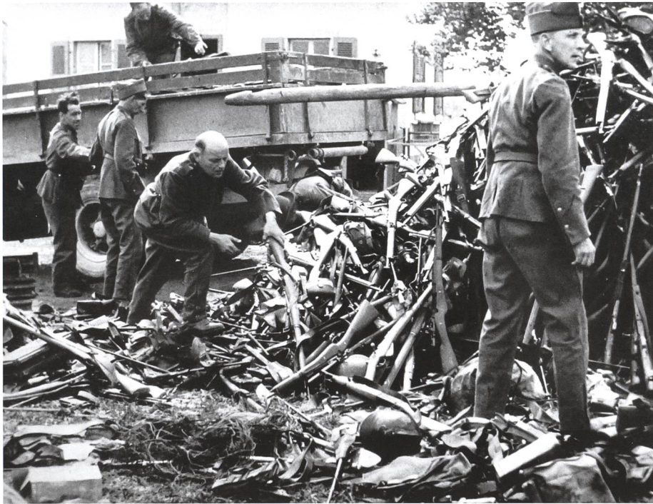
Waffenabgabe bei der Internierung der Spahi-Truppen in der Schweiz 1940.