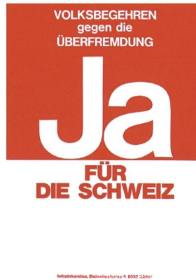
Plakate aus dem Abstimmungskampf um die Überfremdungsinitiative von 1970, die sogenannte Schwarzenbach-Initiative.

rer, die vom Aufschwung nicht in vergleichbarem Masse profitierten. Sie reagierten verbittert und sahen im Zuwanderer den Sündenbock. Sie betrachteten ihn als Eindringling, der schuld war am Wandel in Gesellschaft und Arbeitswelt. Arbeitsmigranten wurden für die Überlastung der Bildungsinstitutionen, der Krankenhäuser und für die Wohnknappheit verantwortlich gemacht. Es kam zu Spannungen. Die Angst vor «Überfremdung» nahm weiter zu. Gleich mehrmals hatten die Schweizerinnen und Schweizer in den 70er und 80er Jahren über Überfremdungsinitiativen abzustimmen. Die bedeutendste war 1970 die Überfremdungsinitiative von einer Gruppe um den Politiker der Nationalen Aktion (NA) James Schwarzenbach . Sie verlangte eine Begrenzung des Ausländeranteils auf 10 Prozent. Nach emotionsgeladener Kampagne wurde das Volksbegehren mit 54 Prozent Nein-Stimmen abgelehnt. Alle grossen Parteien, Unternehmen, Gewerkschaften und Kirchen bekämpften die Initiative. 54