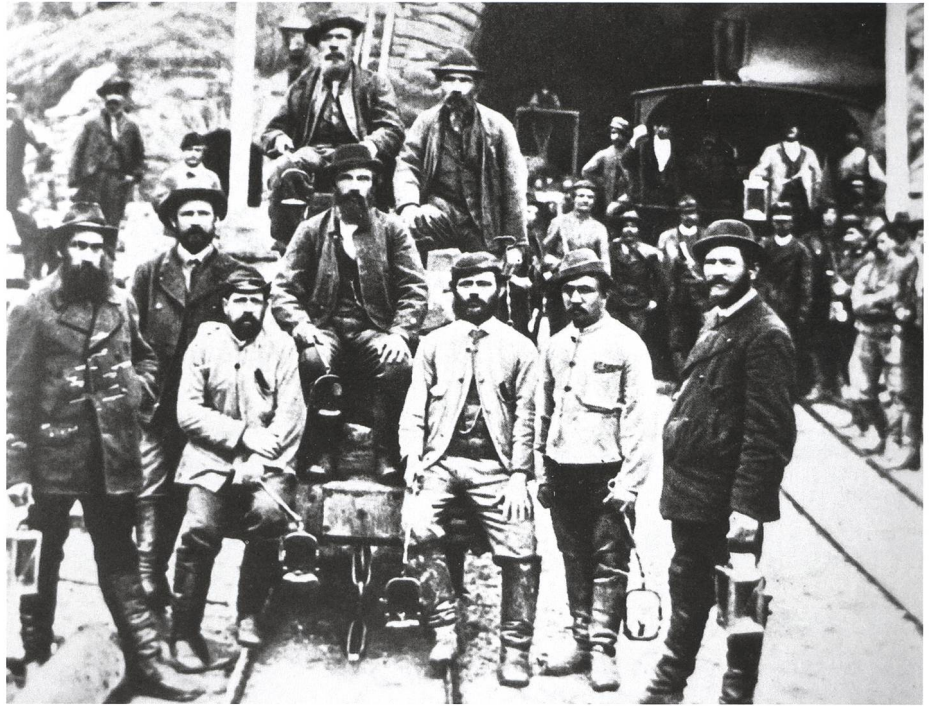
Im Eisenbahn- und im Tunnelbau kamen ab den 1850er Jahren erstmals in grosser Zahl Gastarbeiter vor allem aus Italien zum Einsatz. Gotthardtunnel-Bauarbeiter um 1880 vor dem Portal in Airolo. Public-Domain-Bild

Die Wirtschaft der Schweiz wuchs nach einer Abschwächung in der Zeit weltwirtschaftlicher Krisen 1873–1895 bis zum Ersten Weltkrieg rasant. Mit dem Wirtschaftsaufschwung und dem Ausbau des Eisenbahnnetzes wuchs der Bedarf an Arbeitskräften und technischen Experten. Auf dem Land nahm die Bevölkerung um 20 Prozent zu; zwei Fünftel davon gingen auf Zuwanderung und hohe Geburtenraten von