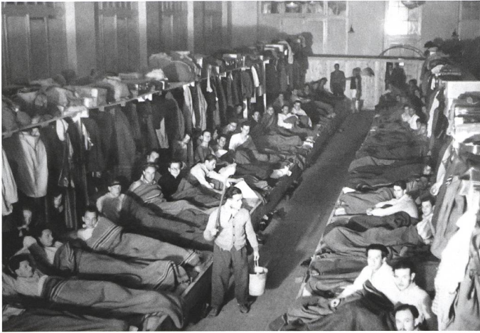
Flüchtlingslager in Diepoldsau.