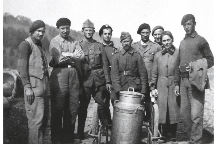
Polnische Militärinternierte in Amlikon TG (1940–45) bei der Arbeit in der Landwirtschaft.

ren die Wege in die Schweiz und aus ihr heraus abgeschnitten. Dennoch fanden während des Krieges rund 300 000