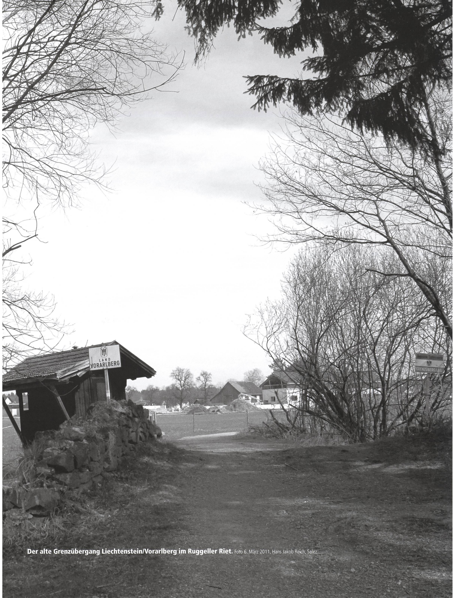
Der alte Grenzübergang Liechtenstein/Vorarlberg im Ruggeller Riet. Foto 6. März 2011, Hans Jakob Reich, Salez