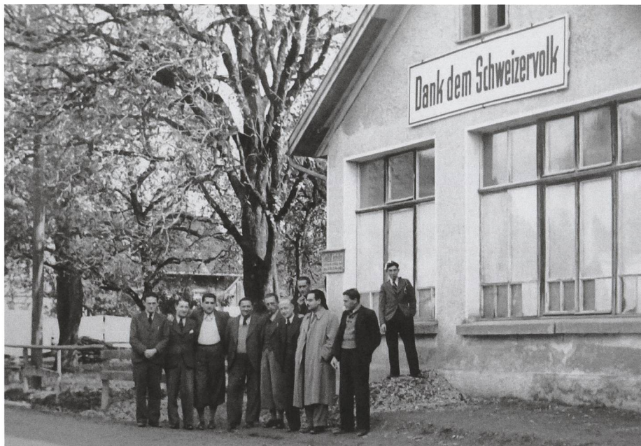
Flüchtlinge bringen ihre Dankbarkeit gegenüber dem Gastland zum Ausdruck.

ETH, Archiv für Zeitgeschichte, IB SIG-Archiv, VE 2539