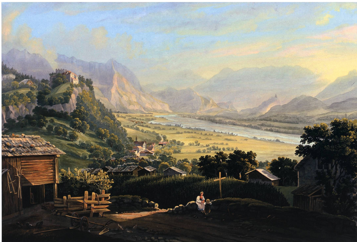
Louis Bleuler, Ansicht von Vaduz um 1830/40. Dieser Blick in Richtung Süden zeigt, dass der Flusslauf des Rheins damals noch grosse Teile des Talbodens für sich beanspruchte. Sammlung Liechtensteinisches Landesmuseum, Vaduz

Die Zahl der Ausländerinnen und Ausländer in Liechtenstein blieb lange Zeit sehr niedrig. Sie stieg erst mit der Industrialisierung ab 1860. Lebten 1852 insgesamt 223 ausländische Personen in Liechtenstein, so waren es 1911 bereits 1346. Dies entsprach einer Steigerung von 2,7 Prozent auf 15,5 Prozent der Wohnbevölkerung. Ab 1860 liessen sich erstmals auch Evangelische in Liechtenstein nieder. 8