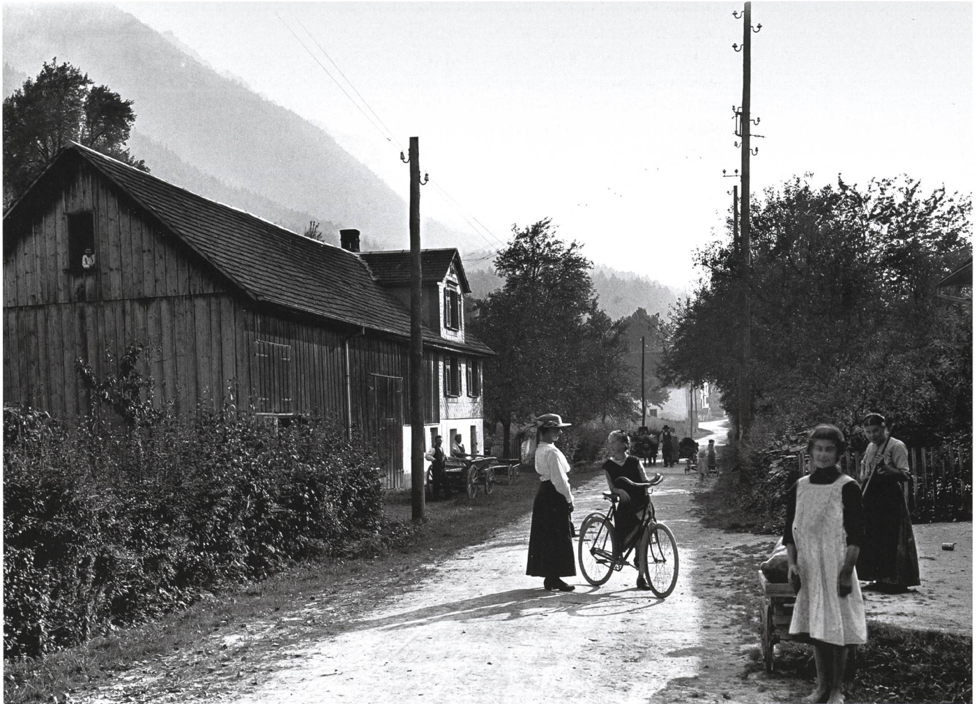
Landstrasse in Schaanwald um 1915. In diesem zur Gemeinde Mauren gehörenden Weiler fand die Familie Schafhitl, vormals heimatlos und 1864 der Gemeinde Mauren zugeteilt, ein vorläufiges Zuhause.

wünschten Verdienste in der Fabrik in Feldkirch nachgehen könne». 66