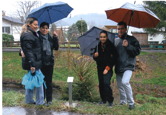
Die Rottanne (Pinheiro) der Portugiesen.

den, andere Treffpunkte auf, als die von der älteren Generation gegründeten Vereine. Sie bevorzugen Bars, Restaurants oder Diskotheken, die zum Teil auch von Migranten zweiter Generation geführt werden. Kartenspiele oder volkstümliche Anlässe verlieren für die älteren Secundas und Secondos an Attraktivität. 14