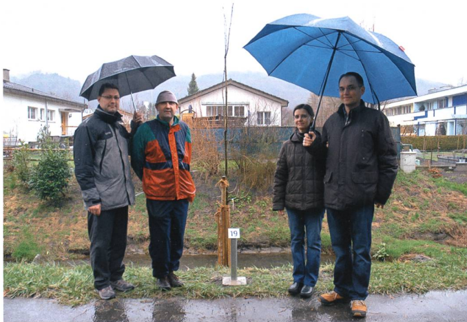
Die Ungarische Eiche (Tölgy) der Ungarn.